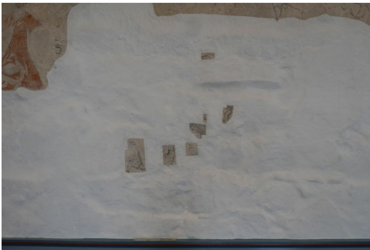
Figur 2: Detalj. Flere små felt med eldre puss og dekorstrek er unnlatt fra nykalking, og fremstår i dag isolert og fragmentarisk.