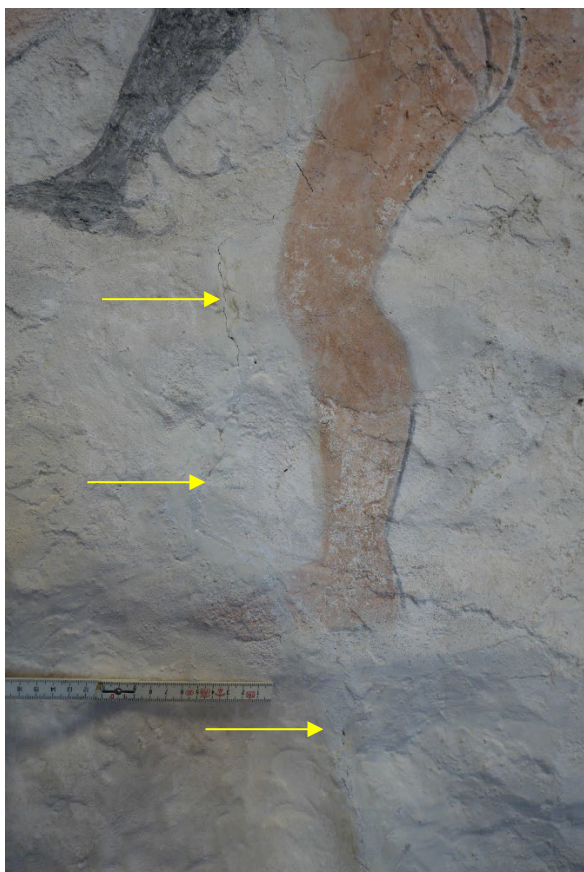
Figur 3: Detalj. Det er observert bom langs med den vertikale sprekken (piler).