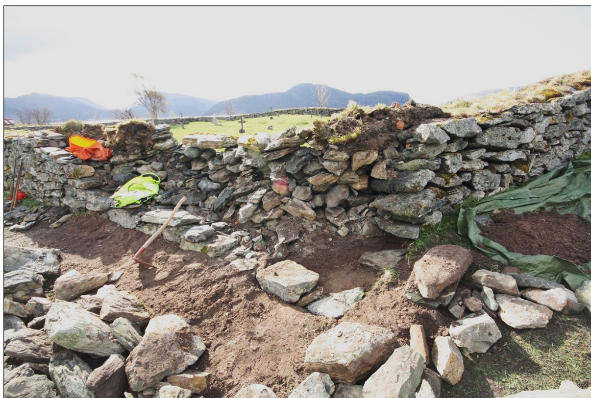
Figur 10. Nordvestre hjørnet av kyrkjegardsmuren, etter at arbeidet med å leggje ned nye grunnsteinar er påbyrja. Mot søraust.