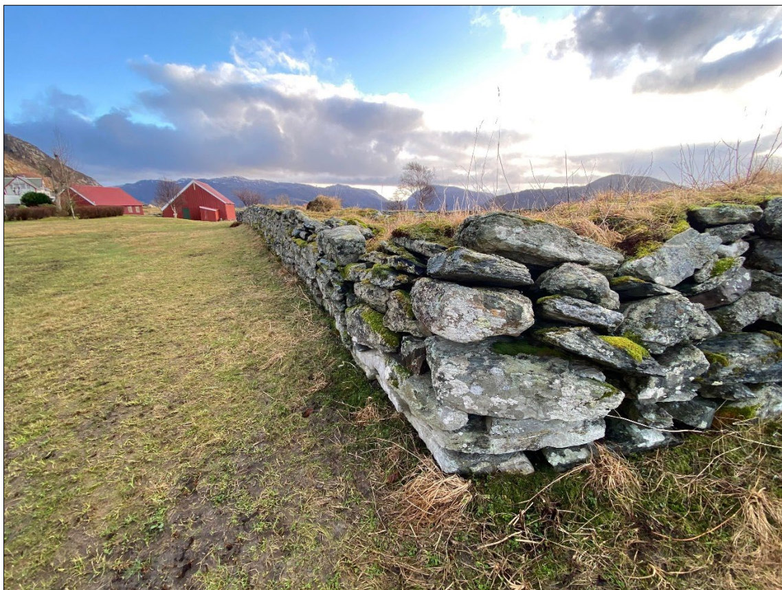
Figur 3. Nordvestre hjørnet av kyrkjegardsmuren, før nedtaking.