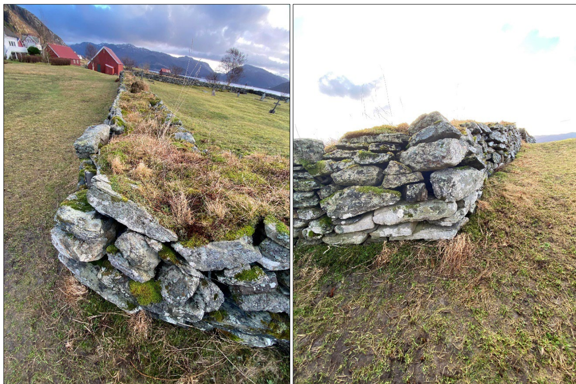
Figur 4. Nordvestre hjørnet av kyrkjegardsmuren, før nedtaking. Mot aust (biletet til venstre) og sør (biletet til høgre).