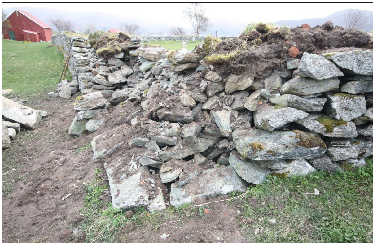
Figur 7. Nordvestre hjørnet av kyrkjegardsmuren, då arkeolog kom på staden. Mot aust/søraust.