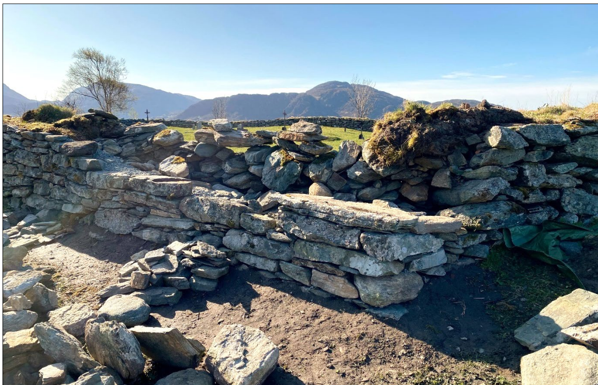
Figur 11. Muren etter at dei nedste sjikta er mura oppatt. Mot søraust.