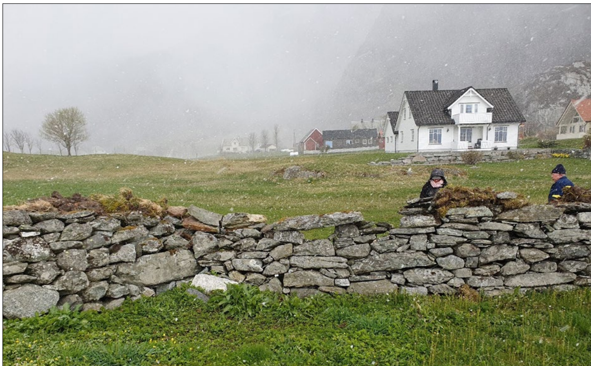
Figur 8. Nordvestre hjørnet av kyrkjegardsmuren, indre del av muren, som vart ståande. Mot nord/nordvest.

Steinane i muren vart plukka ned like til grunnsteinane/fundamentsteinane. Fundamentsteinar som måtte justerast/flyttast på vart løfta ut frå grunnen, og massen under desse vart reinsa fram og dokumentert av arkeolog. Det vart grave noko i grunnen enkelte stader for å jamne ut denne slik at grunnsteinane vart stabile. På det djupaste, i det nordvestre hjørnet, vart det grave om lag 10 cm (sjå Figur 9-10). Massane var lys brun, fin, sandblanda jord, med nokre få fragment av trekol. Det vart ikkje gjort funn av menneskebein, in situ-graver eller andre før-reformatoriske strukturar eller kulturlag under arbeidet. Muren vart bygd opp att etter at arkeolog var reist frå staden (sjå Figur 11).