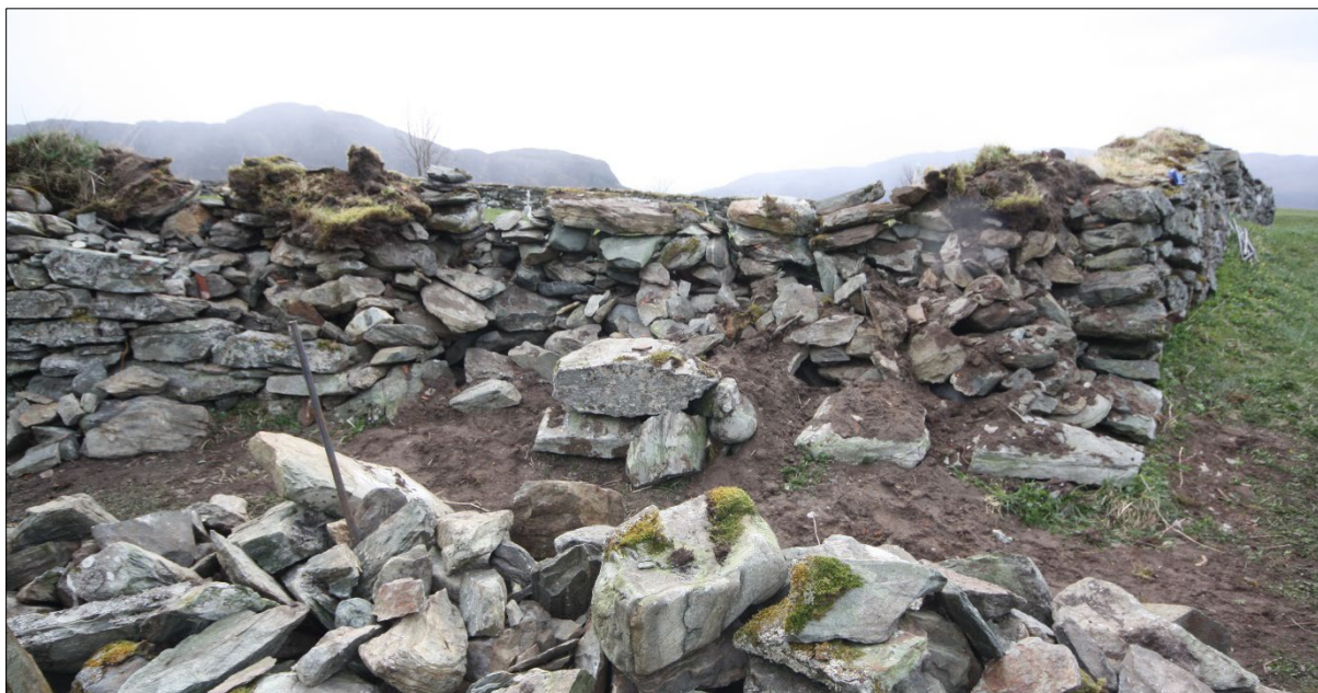
Figur 6. Nordvestre hjørnet av kyrkjegardsmuren, då arkeolog kom på staden. Mot sør.

Då NIKU kom på staden hadde murar byrja å plukka ned steinmuren, og den fremre delen var tatt ned i eit strekk på om lag 4 meter, saman med fyllsteinen i muren (sjå Figur 6-7). Fyllsteinen i muren var grov pukkstein/brotstein, raudtegl og noko jordmassar. Den indre delen av muren, inn mot kyrkjegarden, vart ikkje tatt ned.