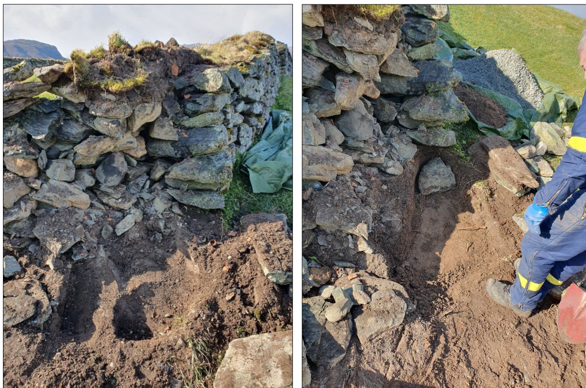
Figur 9. Fjerning av grunnsteinar i hjørnet av kyrkjegardsmuren, utjamning av grunnen og plassering og stabilisering av nye steinar.