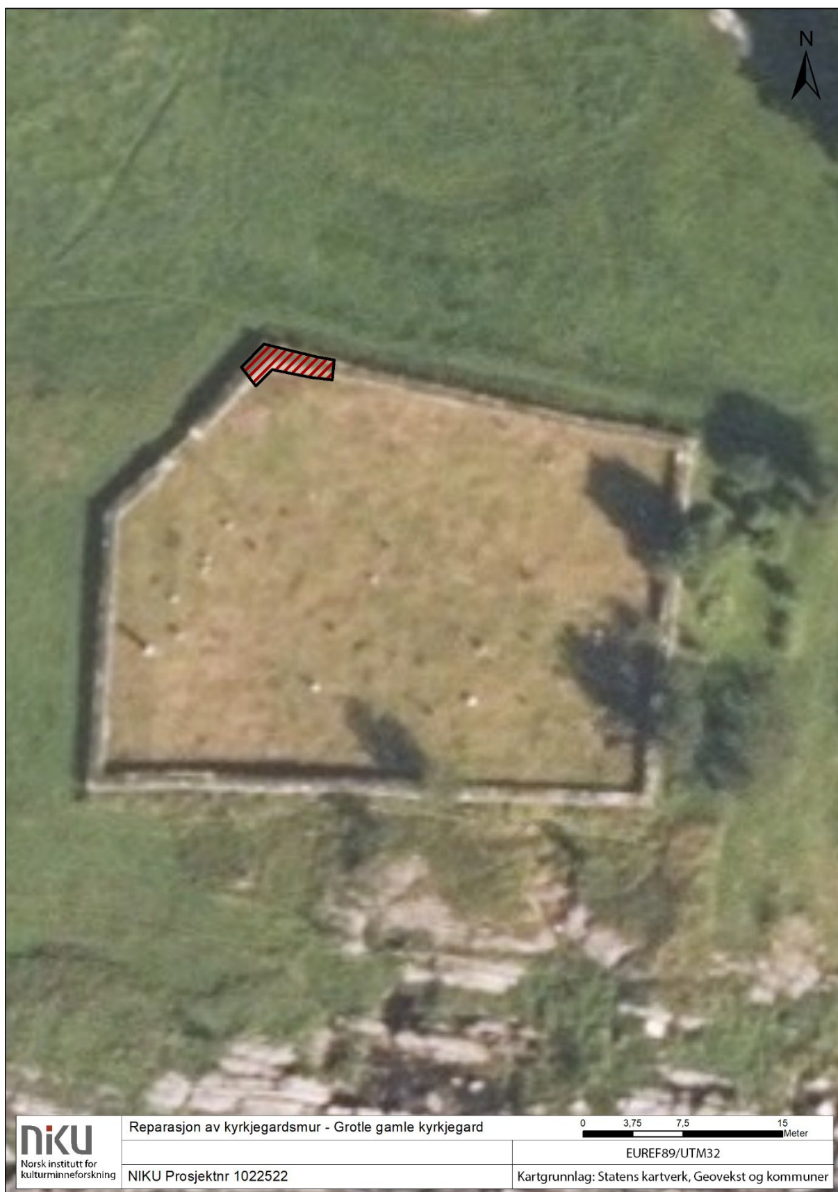
Figur 2. Flyfoto over Grotle gamle kyrkjegard, strekket av muren som vart reparert er vist med raud skravur.