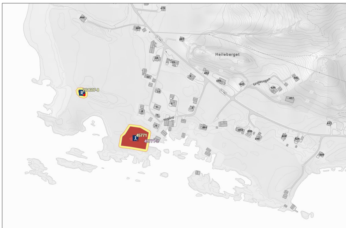
Figur 1. Det automatisk freda kulturminnet Grotle gamle kyrkjegard, kulturminne-id 45771 (Kart frå Askeladden.ra.no).

I søknaden var det vidare presisert at dersom det viste seg under arbeidet at den indre muren ikkje var stødig, kunne den støttast opp, eller ein kunne vere nøydd til å også ta ned denne delen av muren.