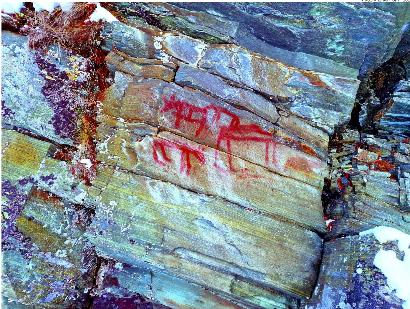
Bergkunst ved Espedalsvannet i Innlandet. Bildene er behandlet så detaljene kommer fram. NIKU jobber tverrfaglig med dokumentasjon og undersøkelse av bergkunst, og dette prosjektet ble gjennomført ved ansatte fra tre av NIKUs avdelinger.