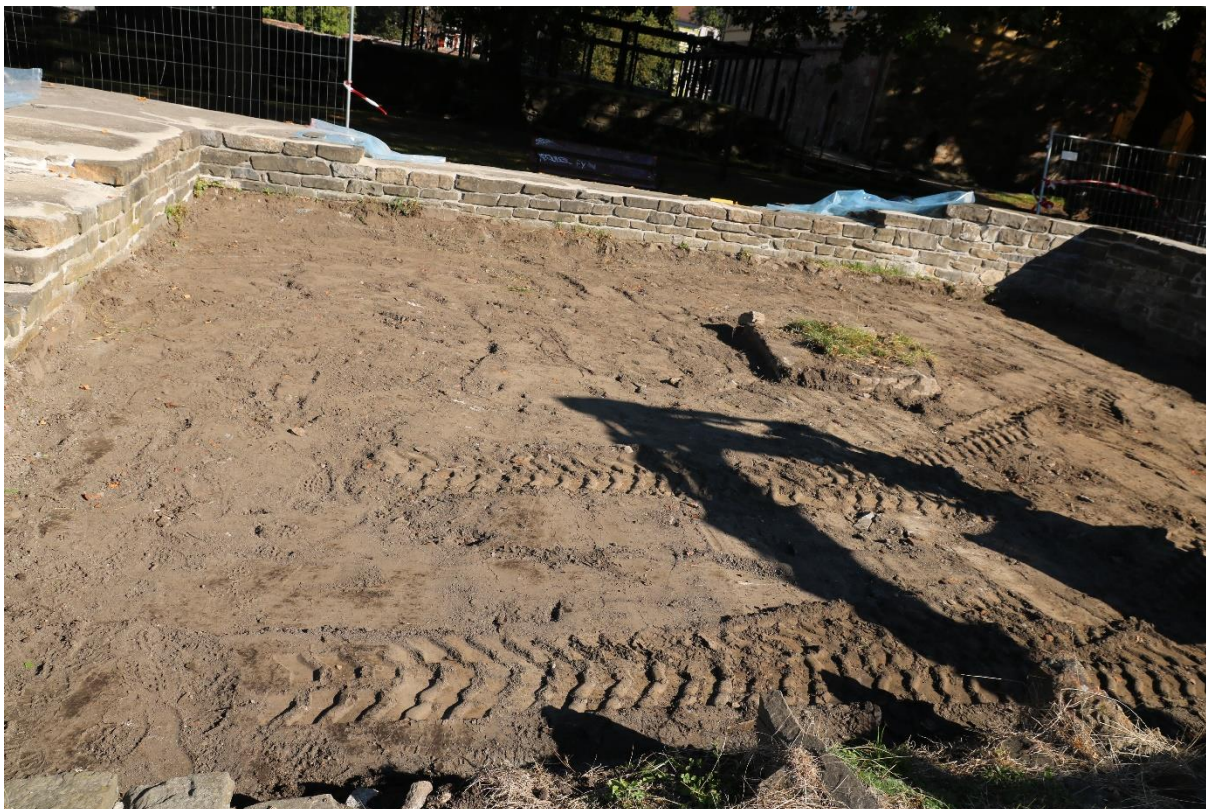
Figur 6: Gresstorva fjernet i nordre tverrskip. Foto-nr: Cf54083_NIKU_31.