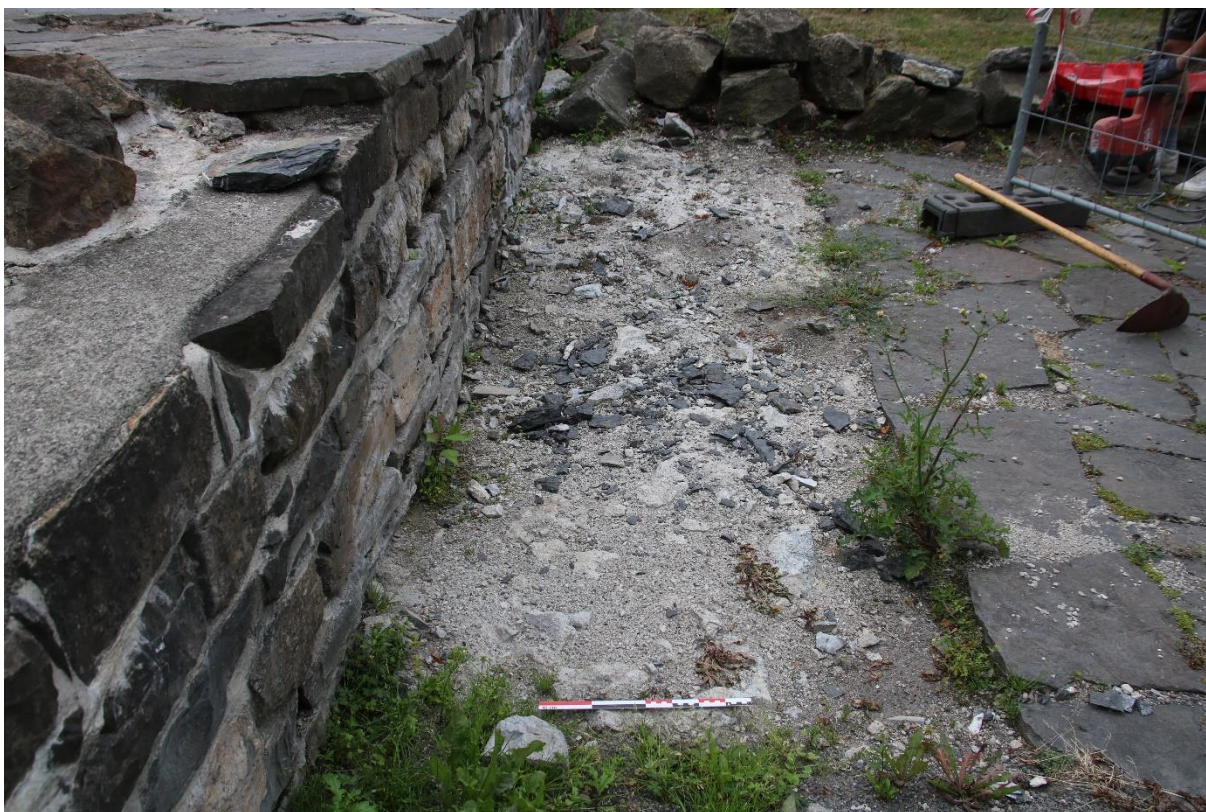
Figur 3: Tiltak 6, området ved vesttrappen ved oppstart. Foto-nr: Cf54083_NIKU_01.