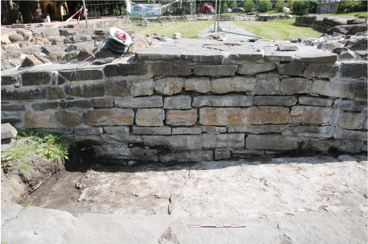
Figur 4: Bunn av tiltak 6s gravedybde. Foto-nr: Cf54083_NIKU_10.