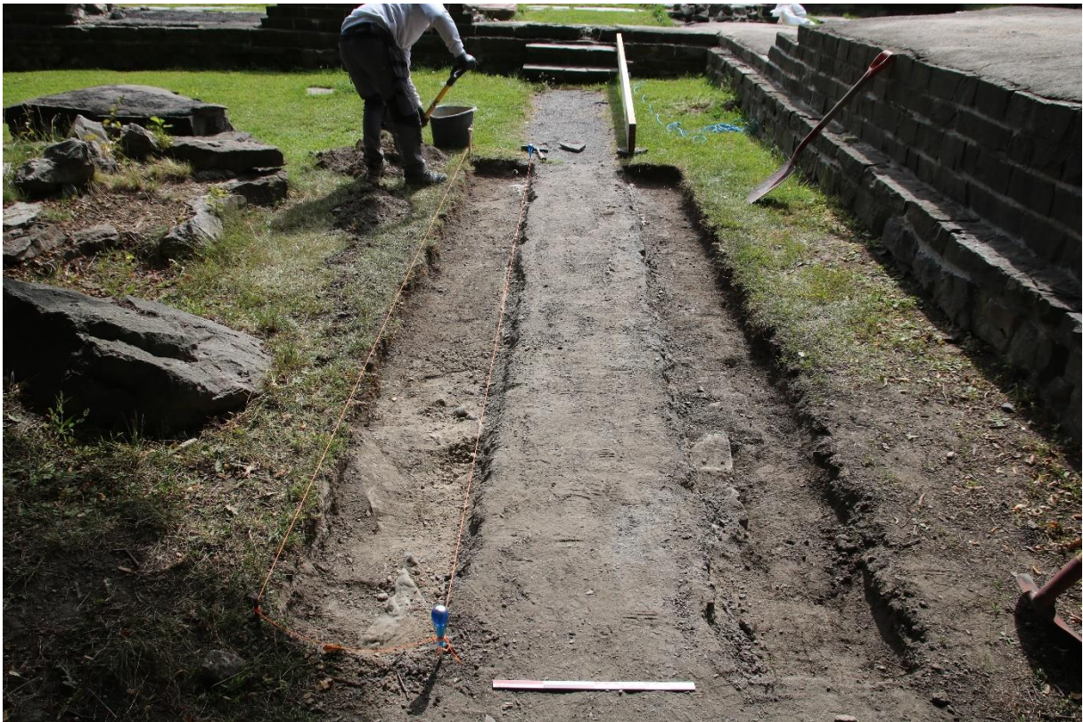
Figur 5: Sjaktene for fundamentering av rullestolrampe ferdig gravd. Foto-nr: Cf54083_NIKU_13.