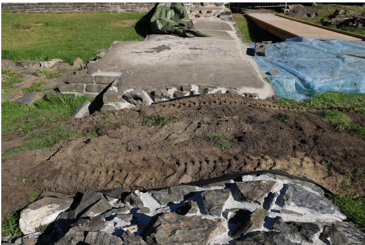
Figur 2: Tildekking av middelaldersk murverk. Foto-nr: Cf54083_NIKU_25.