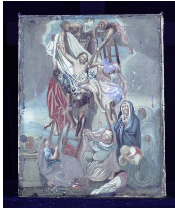
Figur 22 Nedtakelsen av korset i UV-belysning før behandling