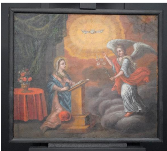
Figur 18 Bebudelsen etter behandling