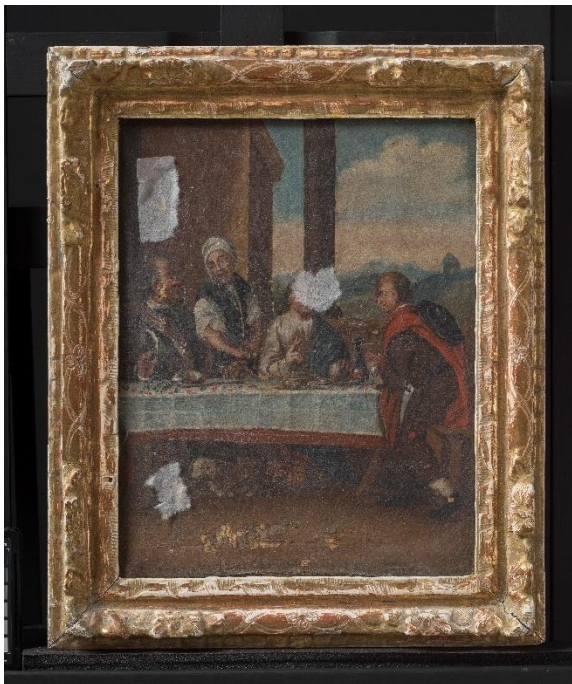
Figur 1: Måltidet i Emmaus, før behandling