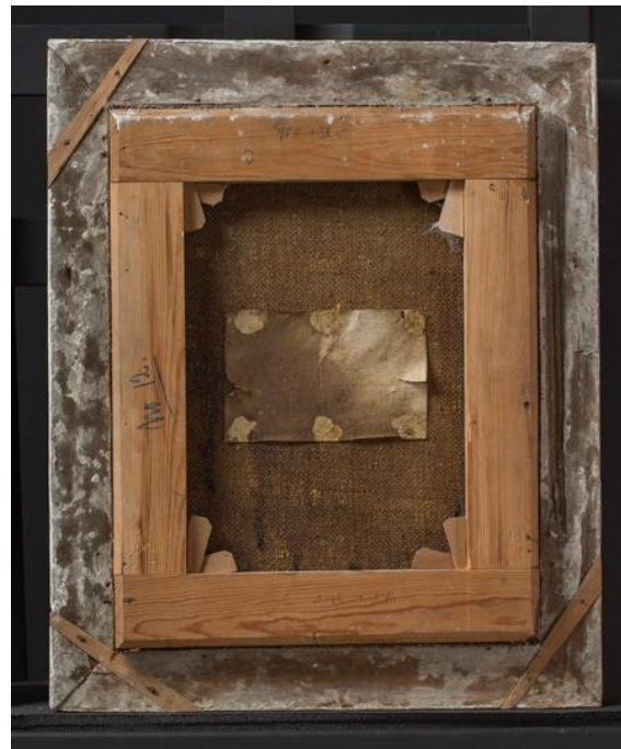
Figur 2: Måltidet i Emmaus, bakside før behandling

Maleriet er i olje på lerret montert på blindramme med kiler. Maleriet forestiller måltidet i Emmaus der Jesus gir seg til kjenne for disiplene (Lukas 24, 13)