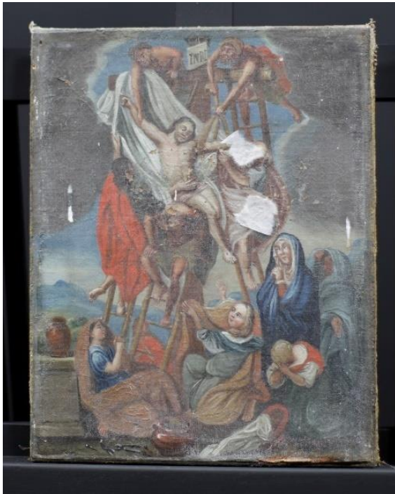
Figur 15 Nedtakelsen fra korset før behandling