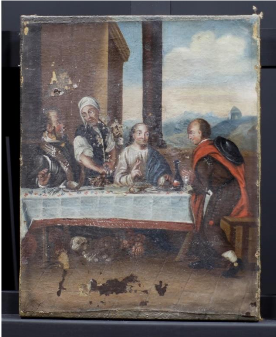
Figur 9 Måltidet i Emmaus før behandling