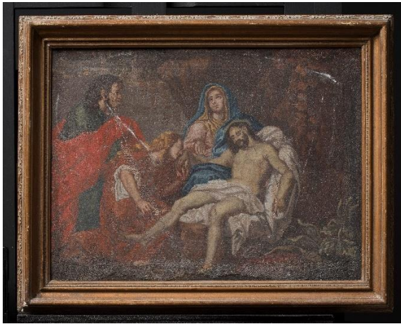
Figur 5 Begråtelsen før behandling

Maleriet, som er malt i olje på lerret, forestiller Jesu begråtelse, der den døde Jesus hviler i Marias armer. Maria Magdalena og disippelen Johannes er også avbildet.