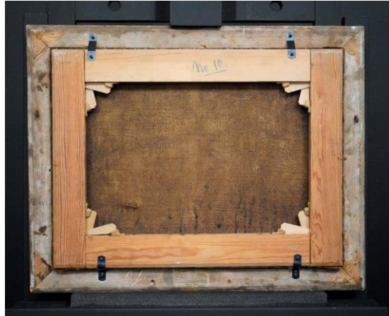
Figur 19 Begråtelsen etter behandling