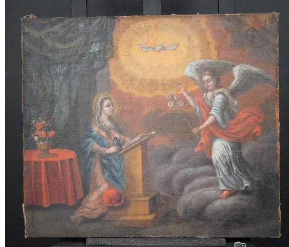
Figur 12 Bebudelsen etter behandling