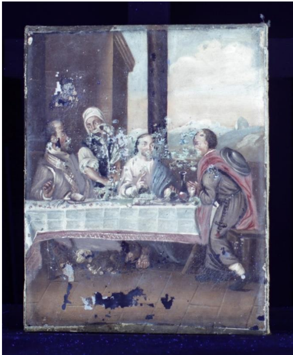
Figur 21 Måltidet i Emmaus i UV-belysning, fersiss, skader og retusjer blir ekstra synlig