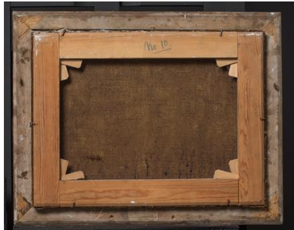
Figur 6: Begråtelsen bakside før behandling