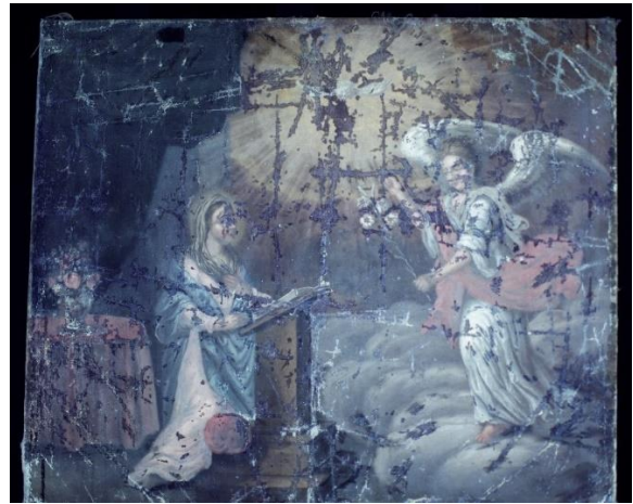
Figur 24 Bebudelsen i UV-belysning. Ferniss og grove retusjer er synlige.