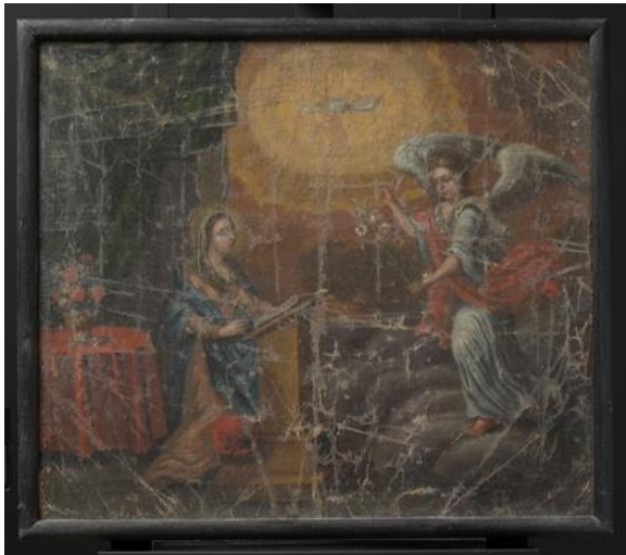
Figur 3 Bebudelsen, forside før behandling

Maleriet viser en bebudelsesscene der engelen Gabriel viser seg for jomfru Maria. Den hellige ånd er avbildet som en due i en gul solskive som dominerer komposisjonen.