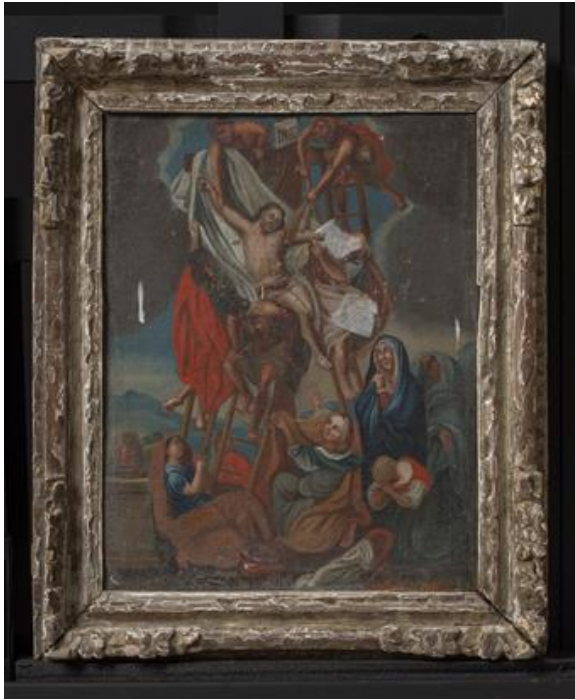
Figur 7: Nedtakelsen fra korset før behandling