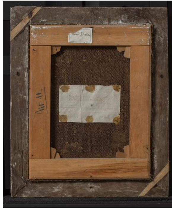
Figur 8: Nedtakelsen fra korset bakside før behandling