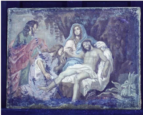
Figur 23 Begråtelsen opptak i UV før behandling