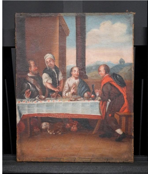
Figur 10 Måltidet i Emmaus etter behandling