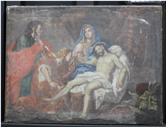
Figur 13 Begråtelsen før behandling. Testområde for fjerning av ferniss i nedre høyre hjørne.