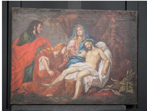
Figur 14 Begråtelsen etter behandling