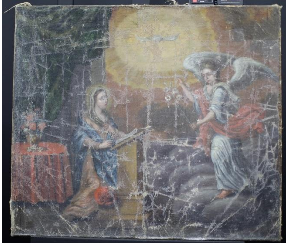
Figur 11 Bebudelsen før behandling