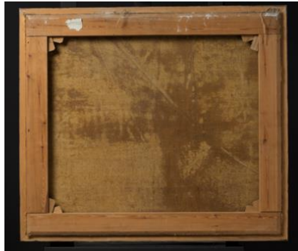
Figur 4 Bebudelsen, bakside før behandling