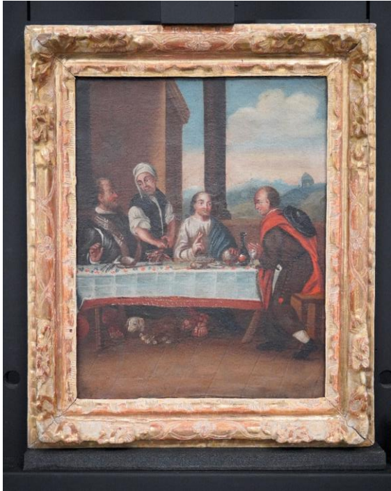
Figur 17 Måltidet i Emmaus etter behandling