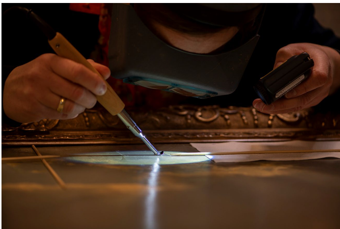
Foto 1: Bruk av varmeskje med melinex mellom varmeskje og malingslag.

Gjennomføring: Påføring av lim med spisspensel, varmeskje 70 °C og bruk av silikonert melinex mellom varmeskje og malingslag (foto 1).