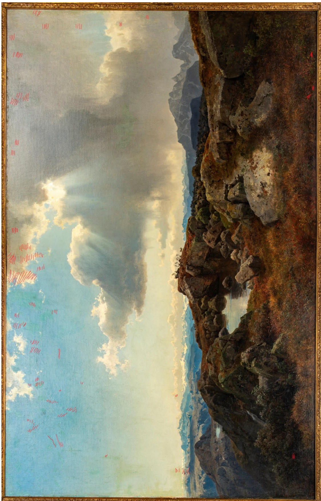
Foto 5: Oversikt over konsoliderte områder i 2023, områdene er markert med røde streker. Bildet er også overlevert som separat billedfil til AAMA sammen med rapporten. Markeringer: NIKU.