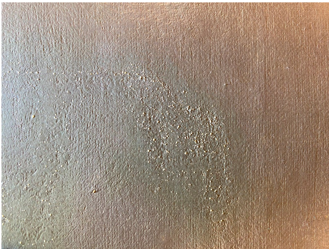
Foto 6: Rester av voks eller annet sekundært materiale på overflaten.

Det er noen steder observert mindre gule prikker som ligger løst på overflaten. De sees kun i lupe. Dette er fra en tidligere restaurering og er trolig voks. De lar seg enkelt plukke av, men med fare for at malingen under blir løs. Det er derfor ikke gjort noe med disse prikkene (foto 6).