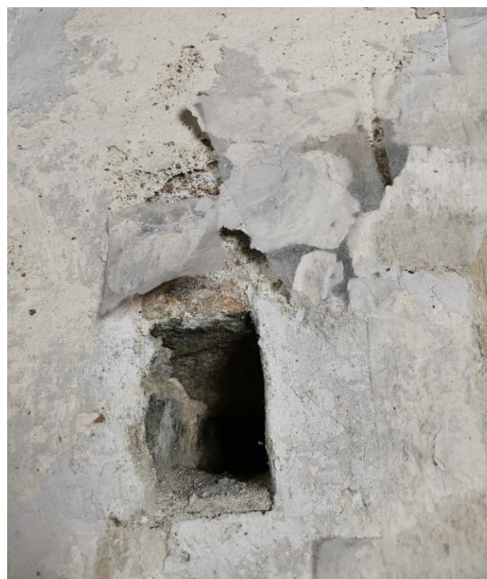
Figur 5: Store løse pussflak har bøyet seg utover.