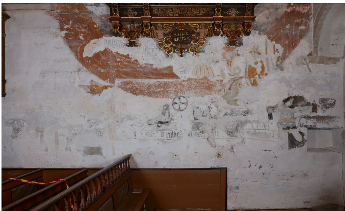
Figur 12: Kalkmaleriene på skipets nordvegg, østre del. Tilstand etter akuttsikting.