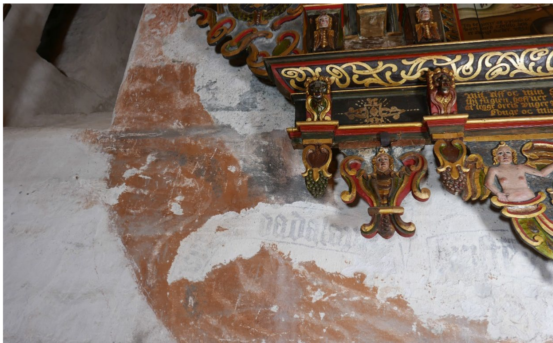
Figur 11: Flere lag veggdekor er avdekket ved siden av hverandre. Avdekningene er uryddige, og veggdekorene er vanskelig å lese. Derfor anbefaler NIKU også en estetisk behandling/ restaurering på sikt.

På lang sikt anbefaler NIKU en helhetlig konservering (bevarende behandling) og restaurering (estetisk behandling) av kalkmaleriene i Tingvoll kirke i sin helhet, det siste med målet å forbedre lesbarhet av de ulike veggdekorene.