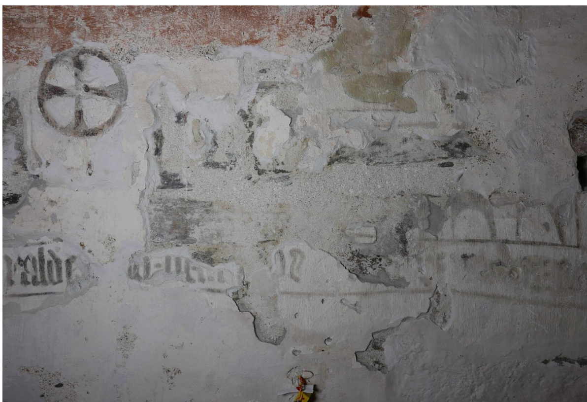
Figur 10: Det mest skadete området etter akuttsikting (se Figur 3 før behandling). Flere tynne flak, som bestod av gipsreparasjoner eller kalklag uten dekor måtte fjernes.