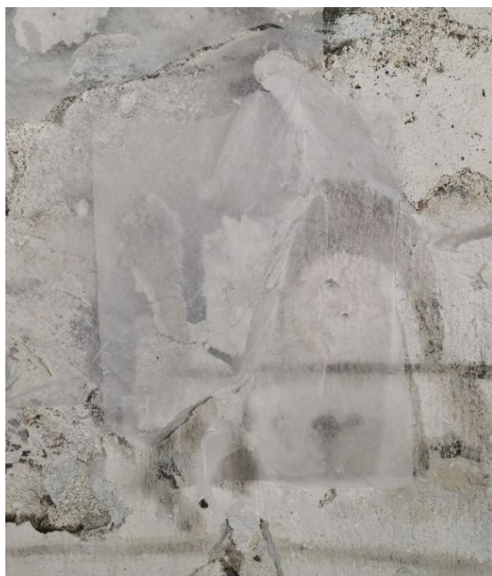
Figur 4: Detalj fra Figur 3. Store løse pussflak henger kun på plass gjennom forsidesikringen.