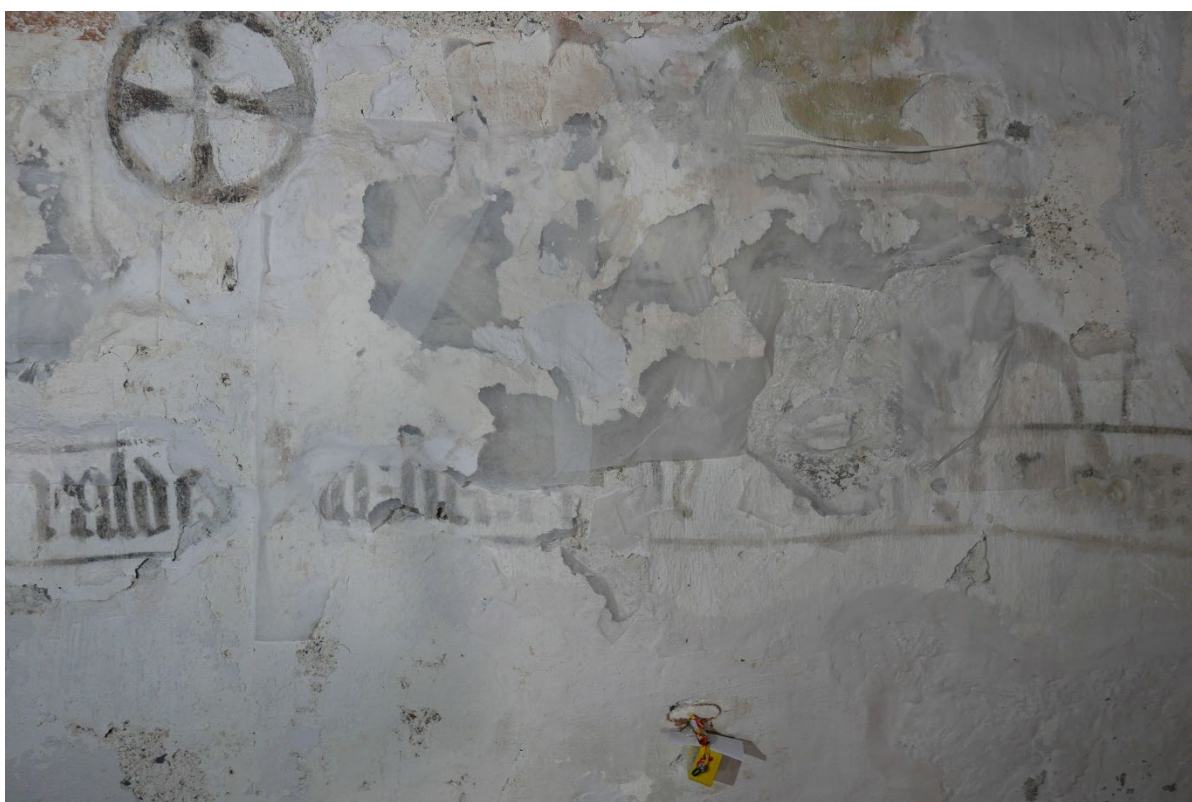
Figur 3: Det mest skadete området med store løse pussflak, som kun holdes på plass gjennom forsidesikringen.