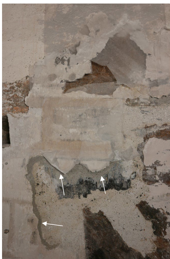
Figur 8: Løse pussflak ble sikret ved kantsikring (piler).