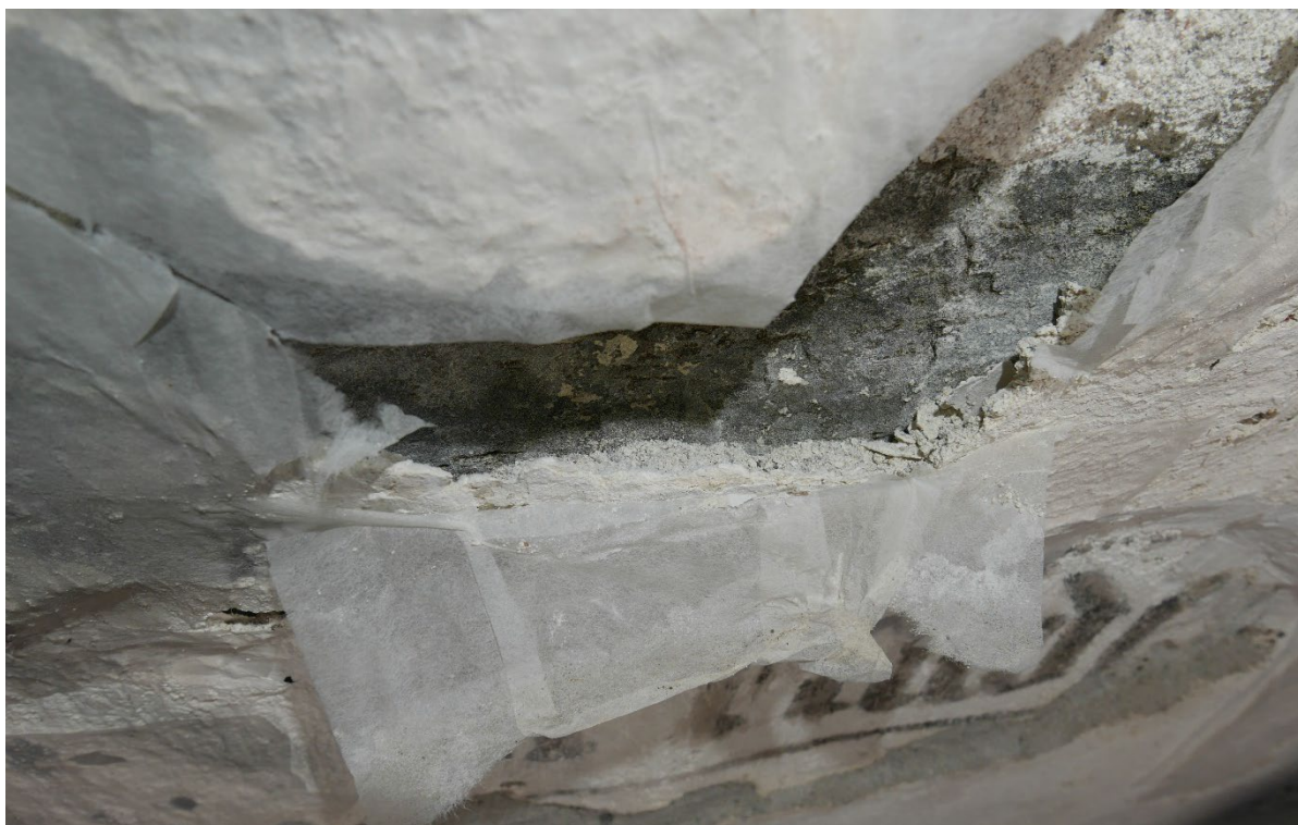
Figur 6: Det lå sand og små kalkflak bak løse pussflak.