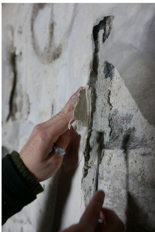
Figur 7: Løse pussflak ble sikret ved kantsikring.