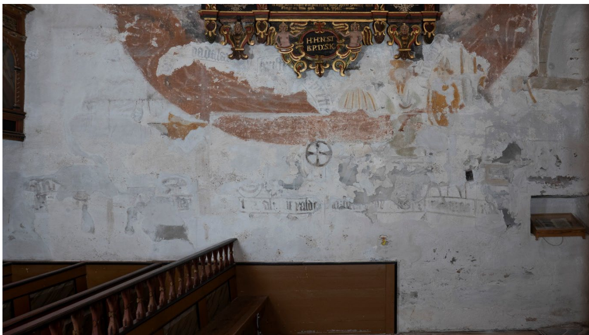
Figur 1: Kalkmalerier på skipets nordvegg, østre del. Skadet område. Tilstand før behandling.