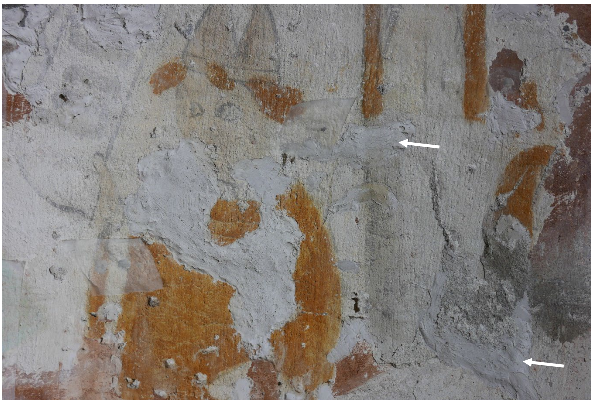
Figur 2: Utsnitt fra den middelalderiske dekoren nedenfor epitafiet. Piler viser gamle gipsreparasjoner, som både estetisk utilfredsstillende utført og teknisk uegnet.