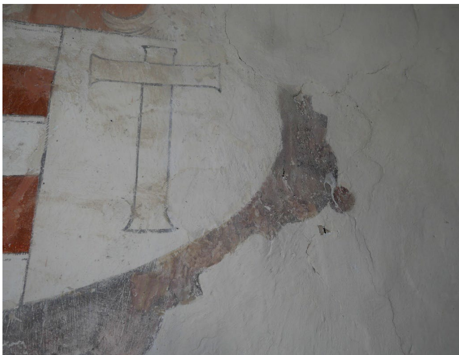
Figur 4: Tinglestad kirke. Detalj ved våpenskjold. Området med bom og sprekker.