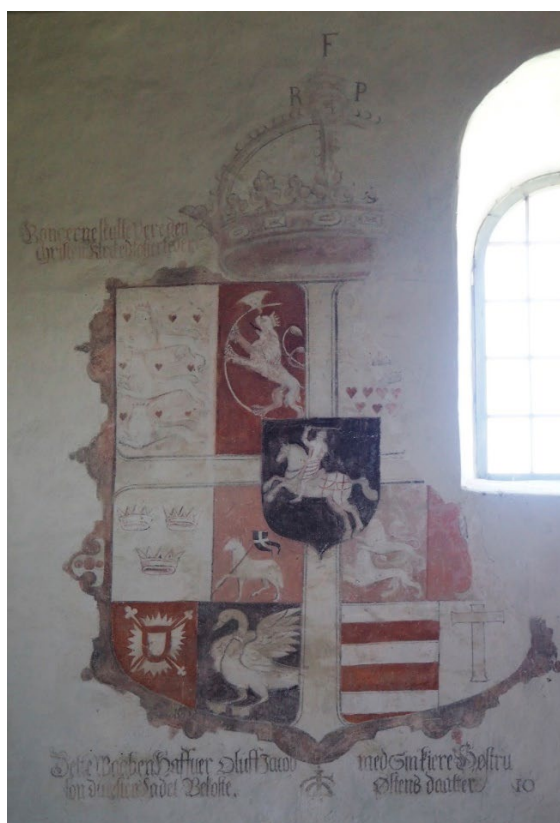
Figur 3: Tingelstad kirke. Muralmaleriet av våpenskjold.