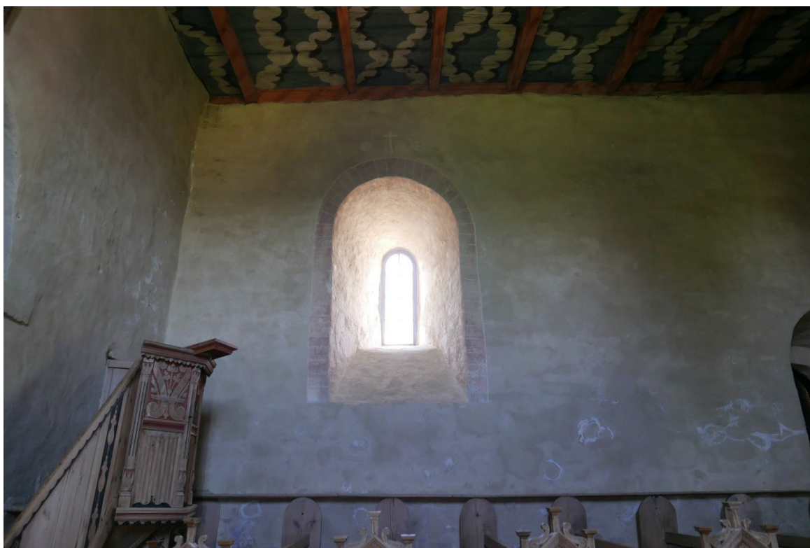
Figur 2: Tinglestad kirke. Sørvegg i skipet med kvadermaling rundt vindu.