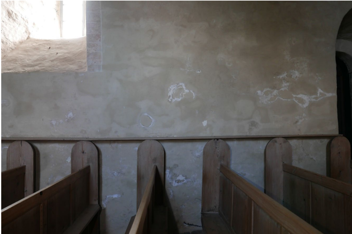
Figur 5: Tingelstad kirke. Sørveggen i skipet, nedre del med tydelige saltskader.

De innvendige veggoverflatene i kirkerommet er preget av nedbrytning, og er skitne. Noen saltutslag i nedre del i skip spesielt på sørsiden, noe utfall; i kor, renner etter vannskade, noen avskallinger og oppskallinger. Veggene er kalket med brunlig brekkfarge som oppleves som for mørk. Ved nykalking bør farge brytes lysere.