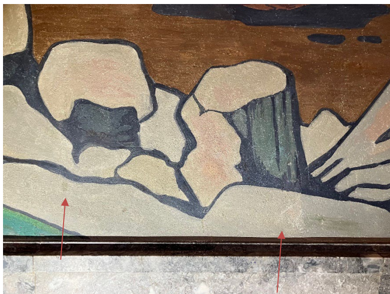
Figur 6 Detalj fra Revolds muralmaleri i Festgalleriet. Tilstand før behandling.

I det nedre veggpartiet fantes også noen eldre retusjer som var iøynefallende. Disse ble tonet inn med akvarellfarge. Reduserte malingslag, der den lyse pussene lyste igjennom, ble integrert med akvarellfarge.