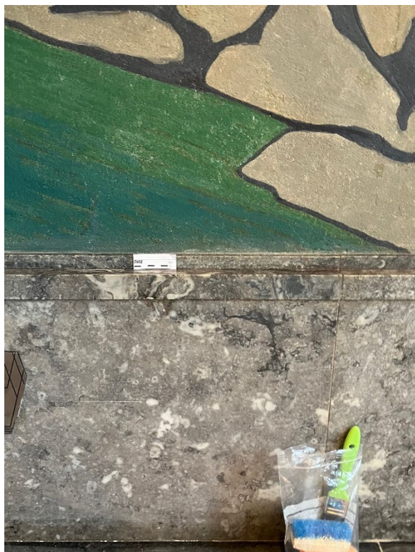
Figur 3 Samme skade som på figur 1. Tilstand etter rengjøring