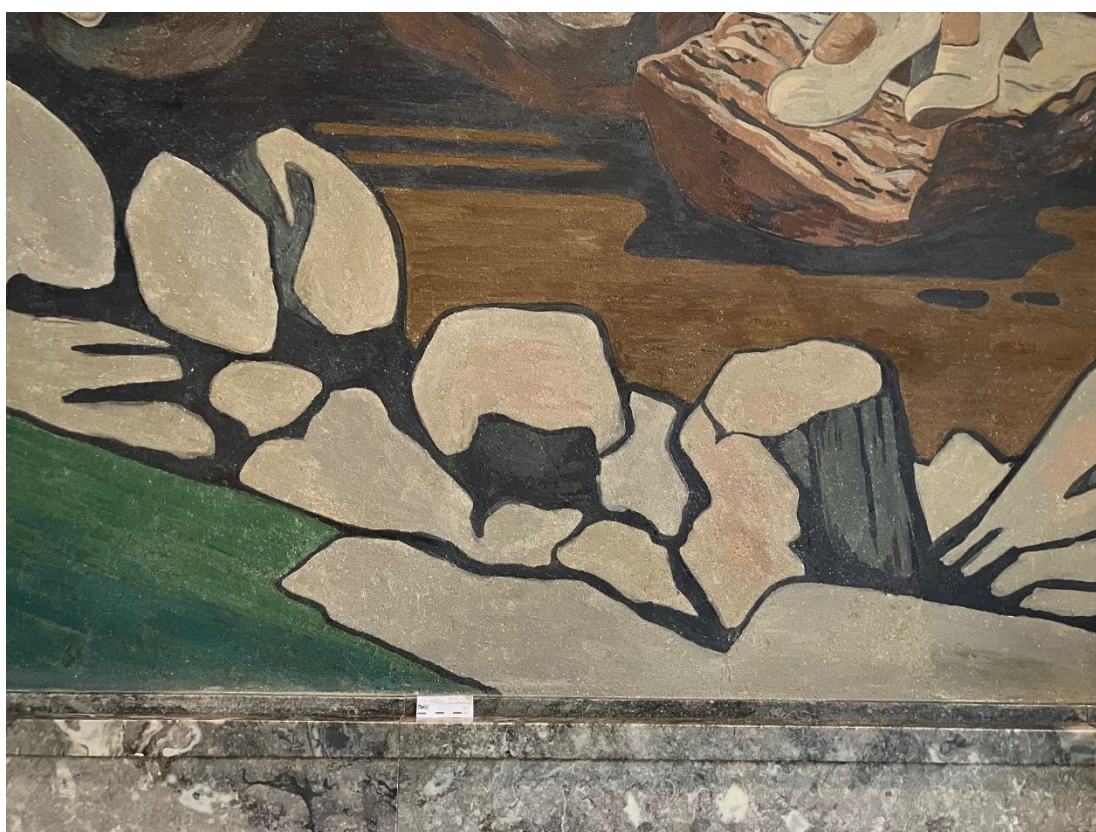
Figur 7 Tilstand etter behandling: Etter utført partiell rengjøring, kitting og retusjering