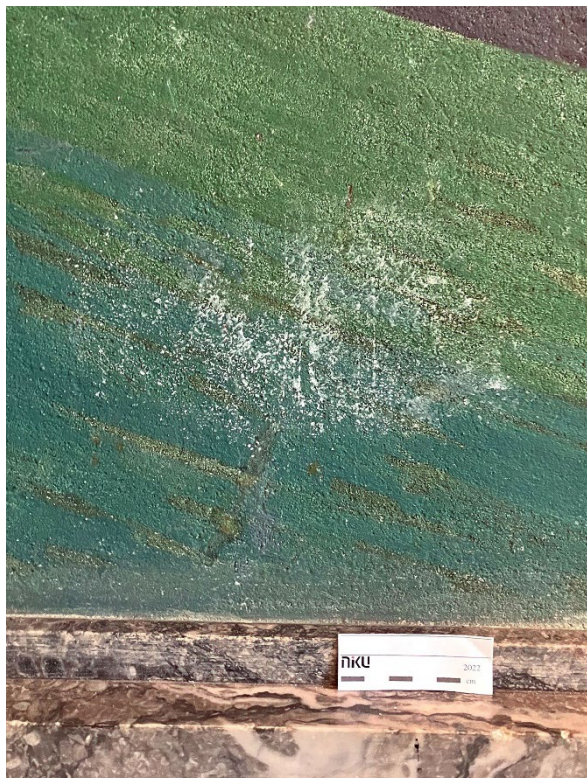
Figur 1 Detalj fra Revolds murmaleri i Festgaleriet. Tilstand innen behandling: eksternt material som er liggende på overflaten

Den venstre av 'skaden' (figur1) var kun rester av et fremmed materiale som ligger på overflaten. Ved første øyesyn kan det minne om en saltutfelling, men mest sannsynlig er det ikke det fordi skaden har de typiske skadebilder en saltutfelling gir. Pussen var ikke porøs og malingslaget er stabilt.