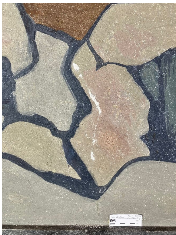
Figur 4 Samme detalj som figur 2. Under behandling: Ripen i pussen er kittet