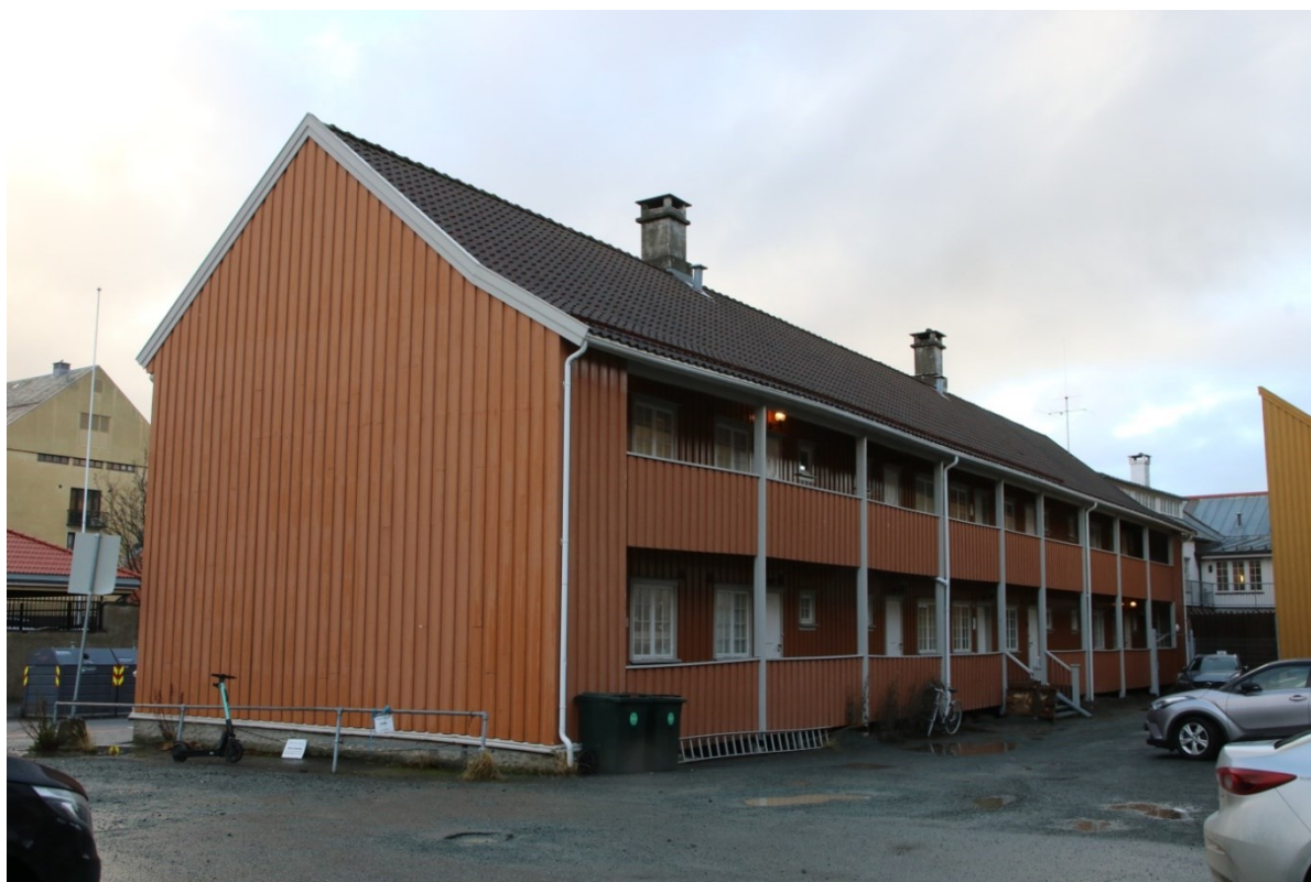
Figur 1. Bygningsfasade mot bakgård, Erling Skakkes gate 1. Da63306_010.

Våren 2019 utførte NIKU Distriktskontor i Trondheim en avklarende arkeologisk forundersøkelse i Erling Skakkes gate 1 (ref. NIKU oppdragsrapport 94/2020) i forbindelse med søknad om igangsettingstillatelse for etablering av lysgraver mot bakgården (se Fig. 1 og 2). Undersøkelsen i mai 2019 viste at tiltaket ikke direkte berørte automatisk fredete kulturlag. Riksantikvaren fattet vedtak 18.06.2019 at det burde gjennomføres en arkeologisk etterkontroll. For å dokumentere eventuelle kulturlagsprofiler i lysgravene ble etterkontrollen utført av NIKU ved arkeolog Synne Husby Rostad i uke 48, den 26.11.2020.