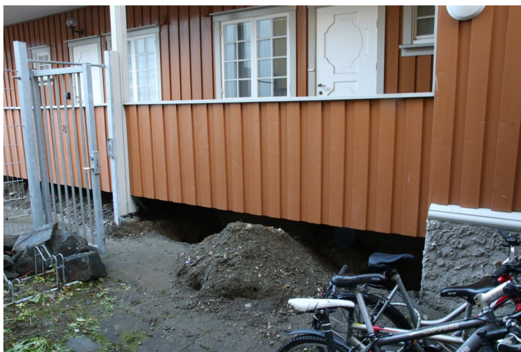
Figur 5. Plassering av lysgraver 3 og 4. Da63306_002.