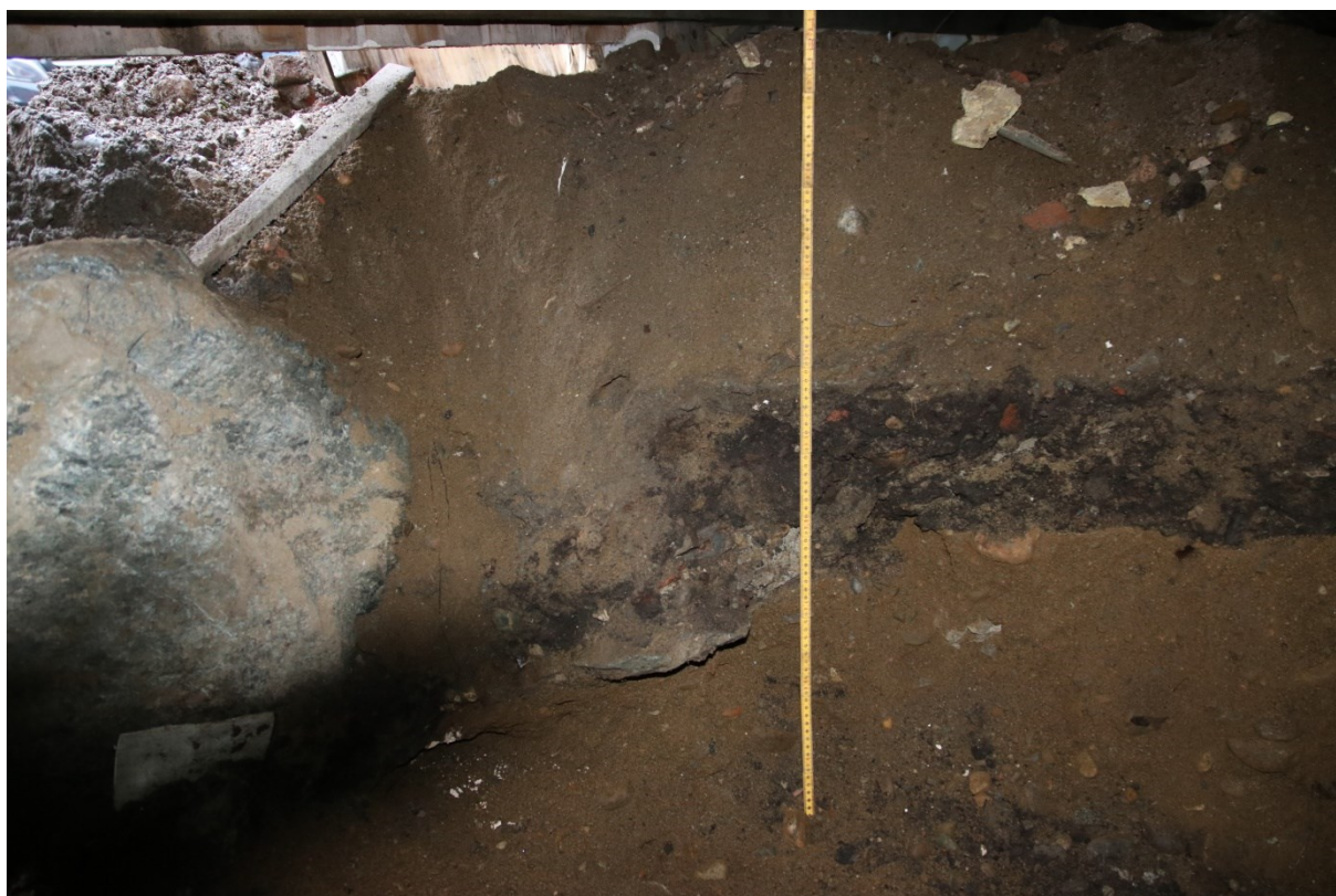
Figur 6. Profil i lysgrav 1 sett mot SV. Med 1 m målestokk. Da63306_006.

Lengde x bredde: 2,0 x 1,3 m. Hullet har blitt gravd i en dybde på ca. 1,2 m. Utgravd masse ca. 3,1 m 3 .