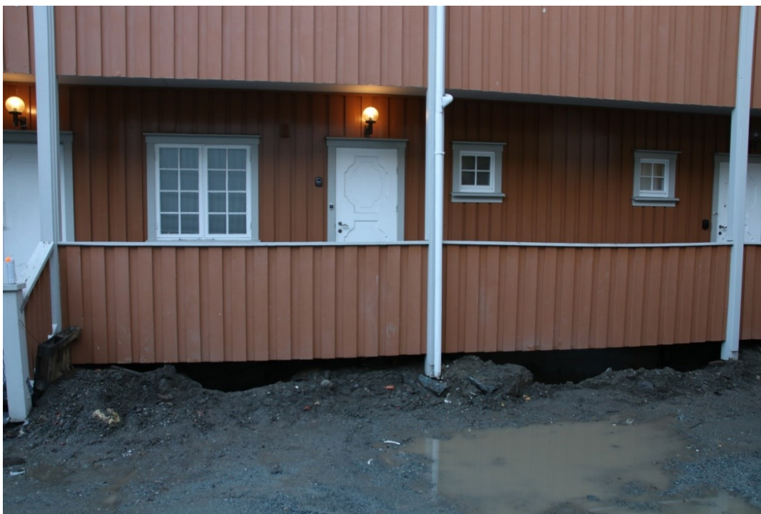
Figur 4. Plassering av lysgraver 1 og 2. Da63306_001.