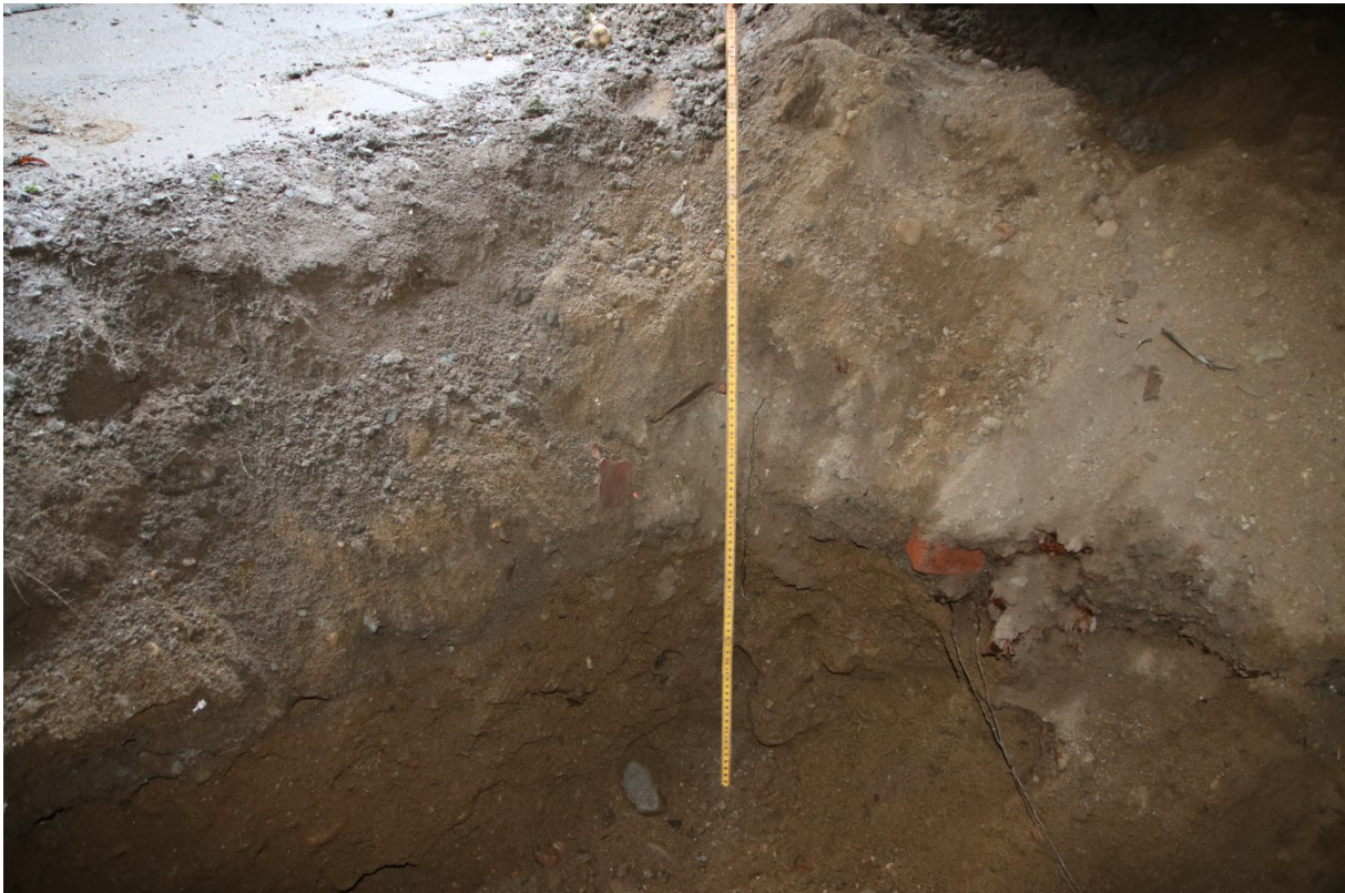
Figur 7. Profil i lysgrav 3 sett mot SV. Med 1 m målestokk. Da63306_004.

Lengde x bredde: 1,6 x 1,5 m. Hullet har blitt gravd i en dybde på ca. 1,2 m. Utgravd masse ca. 2,9 m 3 .