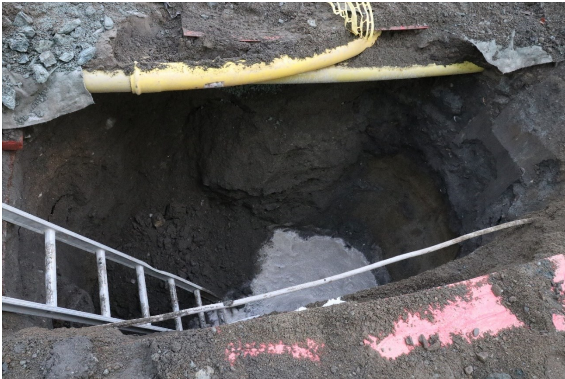
Figur 3. Grøft i Dronningens gate 24. Sett mot sør. Da63995_001.