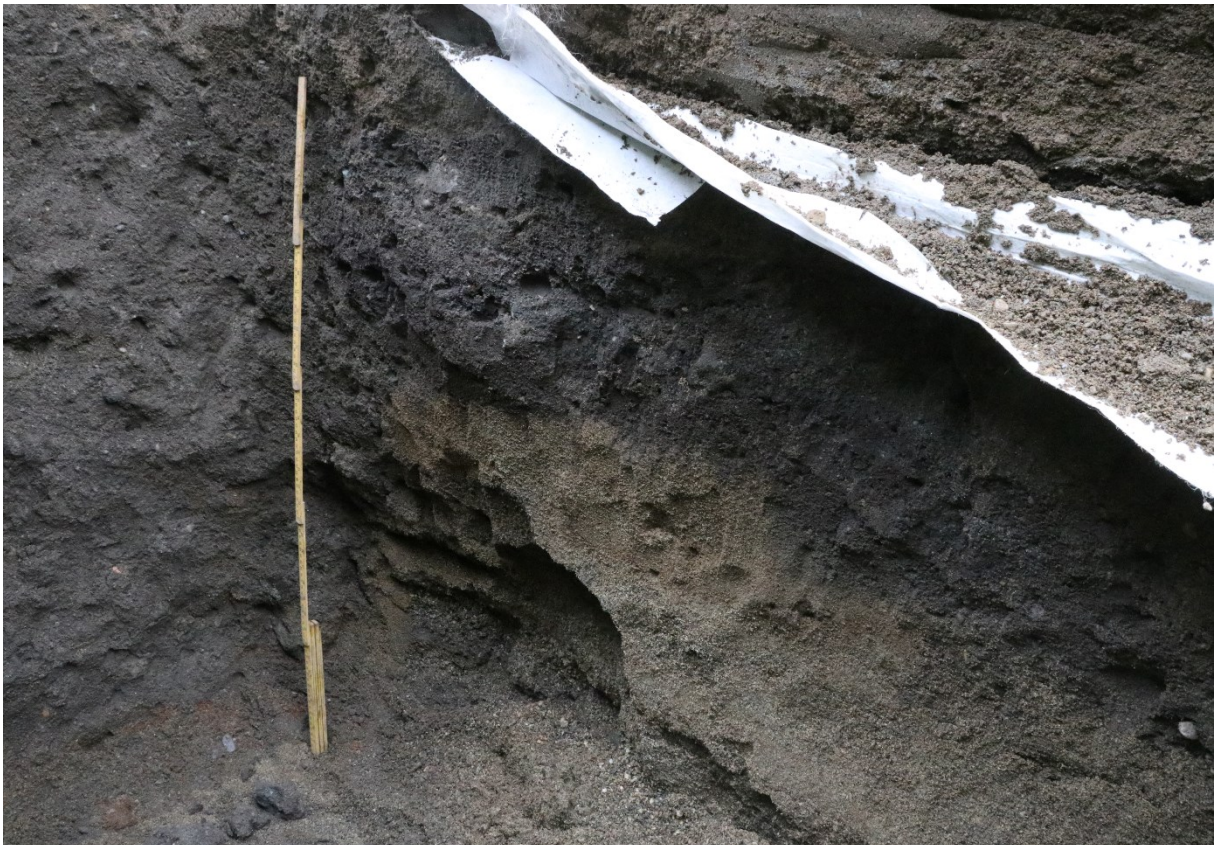
Figur 4. Kulturlagsprofil mot søraust. Naturleg undergrunn under. Profilen mot aust (venstre for målestokk) har nedsunke kulturlag. Da63995_003.

Dei etterreformatoriske kulturlaga i toppen av grøfta inneheldt gråbrun sand med dyrebein, raud og gul tegl, krittpepfragment og keramikk. Det var kablar og forstyrrelser i søraust. Den austlege og søraustlige delen av profilen var mest uforstyrra. Kulturlagene i aust låg ca. 1,5 m under overflata og inneheldt gråbrun og humushaldig sand. I søraust var toppen av kulturlaget ca. 1,2-1,3 m under overflata, og var ca. 0,15-0,2 m tjukt. Ein kolprøve vart tatt frå kulturlaget rett over den naturlege undergrunnen i aust. Laget vart datert til yngre steinalder, BC 2448-2150 (UBA-44176). Ein annan kolprøve vart tatt frå den nordaustlige profilen. Laget her vart datert til sein mellomalder, AD 1283-1391 (UBA-44177). Naturleg undergrunn låg ca. 1,8 -2 m under overflata og inneheldt gulbeige sand.