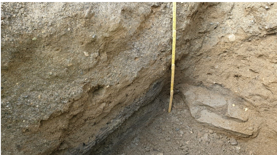
Figur 9. Gravehol 14. Med 1 m målestokk. Da63997_004.

Hol 14 var 1,35 x 0,74 m stort og gravd i 0,9 m djupne. Eit 0,11 m høgt og 0,4 m breitt fundament samansett av tre flate steinheller låg på ca. 0,8 m djupne i profilen mot nord (figur 9). Alt av lag over konstruksjonen var moderne, omrota brun sand. Ei tynn stripe av grå siltsand låg delvis over hellene i nordvest. I vestprofilen låg det eit 0,4 m tjukt kulturlag (etterreformatorisk) samansett av eit gråbrunt, grusblanda silt-sandlag med kalkmørtel og teglfragment, over grå sand og sandblanda leire som inneheldt fragment av tegl. Toppen av kulturlaget låg på ca. 0,55 m djupne.