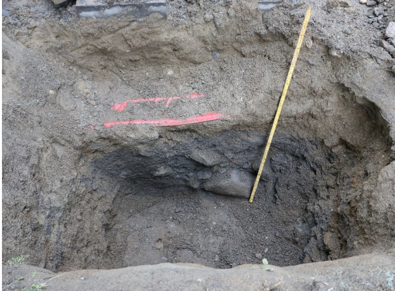
Figur 6. Gravehol 6. Med 1 m målestokk. Da63997_025.

Hol 6 var 1,4 m x 0,9 m stort og gravd i 0,9 m djupne. Kulturlag låg på 0,43 m djupne i vestprofilen (figur 6). Laget er truleg etterreformatorisk basert på funn som raudtegl, dyrebein, skjell og golvheller. Eit eldre nivå av kulturlaget fortset ned i grunnen.