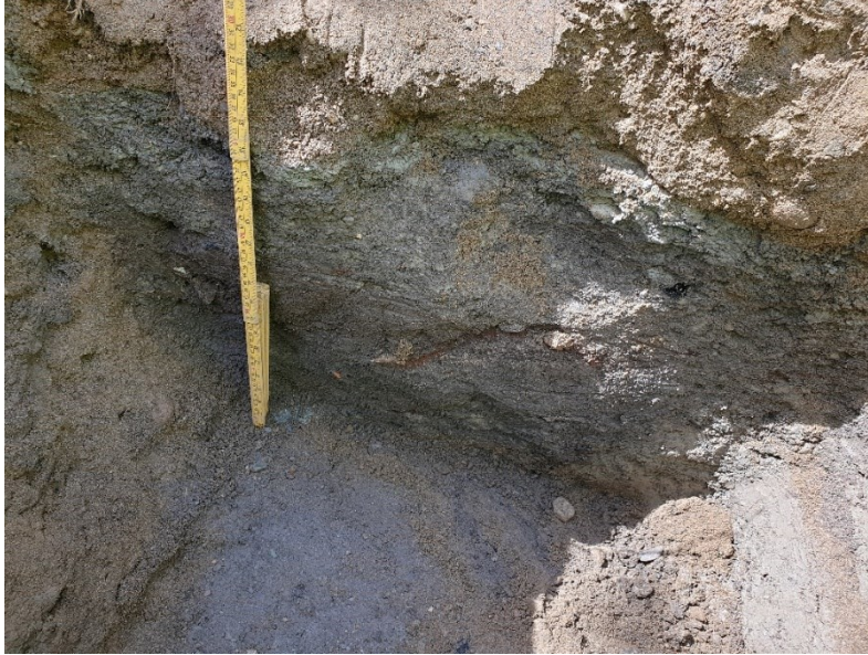
Figur 8. Gravehol 13. Med ca. 0,5 m målestokk. Da63997_001.