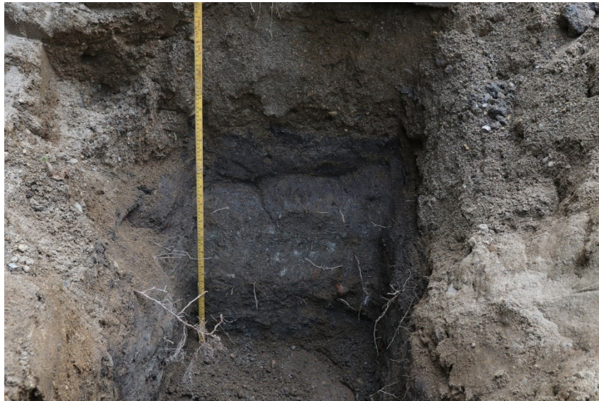
Figur 4. Gravehol 2. Med 1 m målestokk. Da63997_009.

Hol 2 var 1,35 x 1,35 m stort og gravd i 0,9-1 m djupne. Dei øvre 0,4 m inneheldt gråbrun sand (berelag). Det var kulturlag mot aust, i den austre delen av nord- og sørprofilen (figur 4). Toppen av kulturlaget låg på ca. 0,45 m djupne. Kulturlaget var samansett av fire nivå/sjikt som frå topp til botn var: 1) Mørk gråbrun silt med kolspettar i 0,15-0,2 m tjukkeleik. 2) Eit homogent, gråbrunt, sandblanda leirelag i 0,19 m tjukkeleik. 3) Mørk, gråbrun leire med kolspettar og raudtegl i 0,1 m tjukkeleik. 4) Eit gråbrunt leirelag med kolspettar i 0,13 m tjukkeleik. Det vart tatt to prøver frå sjikt 3 og 4 som ikkje vart analysert*.