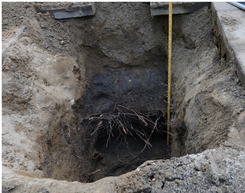
Figur 3. Gravehol 1. Med 1 m målestokk. Da63997_008.

Hol 1 var 1,35 x 1,05 m stort og gravd i 0,9 m djupne (figur 3). I profilen mot sør, nord og vest var det stort sett gråbrun sand (berelag). Det var små lommer av kulturlag mot aust, på ca. 0,4-0,5 m djupne. Desse lommene inneheldt gråbrun sand med leirekonsistens, kolspettar, og små fragment av raud tegl.