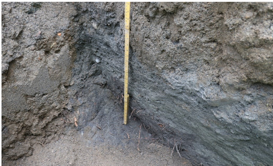
Figur 10. Gravehol 17. Med ca. 0,5 m målestokk. Da63997_018.

Hol 17 var 1,4 x 0,66 m stort og gravd i 0,9 m djupne. Fyllet inneheldt stort sett moderne massar som sand og grus i aust. I den vestlege profilen var det påvising av eit opptil 0,6 m tjukt kulturlag (etterreformatorisk) som inneheldt kompakt, leireblanda grå til ljøsgrå sand og leire, med raud tegl og krittpepfragment (figur 10). Kulturlaget kunne delvis sjåast i ca. 0,2 m breidde i den nordlege og sørlege profilen. Toppen av kulturlaget låg på ca. 0,50 m djupne.