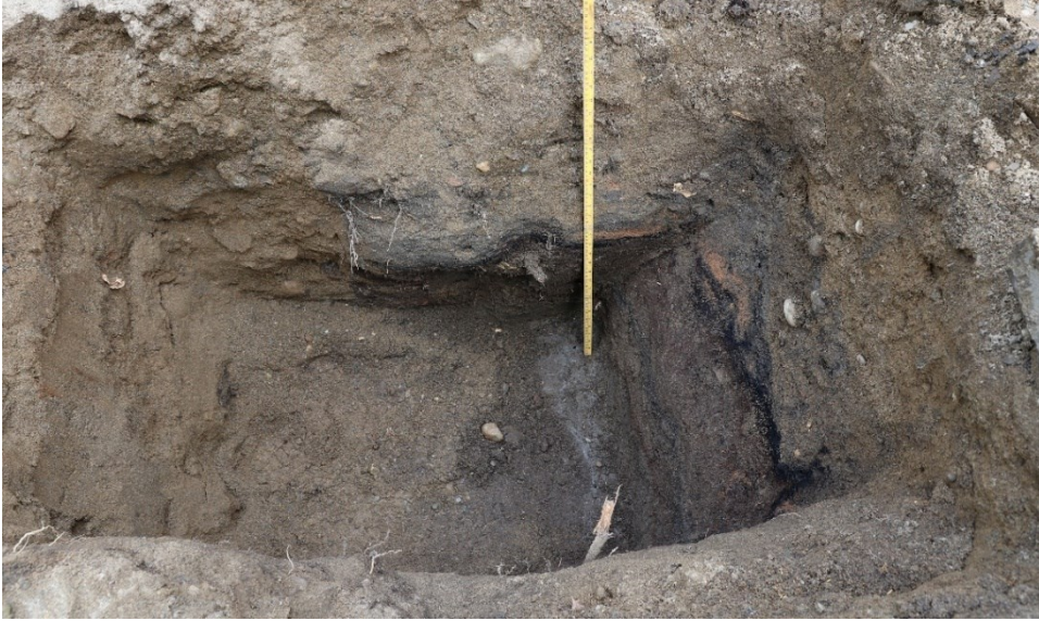
Figur 5. Gravehol 3. Med 1 m målestokk. Da63997_013.