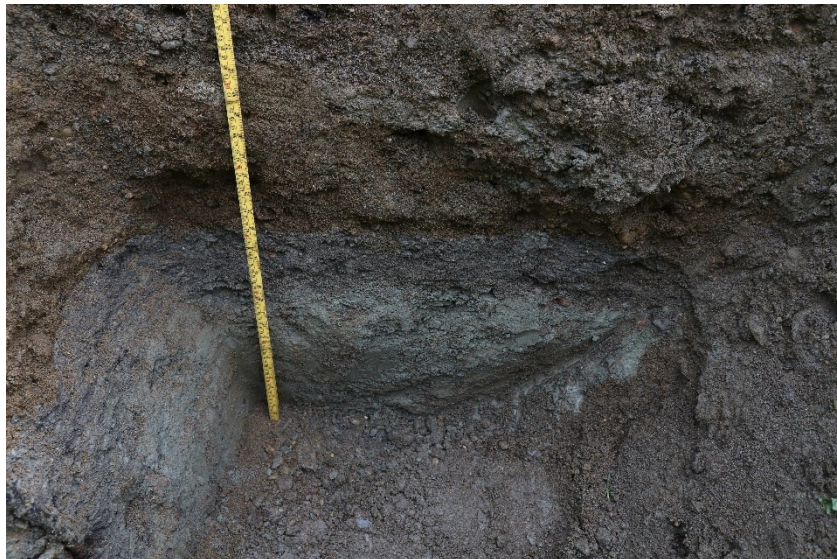
Figur 7. Gravehol 12. Med ca. 0,7 m målestokk. Da63997_036.

Hol 12 var ca. 1 x 1 meter stort og gravd i 0,7-0,9 m djupne. Det var registrert restar av kulturlag (figur 7) i den austre profilen, ca. 0,4 m under toppen av berelaget. Under kulturlaget låg det grå, kompakt leire som fortset ned i grunnen. Det var omrota massar (grus, leire og flekker av kulturlag) i dei andre profilane.