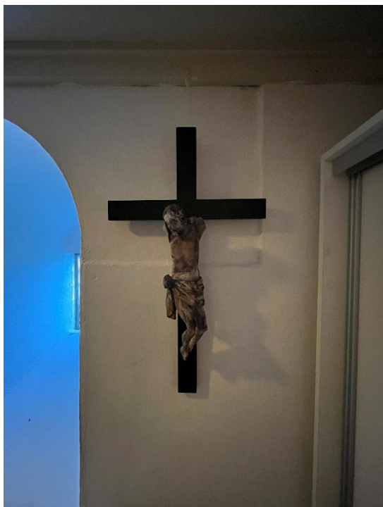
Foto 15: Lite middelalderkrusifiks i sakristiet. Foto: Henrik Smith, Riksantikvaren.