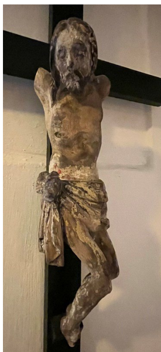
Foto 16: Detalj av middelalderkrusifikset i sakristiet.