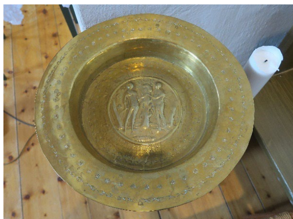
Foto 18: Dåpsfat i messing, trolig fra middelalderen.