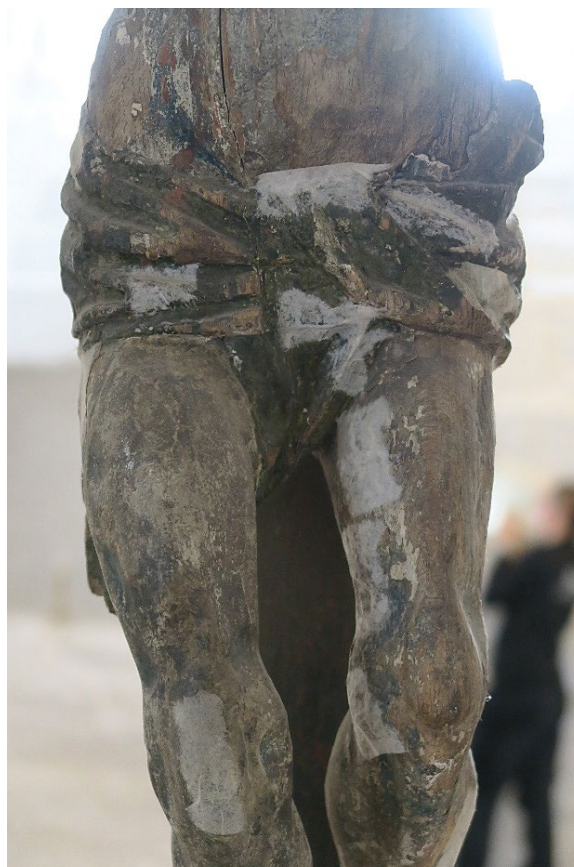
Foto 2: Detalj av krusifiks med tidligere forsidesikring for å hindre at løs maling faller av.