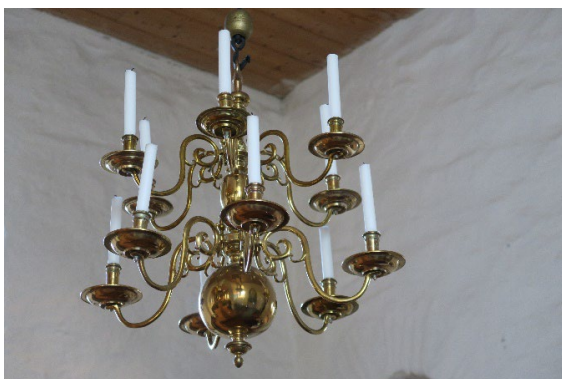
Foto 19: Lysekrone i messing, to nivåer.