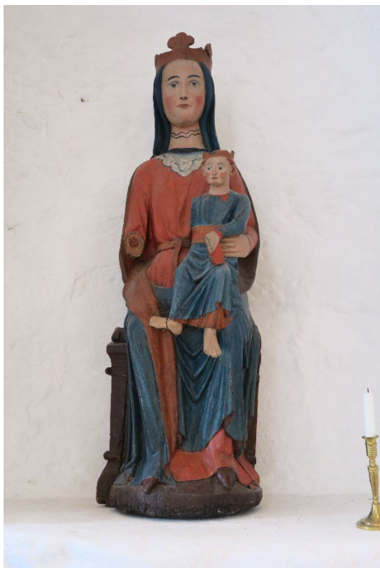
Foto 13: Maria med Jesusbarnet fra siste del av 1200-tallet.