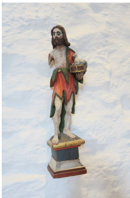
Foto 4: Helopptak av Johannes.