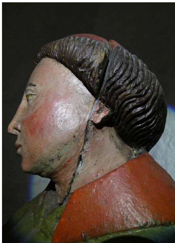
Foto 8: Skulpturen sett fra siden, tidligere skade som er sammenlimt.