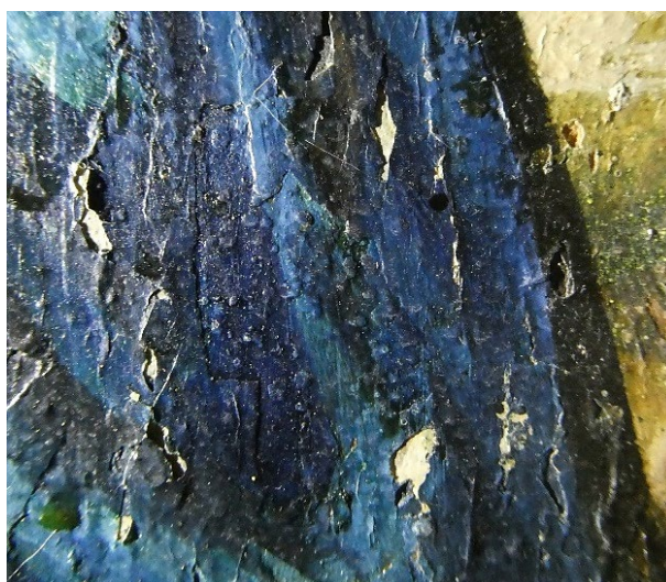
Foto 6: Detalj fra «Prudentia» som viser løs maling.