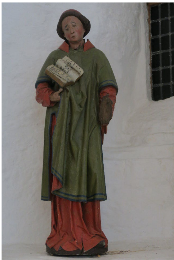
Foto 7: Laurentius skulptur fra ca. 1400-tallet.