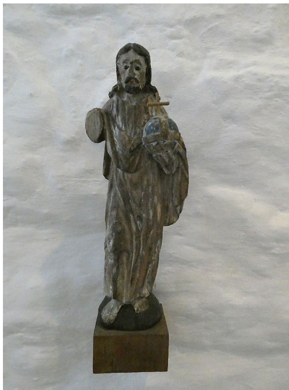
Foto 14: Liten skulptur i koret; Jesus med jordeplet.