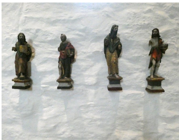
Foto 3: Fire skulpturer fra 1600-tallet er montert på nordvegg ved alteret.