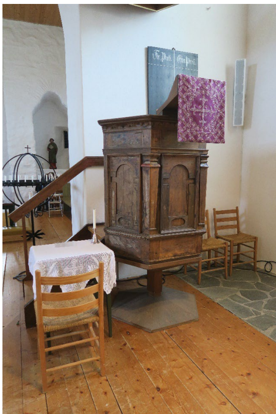
Foto 11: Prekestolen fra 1675.