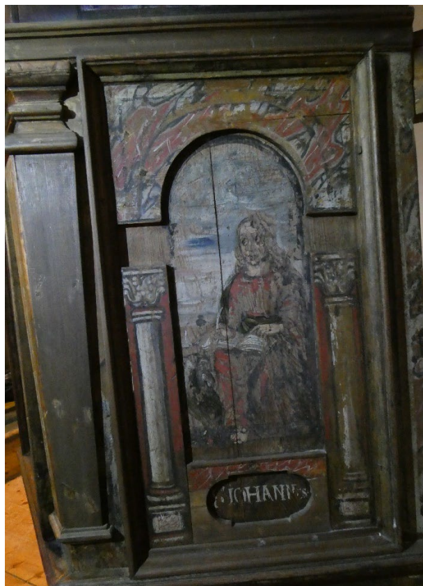
Foto 12: Prekestolens felt mot syd hvor det er mest maling bevart.