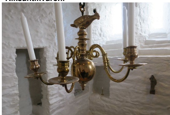
Foto 20: Lysekrone i messing, ett nivå.