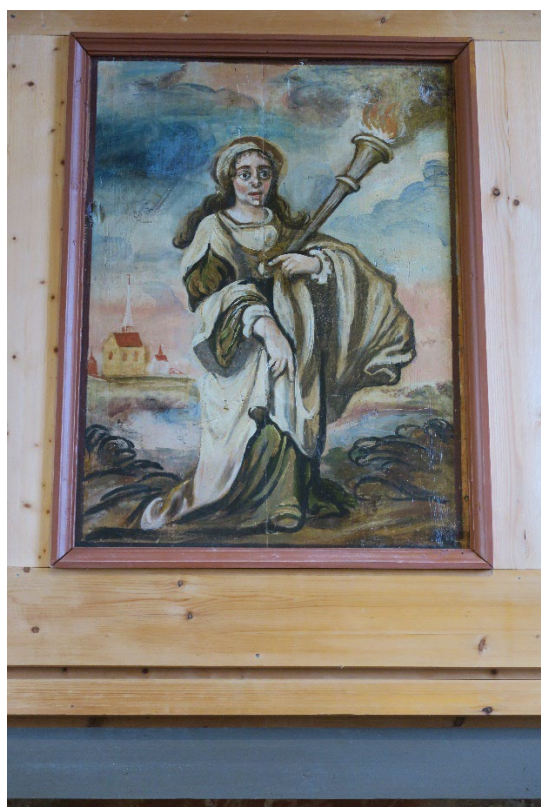
Foto 5: Ett av tilsammen 9 scener på galleribrystningen.