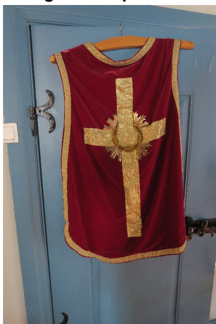
Foto 1: Messehakel muligens fra 1700-tallet med tilstandsgrad 3. Forside.