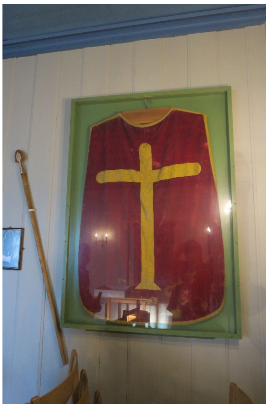
Foto 6: Hessehaket i monter datert 1763.