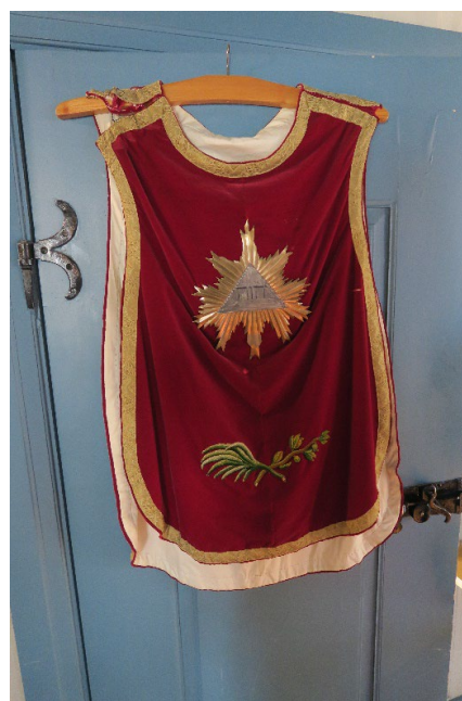
Foto 2: Messehakel muligens fra 1700-tallet med tilstandsgrad 3. Bakside.