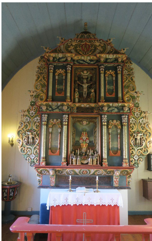
Foto 5: Altertavlen i sakristiet fra 1766/68.