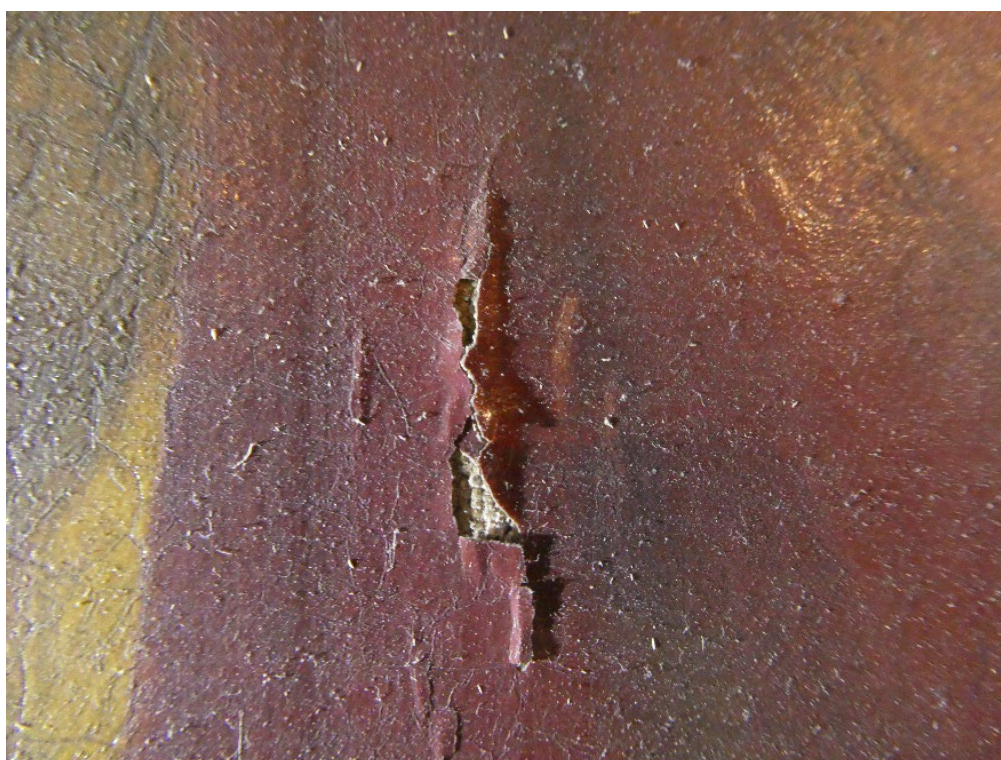
Foto 4: Detalj, eksempel på løs maling på lerretmaleriene.