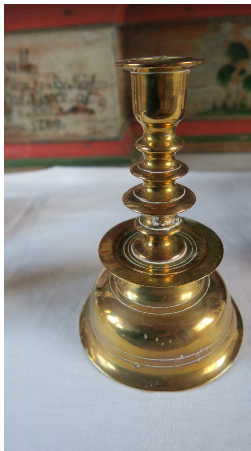
Foto 4: To lysestaker i messing.