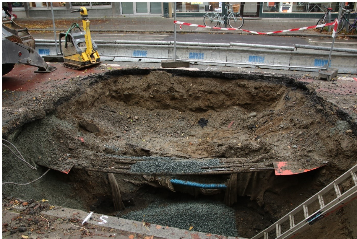
Figur 1. Område med vannlekkasje i Søndre gate 17. Bildet er tatt mot vest. Da63988_006.

Dovre entreprenør på vegne av Trondheim kommune bydrift, søkte Riksantikvaren om tillatelse til inngrep i automatisk fredet kulturminne i forbindelse med akutt vannlekkasje i Søndre gate 17 (fig.1). NIKU mottok anmodning om tilrådning fra Riksantikvaren 06.10.2021 og ga sin tilrådning i brev av 08.10.2021 (ref. 309/21/554.31/ABS). Riksantikvaren fattet følgende vedtak, med hjemmel i lov av 1978 nr. 50 om kulturminner (kulturminneloven) § 8 første ledd der Trondheim kommune ble gitt tillatelse i ettertid med vilkår om arkeologisk etterkontroll (RA-ref. 21/05662-8).