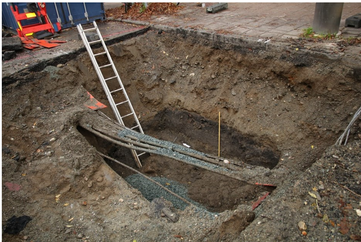
Figur 2. Utstrekningen av det gravde hullet. Med 1 m målestokk. Da63988_003.

Gravingen ble gjort i gateløpet, inntil østre fortau i Søndre gate 17 (fig. 2). Arkeolog fra NIKU gjennomførte etterkontrollen den 13.10.2021. Utstrekningen av hullet var ca. 4 x 3 meter, der lekkasjen befant seg på ca. 2,5 m dybde under gateplan.