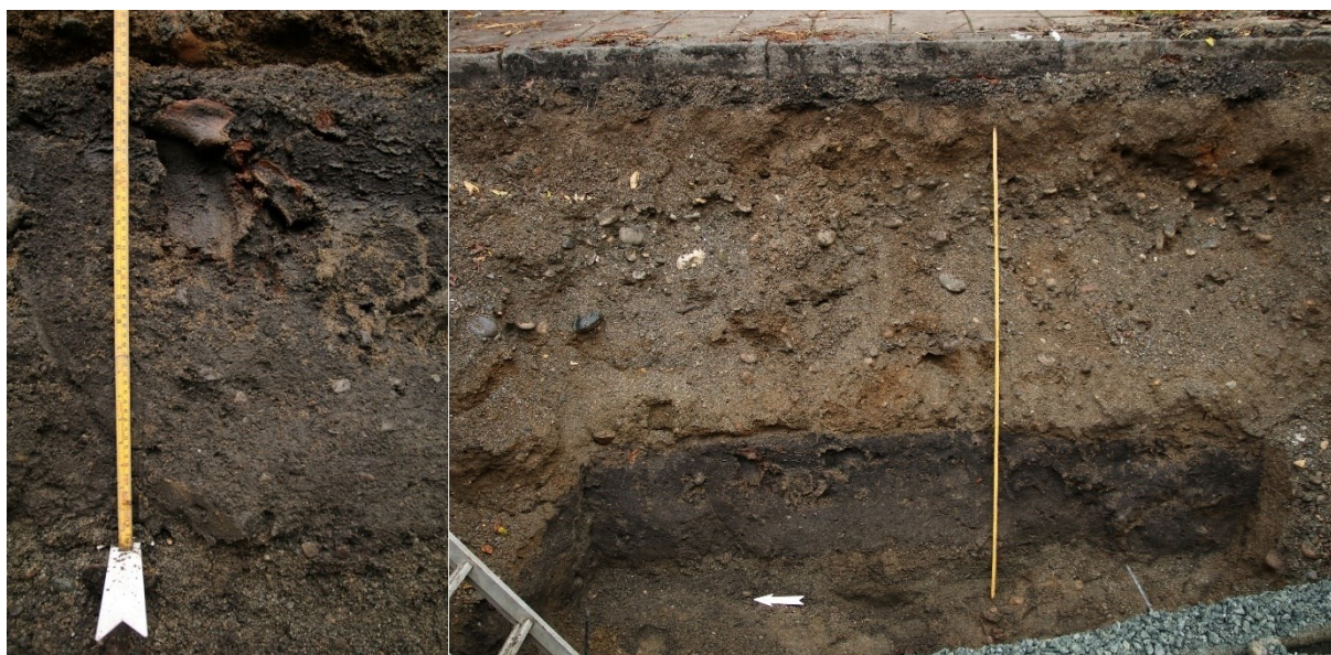
Figur 4. Nærbilde av dyrebein in situ i kulturlaget. Med ca. 0,55 m målestokk. Da63988_007 (venstre). Oversiktsbilde av den østlige profilen. Med 2 m målestokk. Da63988_001 (høyre).

Kulturlagsprofilen ble dekket til med fiberduk før gjenfyllingen.