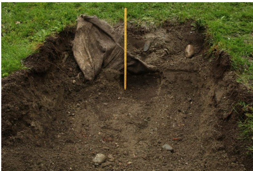
Figur 4. Plantehullet sett mot Ø. Antydninger til mørkere kulturlag i profilkanten som var tildekket av fiberduk fra tidligere. Med 0,6 m målestokk.