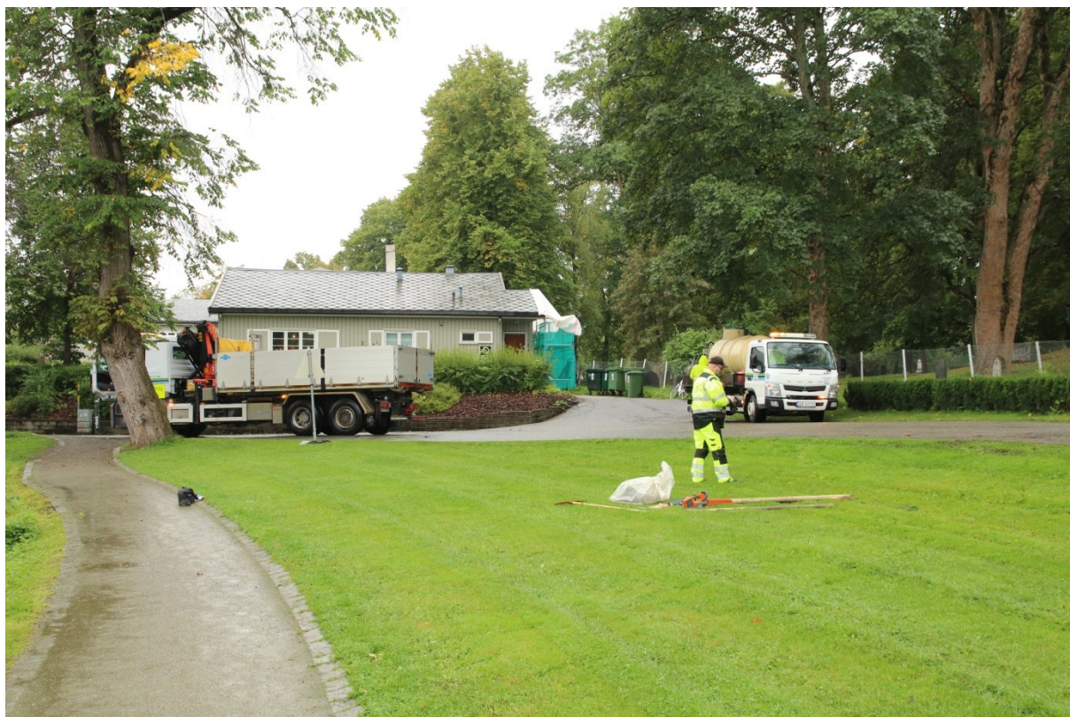
Figur 2. Tiltaksområdet - Kjøpmannsgata 1, før graving. Sett mot SV.

Riksantikvarens dispensasjon gjaldt følgende arbeid: Trondheim kommune ble gitt tillatelse til å plante nye trær som erstatning for trær som var fjernet på åttesteder innenfor middelalderbyen Trondheim (kulturminne-ID: 90288). Graving av plantehull ved Kjøpmannsgata 1 ble overvåket av arkeolog fra NIKU (fig. 2). I utgangspunktet skulle plantehullene være inntil 1,0 x 1,0 m og 0,7 m dype.