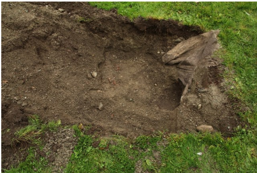
Figur 3. Plantehullet sett mot N. Fiberduk til høyre.

Det ble benyttet en gravemaskin med smal skuffe. Hullet som ble gravd var 1,2 x 1,2 m i størrelse, mens dybden var 0,4 m. Profilen bestod av 0,2 m torv/gress i toppen, som lå over 0,2 m løs, grå sandgrus (moderne fyllmasse). I hullets østende lå det en synlig fiberduk, antakelig lagt over kulturlag da området ble gravd/arkeologisk undersøkt tidligere. Kulturlaget som var synlig i kanten av hullet, befant seg 0,35 -0,4 m under overflaten og fortsatte i østlig retning (fig. 3-4). Laget er antakelig fjernet/gravd gjennom i vestlig retning mot veien. Bunnen av hullet bestod av løs sandgrus, og en moderne råttne staur/gjerdestolpe som var lagt N-S. Kulturlaget var mørkebrunt og kompakt, det ble ellers ikke gjort noen funn i laget. Laget så relativt uforstyrret ut, men nivået antyder etterreformatoriske lag og utfyllinger mot elven.