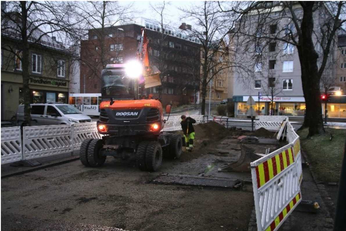
Figur 2. Graving av grøft, øst for Hospitalskirken. Bildet er tatt mot sør.

Tiltaket omfatter inngrep i et automatisk fredet kulturminne i form av graving i kirkegårdsgrunn, øst for det middelalderske kirkestedet Hospitalskirken. En grøft skulle graves mellom nettstasjon - trafo til kant av fortau, lengst sør i Hospitalsgata. Arbeidet gjaldt oppsett av et nytt tennskap, med målene: høyde 1,6 m, bredde 0,46 m og dybde 0,22 m. Tidligere undersøkelser har påvist at kulturlagene er svært tynne og at naturlig undergrunn ligger høyt opp mot dagens overflate. I forbindelse med grøftegraving i 1941 på fortauet utenfor Hospitalsgata 1, ble det funnet flere menneskebein. Funnene tyder på at Hospitalskirkens kirkegård strakte seg så langt østover.