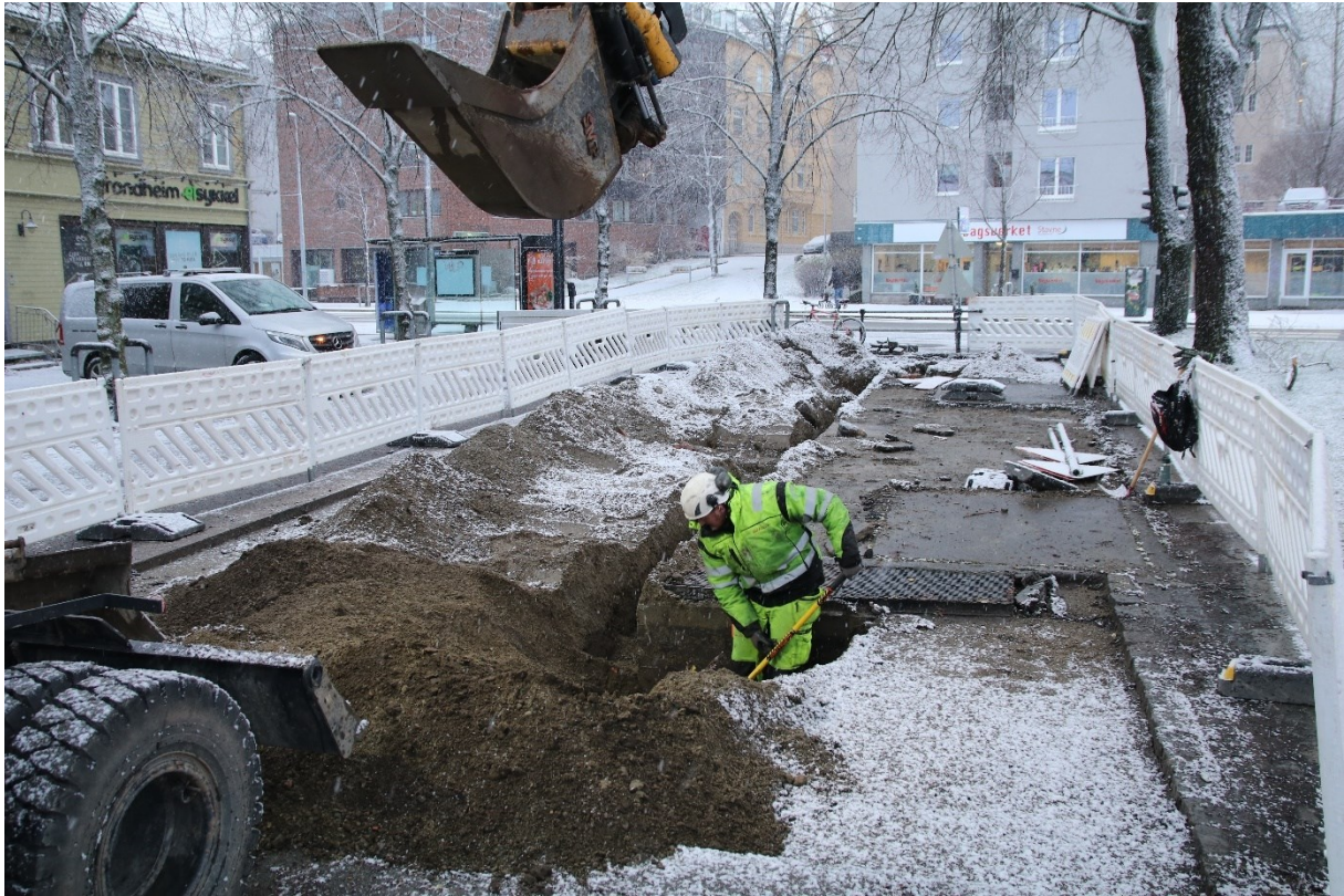
Figur 4. Graving av grøft, øst for Hospitalskirken. Bildet er tatt mot sør.