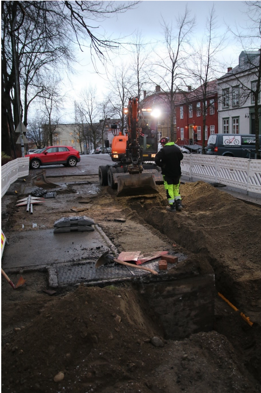
Figur 3. Graving av grøft, øst for Hospitalskirken. Bildet er tatt mot nord.

Grøften ble gravd med en 5,8 tonn gravemaskin i løpet av én dag, den 25.11.2021. Arkeolog fra NIKU overvåket arbeidet. Grøften ble ca. 15 m lang, 0,4 m bred og 0,6-0,7 m dyp. Det ble gravd i et område med utelukkende moderne forstyrrelser, da det ble gravd på nordsiden, østsiden og sørsiden av en nettstasjon – trafo som ligger under bakkeplan (fig. 2-4). I grøftetraseen var det ingen påvisning av automatiske fredete kulturlag eller naturlig undergrunn. Alt av fyllmasse i grøften bestod av løs, homogen beige-grå sandgrus med noe stein.