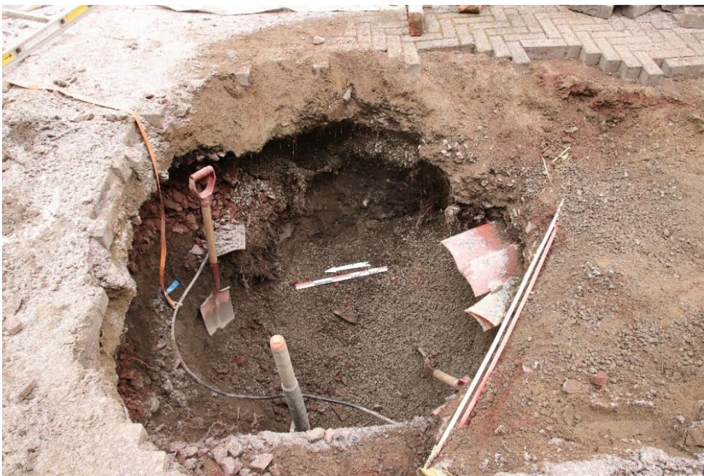
Figur 4 Oversikt grøft. Redepoert kulturlag i profil, mot øst. Cf53899_NIKU_0001.JPG