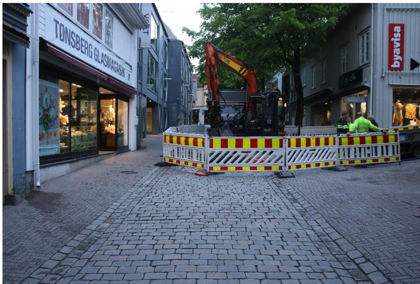
Figur 5 Torvgaten, graving 25. mai. Cf53899_NIKU_0007.JPG

25. mai ble det gjennomført kveldsgraving i Torvgaten, for å finne og reparere vannlekkasjen. Det ble da hovedsakelig gravd i offentlig vannledning, og NIKU utførte en forenklet etterkontroll hvor grøften ble målt inn manuelt. Det ble bare observert grus i profilene, samt noe omrotede moderne masser mot NV. Topp rør lå ca. 1,9 m under topp asfalt. De gravde bare i opprinnelig vannledningsgrøft. Dette ble dokumentert med foto og målt inn for hånd, og deretter lagt inn i Intrasys. Det ble ikke påtruffet automatisk fredede kulturlag under denne gravingen.