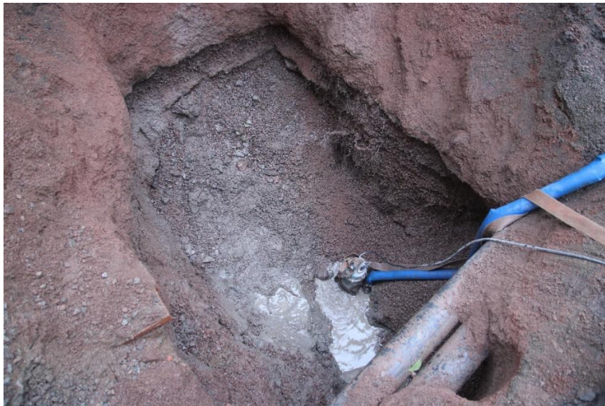
Figur 6 Grøft gravd i Torvgaten 25. mai. Cf53899_NIKU_0008.JPG

Det ble ikke påtruffet automatisk fredede kulturlag i de arkeologiske etterkontrollene. Det ble derimot påtruffet redeponerte kulturlag. Dette gir oss utvidet kunnskap om kulturlagenes utbredelse innenfor middelalderbyen. Det sannsynliggjør at det kan påtreffes uforstyrrede kulturlag i umiddelbar nærhet av tiltaksområdet. Dette er viktig informasjon med tanke på videre forvaltning av Middelalderbyen Tønsberg.