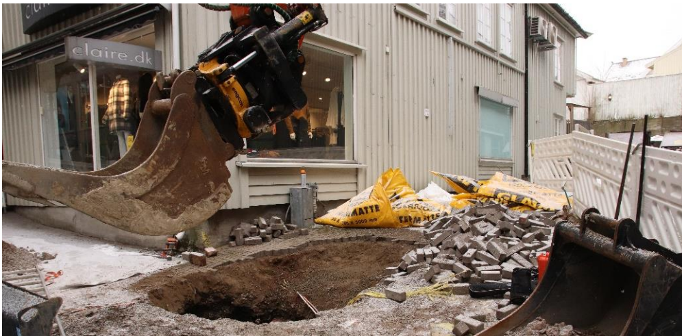
Figur 1 Oversiktsbilde, mot sørøst. Cf53899_NIKU_0004.JPG

NIKU Tønsberg ble 7.1.21 anmodet av Riksantikvaren om faglig tilråding i saken. Tilråding ble oversendt Riksantikvaren 12.1.21. NIKU oversendte på anmodning fra Riksantikvaren budsjett på etterkontroll 18.1.2021. Riksantikvaren fattet dispensasjonsvedtak med delvis kostnadsdekning 22.1.2021 (RA-ref.: 21/00143-5).