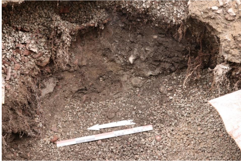
Figur 5 Redeponert kulturlag i profil, mot øst, grøft gravd 15. februar. Cf53899_NIKU_0002.JPG