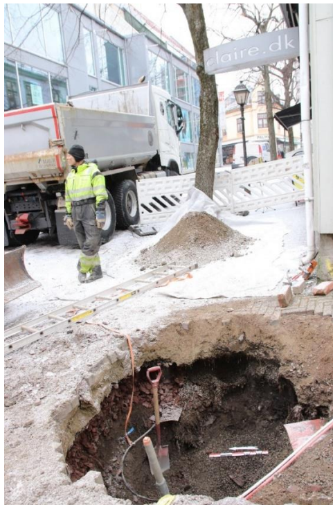
Figur 2 Oversiktsbilde, mot øst. Cf53899_NIKU_0003.JPG