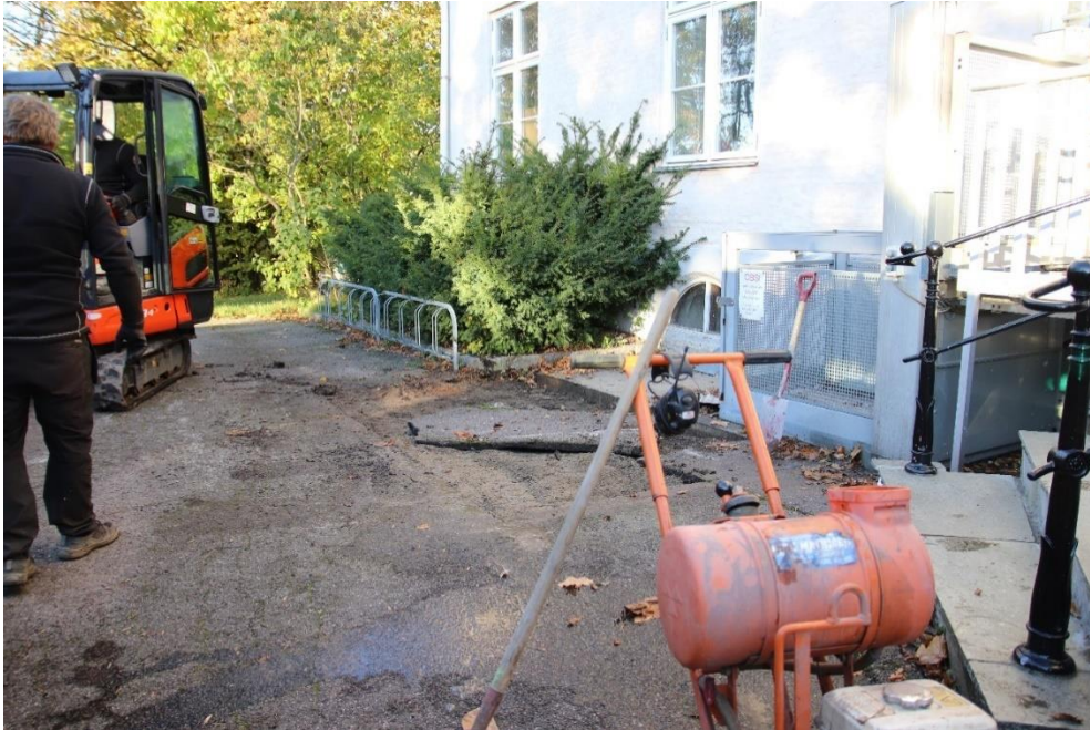
Figur 2 Foto mot vest. Cf53879_2

Undersøkelsen innebar ingen graving ned i grunnen, og dermed ingen arkeologiske resultater. Med tanke på framtidige inngrep er det likevel en fordel at vi nå kjenner til oljetankens beliggenhet.