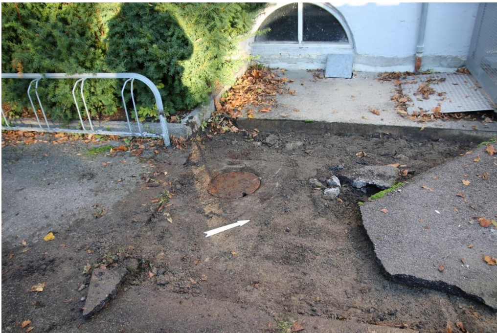
Figur 1 Lokket på oljetank, mot nordvest. Cf53879_1

Området som berøres av tiltaket; Teie (Teigar) - Oslobispens gård, (kulturminne-id 93917), er fredet iht. Lov om kulturminner av 9. juni 1978. Teie var i middelalderen Oslobispens gård helt frem til reformasjonen. Etter reformasjonen ble Teie og underliggende eiendommer sekularisert og ble sammen med Olavsklosterets eiendommer innlemmet i lensherregodset. Den nåværende hovedbygningen er fra 1803, og den har bevart kjeller. Det finnes ingen klar og tydelig oversikt over de fysiske levningene etter det middelalderske anlegget. Så sent som i 1823, da Klüwer registrerte de synlige ruinene (Vestfoldminne 1967:34f), skal murrester på over 1,5 m høyde ha vært synlige. I 1928, i 1943 og i forbindelse med senere ledningsarbeider i 1996, 1997, 2007, 2009 har man truffet på murrester, delvis de som ble registrert på 1800-tallet, delvis andre. Det er også registrert kulturlag inntil en tykkelse av 1,5 m, bestående av blant annet rasmasser med stein, tegl og mørtel (Eriksson & Karlberg 1994, Gansum 1996, Edvardsen 1997 og 2007, NIKU ref. 1563295, 1563401, 15620105).