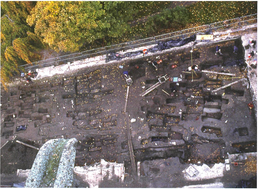
Domkirkegården, Trondheim: utgraving av graver til den etterreformatoriske byens borgere.