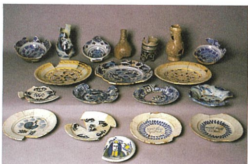
Fig. 4. Et lite utvalg av en stor mengde importert og lokal produsert keramikk som ble funnet i en avfallsbenge på «branntomta» ved Nordre gate i Trondheim. En høytstående borgerfamilie har tilsynelatende bevisst kvittet seg med hele sin samling av bord- og kokekar, kanskje i forbindelse med rydding etter en av bybrannene i 1681 eller 1708.