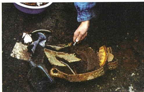
Fig. 3. Proviantforvalterens utedo i Erkebispegården i Trondheim ble brukt også som avfallsbinge, og her fant man et stort og variert utvalg av kasserte bruksgjenstander som gir innsikt i levekårene til en vanlig offiser og hans familie midt på 1700-tallet.

dermed potensielle etterreformatoriske kunnskapsreservoarer uten et formelt vern. Kulturlagene i disse byene er særlig utsatt for sterk press fra moderne byutvikling og miljøtrusler over tid, og kulturhistorisk materiale fjernes kontinuerlig uten registrering.