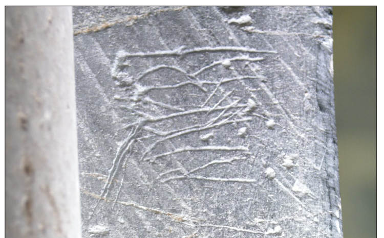
ROMFARER: Denne runeinskripsjonen er det en pilegrim på Romatur som har risset inn i Sakshaug gamle kirke.

fleste fra perioden fra midten av 1100-tallet til 1300-tallet. Til overraskelse for noen, så var ikke runeskrift noe som var beholdt en økonomisk og/eller sosial elite.