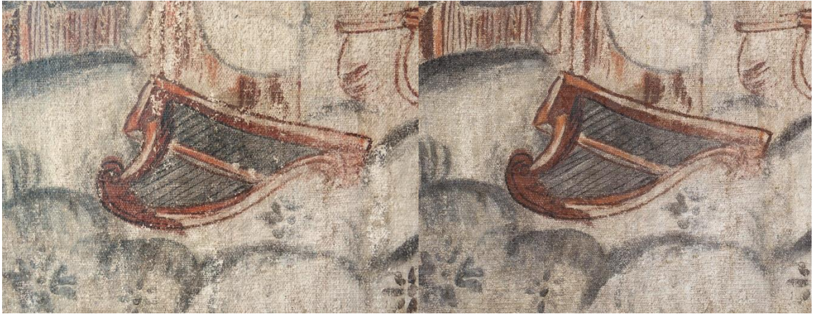
Bilde 10 og 11: Detalj av maleriet før (til venstre) og etter (til høyre) retusjering.