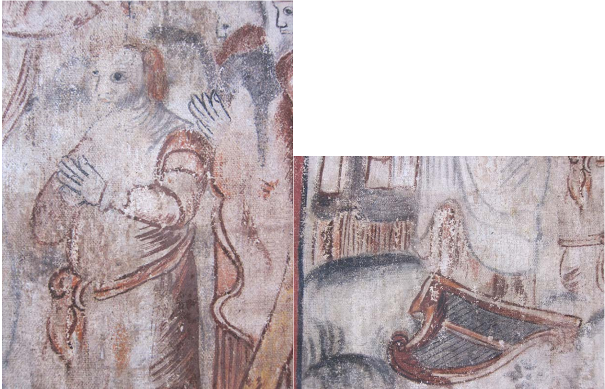
Bilde 7 og 8: Oppskallinger i malingslaget.