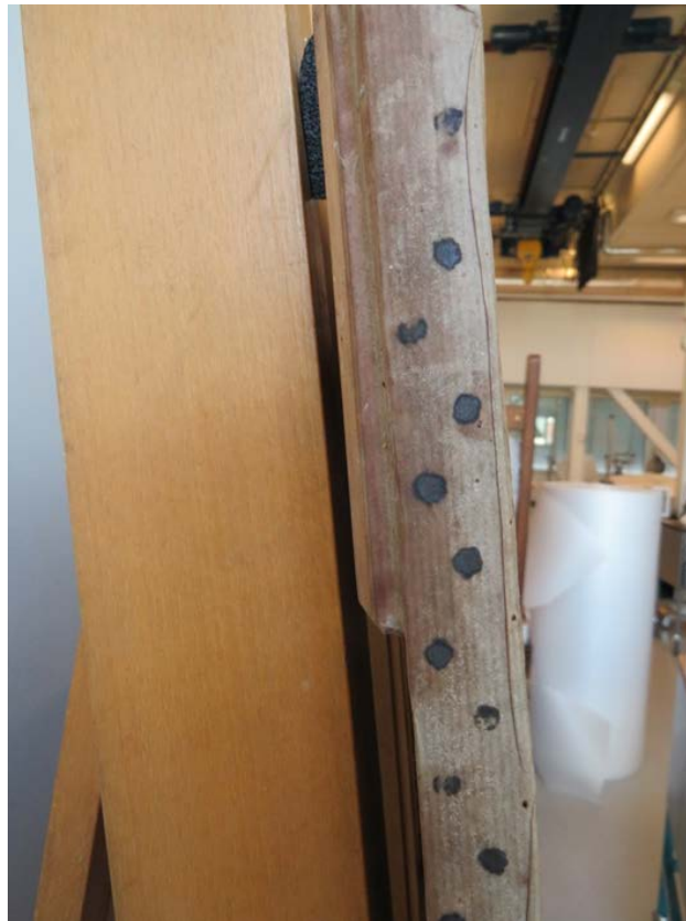
Bilde 4: To rekker med oppspenningsstifter.