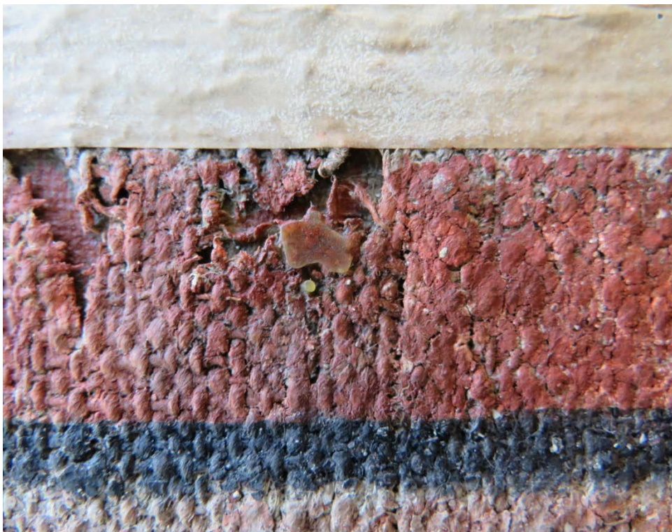
Bilde 6: Dubleringslim som har trengt gjennom til forsiden av maleriet.