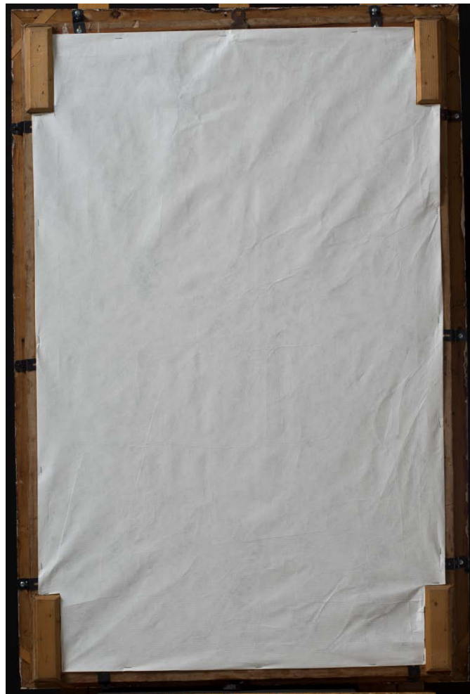
Bilde 12: Maleriets bakside med beskyttelse.