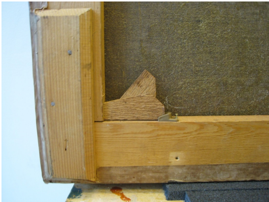
Bilde 9: Baksiden av maleriet med blindramme og kiler med kilestoppere.