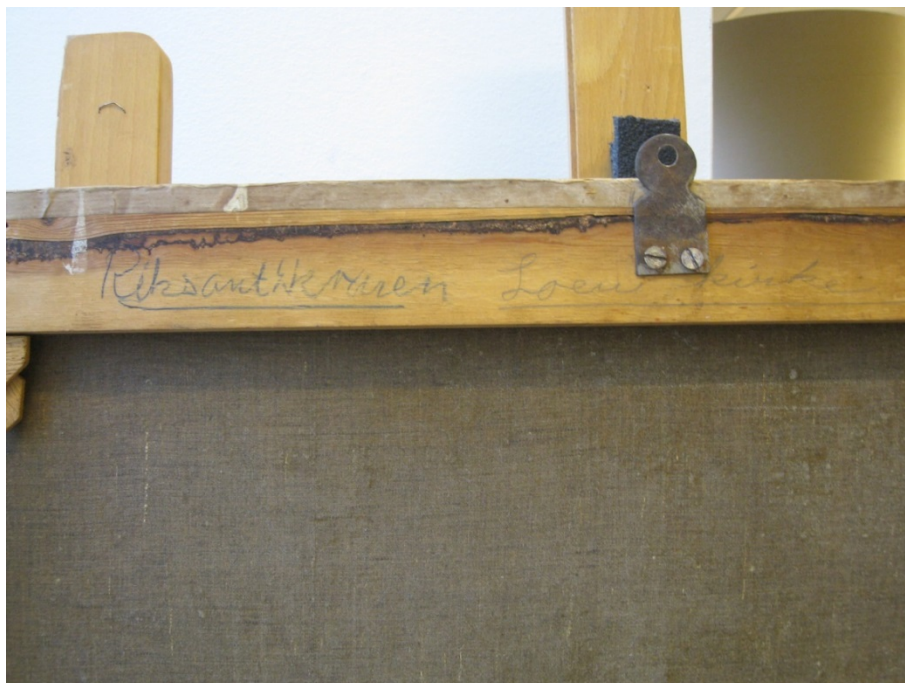
Bilde 2. Maleriet har vært til konserveringsbehandling hos Riksantikvaren.