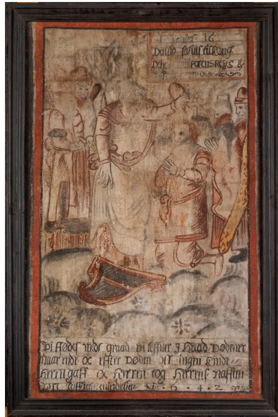
Bilde 3. Forside før behandling. Foto: Birger Lindstad 2016.