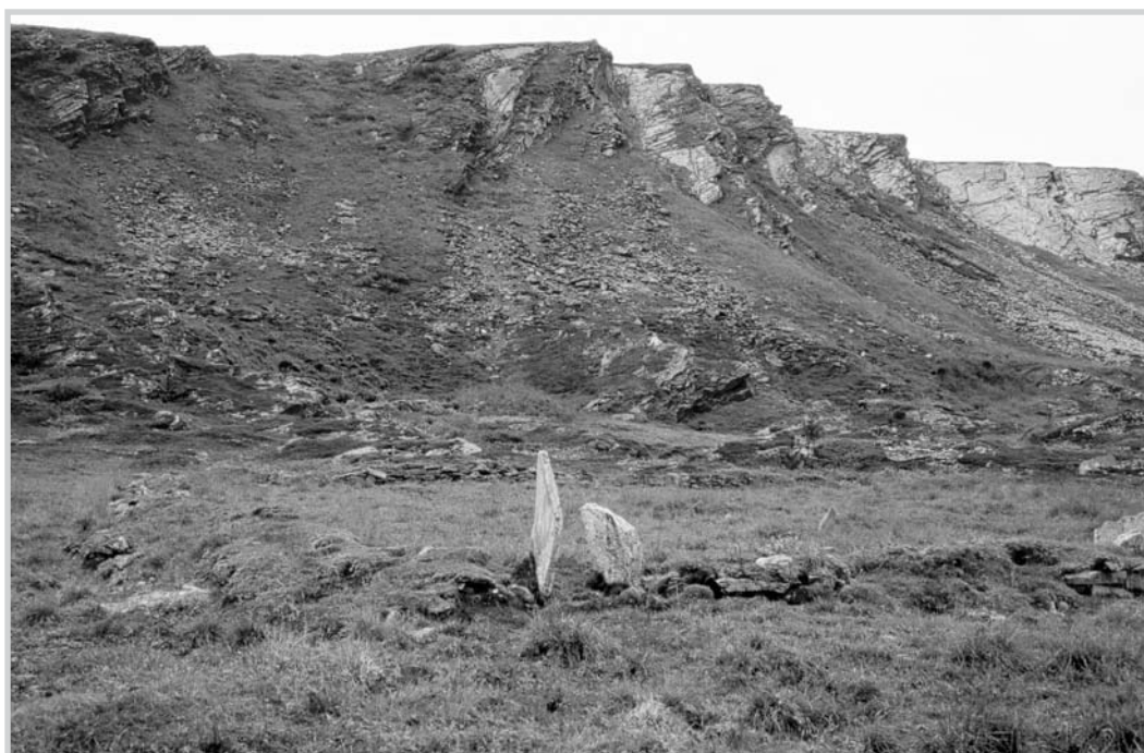
Figur 4. Middelalderkirkegården på Yttervær på Loppa øy er eksempel på kirkegård av type 1.