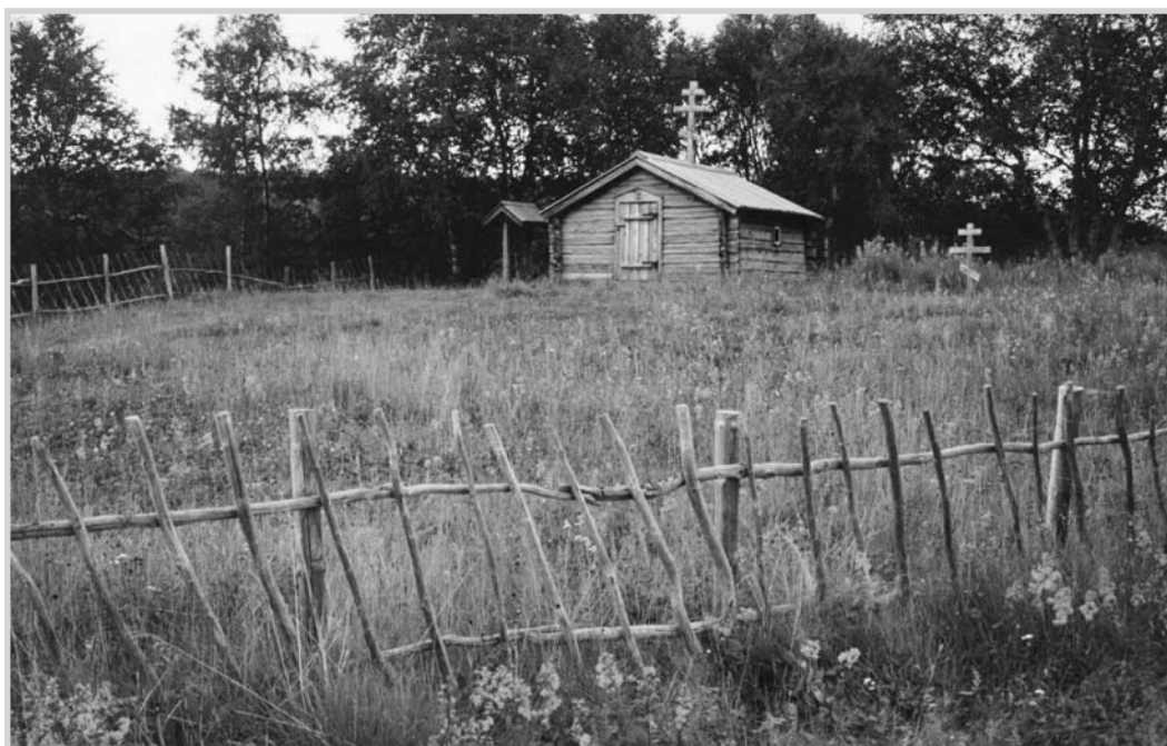
Figur 1. Kirkegården rundt kapellet i Neiden har vært i bruk siden 1700-tallet og fram til ca 1910. Mange graver ligger utenfor dagens gjerde.

Prosjektet har tatt utgangspunkt i en oversikt utarbeida av Riksantikvaren over aktuelle kommuner, basert på andelen samer i henhold til relevante kilder. Registreringa er utført innafor kommuner med en samisk befolkning på henholdsvis over 50% og 25-50% rundt 1890-1900. Registreringa har for øvrig basert seg på Riksantikvarens underlagsnotat om samiske kirker og kirkegårder i Nord-Troms og Finnmark (Holand 2002c).