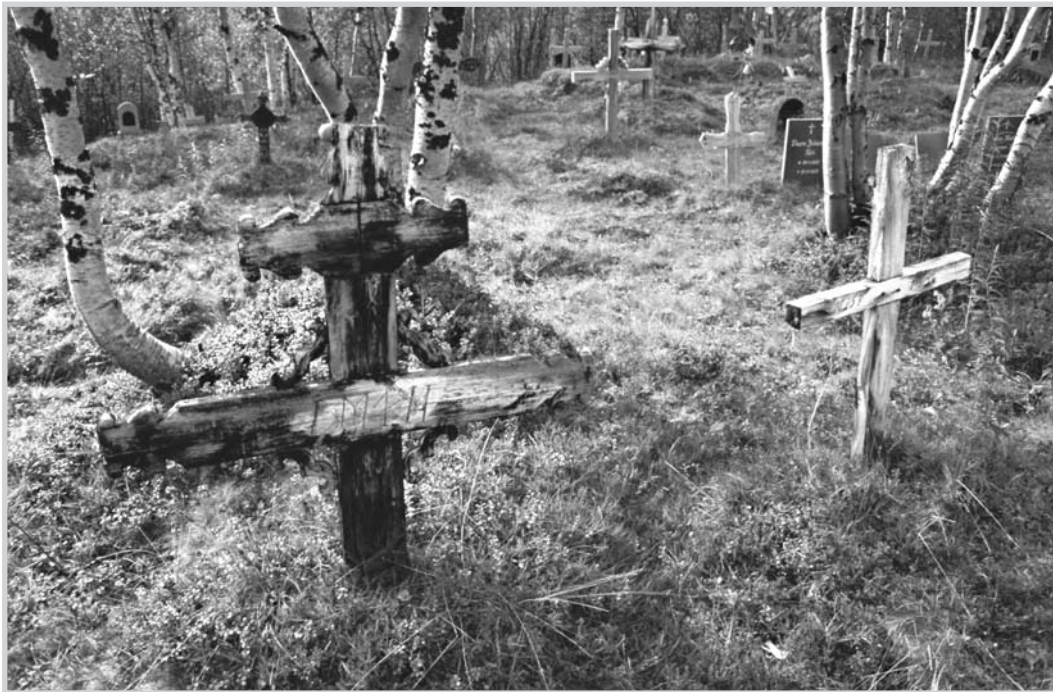
Figur 8. Trekors på Máze gamle kirkegård i Guovdageaidnu/Kautokeino kommune.

Når det gjelder de øvrige kirkegårdstypene, ligger mange av disse i såkalte LNF-soner, og de vil i noen grad kunne bli truet av inngrep, som for eksempel privat hyttebygging. Mange av disse ligger også utsatt til i terrenget ved at de ikke har noen markert avgrensing i form av gjerde eller mur. I tettbygde strøk er automatisk freda kirkegårder i flere tilfeller regulert inn som spesialområder i reguleringsplaner og kommunedelplaner. For de kirkegårdene der dette ikke er tilfelle, ville de bli gitt et sikrere vern om de blei regulert inn som slike spesialområder. For øvrig skal det nevnes at det lokalt ofte er en stor kjennskap til de gamle kirkegårdene. Denne kjennskapen vil i seg sjøl kunne ha en viktig effekt for bevaring og hindre eventuelle inngrep.