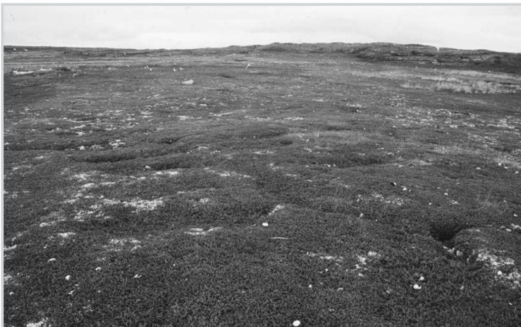
Figur 5. Gravplass fra 1600-tallet uten ytre avgrensing eller gravmerker, eksempel på type 3.1. Gravene synes tydelig som groper i terrenget. Ytre Langøy, Porsanger kommune.

Disse kirkegårdene finnes innafor de fleste topografiske sonene og utgjør den mest dominerende typen. Kirkegården er som oftest tilknyttet ei kirke eller et kapell, men kan òg være såkalte hjelpekirkegårder. De er som regel avgrensa av en steinmur eller et stakittgjerde e.l. eller en kombinasjon av slike. Steinmurer synes å være et trekk ved de eldste kirkegårdene av denne typen. Formen kan variere fra kvadratisk til rektangulær til andre flerkantige og asymmetriske former. Mange er fremdeles i bruk, men som regel gjelder dette bare kirkegårdene som blei etablert i løpet av 1800-tallet (særlig siste halvdel). Typen har bevart flest gravminner av samtlige kirkegårdstyper, som også viser til lokale tradisjoner med hensyn til materialvalg og utforming.