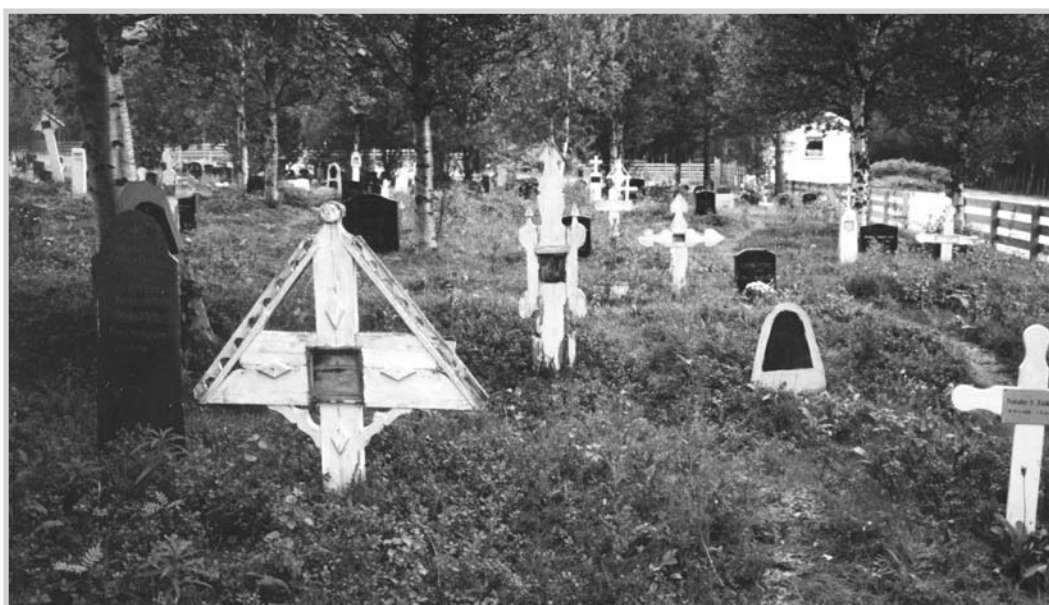
Figur 7. Trekors på Sandeng kirkegård i Gaivuonna/Kåfjord kommune.

dvs. bare initialer, som for eksempel på Máze gamle kirkegård og til dels også på Gullholmen kirkegård i Deatnu/Tana. Som nevnt finnes det også en god del lokale variasjoner med hensyn til materialvalg og utforming. Her kan en særlig nevne kirkegårdene i Kvænangen, Altaregionen og Porsanger, der en finner spesielle skiferstøtter og trekors. Enkelte gravminner av lokal utførelse går igjen fra kirkegård til kirkegård og peker på at det har vært egne «spesialister/makkere» for slike. De fleste av disse gravminnene er imidlertid fra 1900-tallet og derfor representert ved graver som ikke omfattes av kulturminneloven.