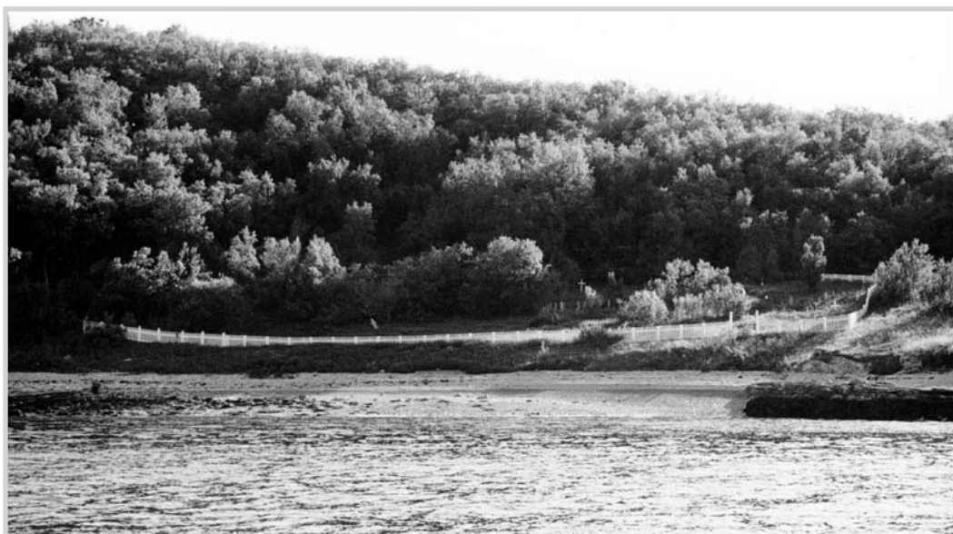
Figur 6. Kirkegården i Nordstraumen, Kvænangen, er eksempel på kirkegård av type 5.