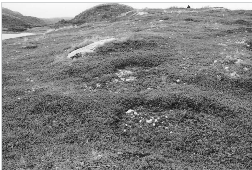
Figur 3. Skoltesamisk gravplass på Buholmen, Sør-Varanger kommune. Gravene vises som rektangulære forsenkninger i bakken. Gravene hadde opprinnelig gravhus som i følge tradisjonen ble brent ned på slutten av 1600-tallet. Gravplassen har siden ikke vært i bruk.

Som det går fram av den kulturhistoriske oversikten, knytter kirkegårdene/gravplassene seg til ulike begivenheter og tidsperioder fra mellomalderen (12/1300-tallet) til begynnelsen av 1900-tallet. De er også av ulik konstruksjon og plassert i forskjellige topografiske soner fra ytterkysten til innlandet. Kirkegårdene/gravplassene kan også tilknyttes ulike kulturelle soner, som grovt sett kan karakteriseres som henholdsvis samisk/norsk, sjøsamisk/innlandssamisk og østsamisk. Benevnelsen «kirkegård» vil i denne sammenhengen referere til et begravelsesområde som er klart avgrensa/omslutta av et gjerde, en mur eller liknende og som regel i nær tilknytning til en kirke/et gudshus. En «gravplass» vil referere til et begravelsesområde uten en kunstig avgrensing, og som regel uten en kirke/et gudshus i nær tilknytning. Det kan være flytende overganger her, men begge representerer i denne sammenhengen en kristen jordgravskikk.