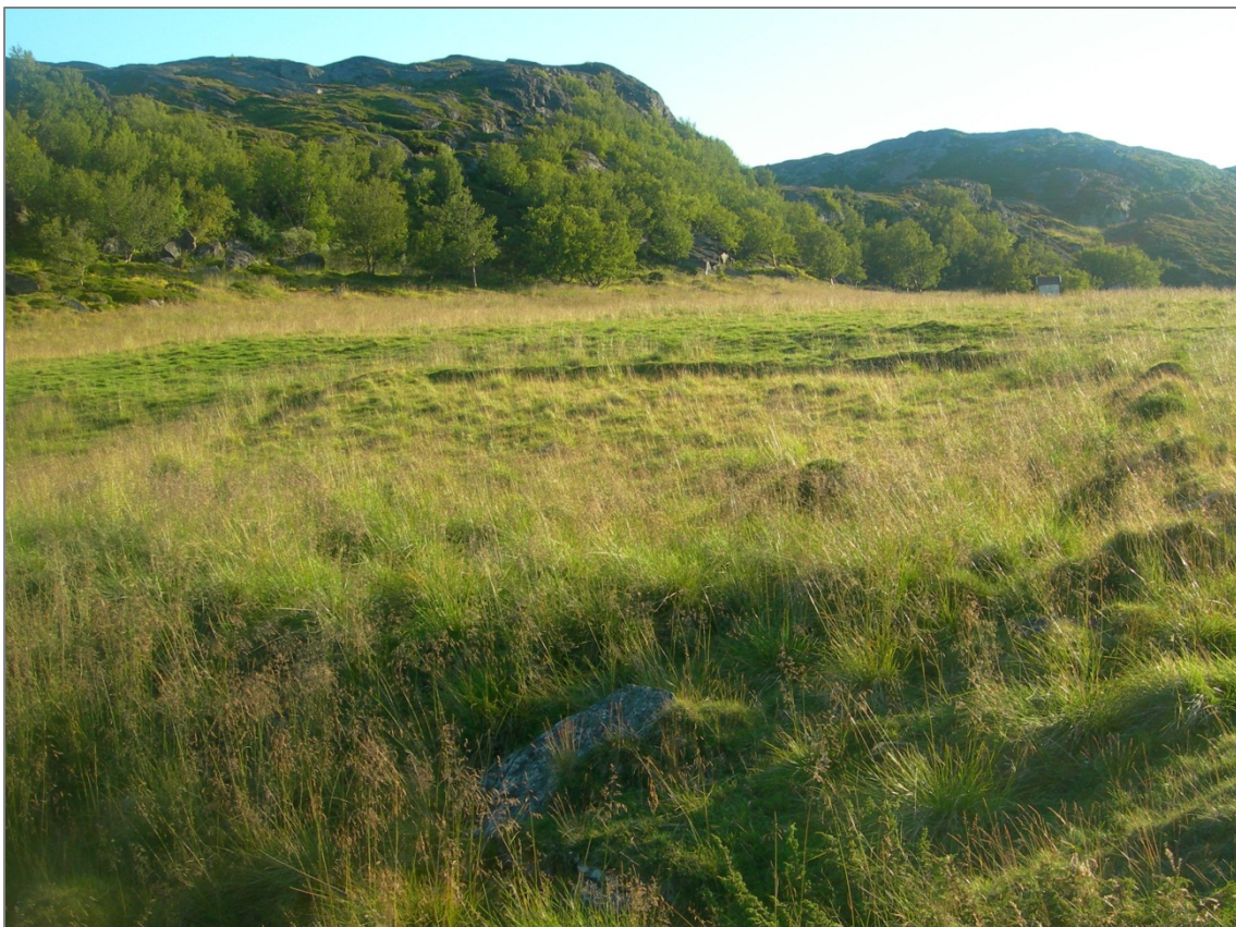
Figur 11: Potetåker omgitt av jordvoller, Porsánggu/Porsangin/Porsanger kommune.

Foruten bygninger vil det være en rekke andre spor etter reindrift og jordbruksaktivitet. Fra dem som deltok i intervjuene var det, med unntak av bakerovner, ikke nevnt noen kulturminnetyper innen denne gruppen som ble vurdert som særlig verdifulle for tiden etter 1920. Enkelte kulturminnetyper har imidlertid fått lite fokus, også innenfor gruppen av automatisk fredete kulturminner fra tiden før 1920. Et eksempel her kan være torvuttak og dyrkingsflater som potetåkrer. Disse er så vanlige og tallrike at de på mange vis er blitt usynlige. Per dags dato finnes det bare 12 eksempler på dyrkingsflater i Finnmark som er registrert i den nasjonale kulturminnedatabasen Askeladden (Riksantikvaren 2012a). Potetåkrer kan i dag være vanskelige å identifisere siden de har vært del av en småskala driftsform. De er gjerne små og i noen tilfeller omgitt av jordvoller (figur 11). De vanligste og mest alminnelige kulturminnene kan bli glemt hvis sjeldenhet får for stort fokus. Likeledes er det registrert 31 torvuttak i Finnmark hvor av hele 26 er registrert i Kvalsund kommune (Riksantikvaren 2012a).