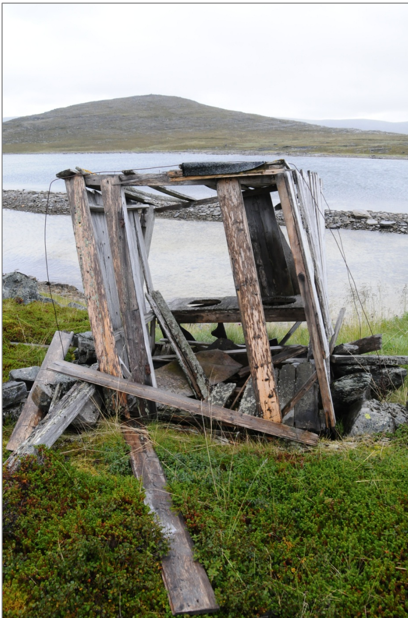
Figur 7: På vei mot tuft - falleferdig utedo i Lávvárvuotna/Lafjord, Nordkapp kommune.

kulturminner fra nyere tid, vil være utslagsgivende for hvilken arealbruk som kan tillates etter kulturminneloven. I områder med fleretnisk befolkning kan slike spørsmål være vanskelige å avgjøre, kanskje særlig når det kommer til bygninger. I motsetning til arkeologiske kulturminner er bygninger som regel knyttet til «manns minne» og fortellertradisjon. Eieren har oftest kunnskap om hvem som var tidligere eiere, om bruk og en mening om etnisk tilskrivning. I slike sammensatte områder, og i områder der fornorskningen har hatt stort gjennomslag, kan det være lite gehør for at en bygning er et samisk kulturminne. Den samiske fortiden representerer for noen en strevsom, ubehagelig fortid som man over generasjoner har brukt tid og krefter på å legge bak seg (jf Krogh 1999; Pramli 1999). I slike områder vil det utvilsomt by på utfordringer å definere en bygning som automatisk fredet og samisk, hvis nåværende eier er av en annen oppfatning.