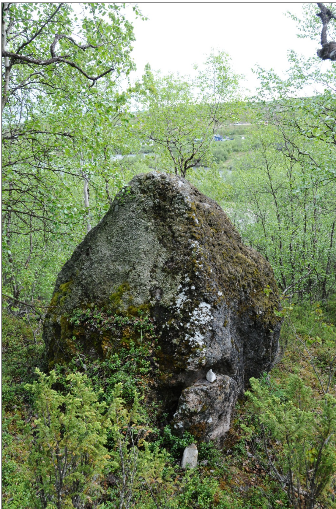
Figur 1: Samisk offerstein med spor av ny bruk, Guovdageainnu suohkan/Kautokeino kommune.