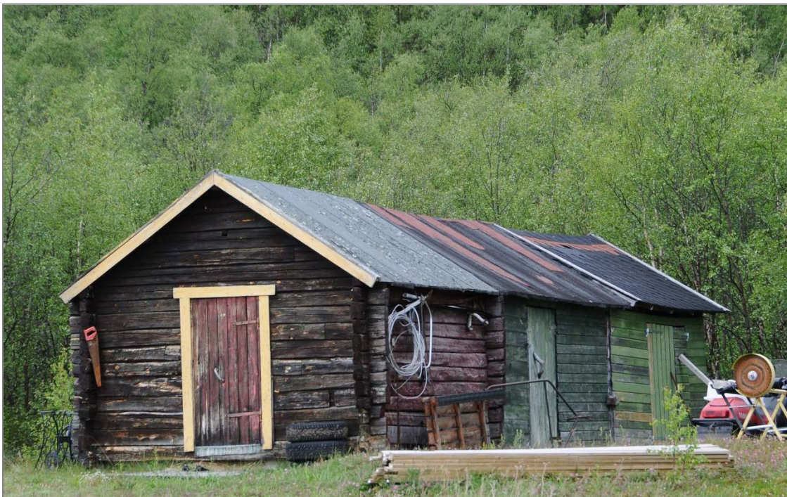
Figur 9: Áiti/stabbur med flere påbyggingsfaser og ulik materialbruk. Guovdageainnu suohkan/Kautokeino kommune.

Innføring av en fast grense og en differensiert verdisetting vil også samsvare med retningslinjer og anbefalinger som uttrykkes i internasjonale konvensjoner og deklarasjoner Norge har ratifisert, slik som ILO-konvensjon nr. 169 om urfolk og stammefolk i selvstendige stater (ILO 1989) og FNs erklæring om urfolks rettigheter (United Nations 2007). På nasjonalt nivå vil en endring til fast fredningsgrense og differensiert verdisetting følge opp og være mer i samsvar med intensjonen i Sametingets planveileder. Veileder for sikring av naturgrunnet for samisk kultur, næringsutøvelse og samfunnsliv ved planlegging etter plan- og bygningsloven (plandelen) (Sametinget 2010). Her påpekes som nevnt ovenfor i kapittel 3, at planmyndighetene har ansvar for å legge til rette for tiltak som opprettholder bosetningsmønster og bidrar til å sikre samisk kultur. Veilederen retter videre oppmerksomhet mot muligheten for kontinuitet og fornyet bruk av naturgrunnet. En fast fredningsgrense vil i større grad motvirke at spor etter tidligere tiders bruk av områder båndlegger og hindrer fortsatt bruk.