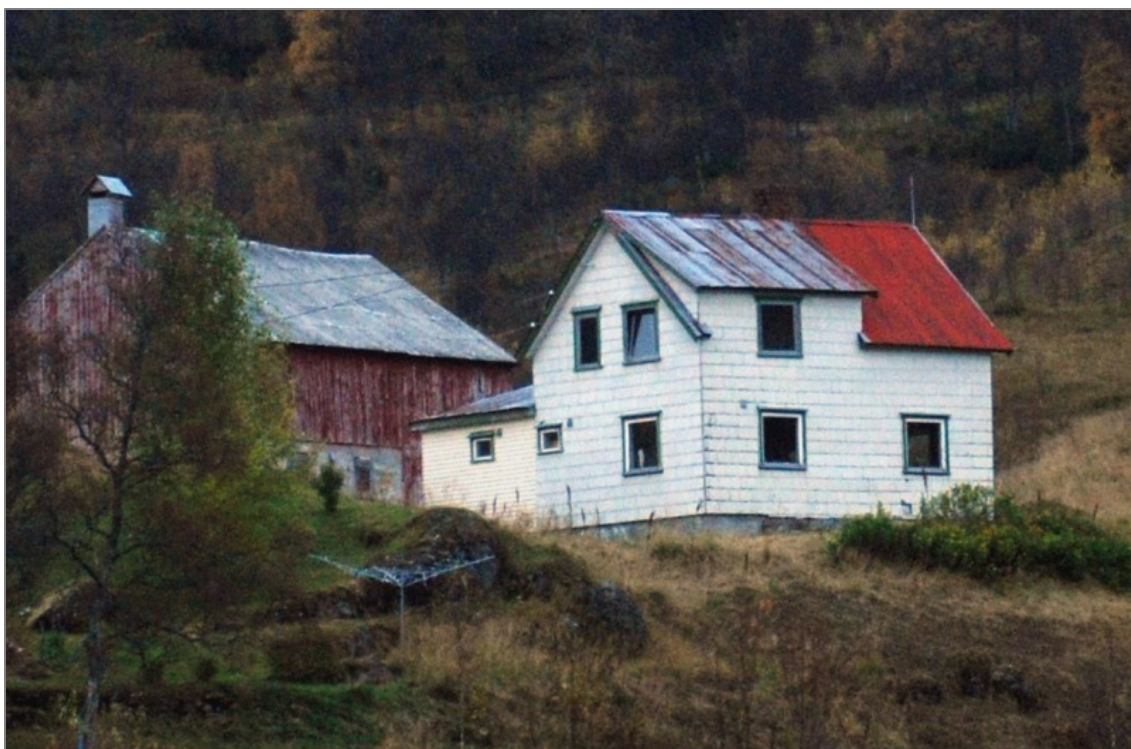
Figur 6: Automatisk fredet samisk våningshus fra 1800-tallet (Sjøli 2003: 114). Hoantas/Nipen, Skániid suohkan/Skånland kommune.

Denne situasjonen er i ferd med å endres siden Sametinget og Riksantikvaren i 2011 igangsatte et flerårig prosjekt som har til hensikt å registrere samiske bygninger (Sametinget 2012). Men fortsatt er antallet automatisk fredete samiske bygninger i Askeladden svært lavt, noe som kan sees i sammenheng med nettopp alderen på bygningene. Selv om byggeåret ligger over hundre år tilbake i tid, er de færreste eldre enn 1800-tallet. Et annet aspekt er at bygningene ikke nødvendigvis framstår som autentiske, opprinnelige og gamle. De viser med all tydelighet at tid er varighet, opphopning og akkumulasjon. De tilhører ikke bare sitt opprinnelige byggeår og sin første bruksfase. De er fysiske manifestasjoner på akkumulert og levd tid, og er følgelig like mye samtid som fortid. Mange er bygd om, halvveis revet, vinduer er byttet ut, ytterkledning er endret, tilbygg er føyd på, torv og never er byttet ut med bølgeblikk eller tjærepapp (figur 6). De færreste bygningene kan derfor karakteriseres som autentiske uttrykk for sitt byggeår. De kan i like stor grad være utrykk for 1890-, 1930-, 1950- og 1990-tallets bruk og vedlikehold av dem. Også i intervjuene kom det fram en vektlegging av autenticitet. Nye byggematerialer som var føyd til i ettertid ble ansett som forringende på kulturminneverdien.