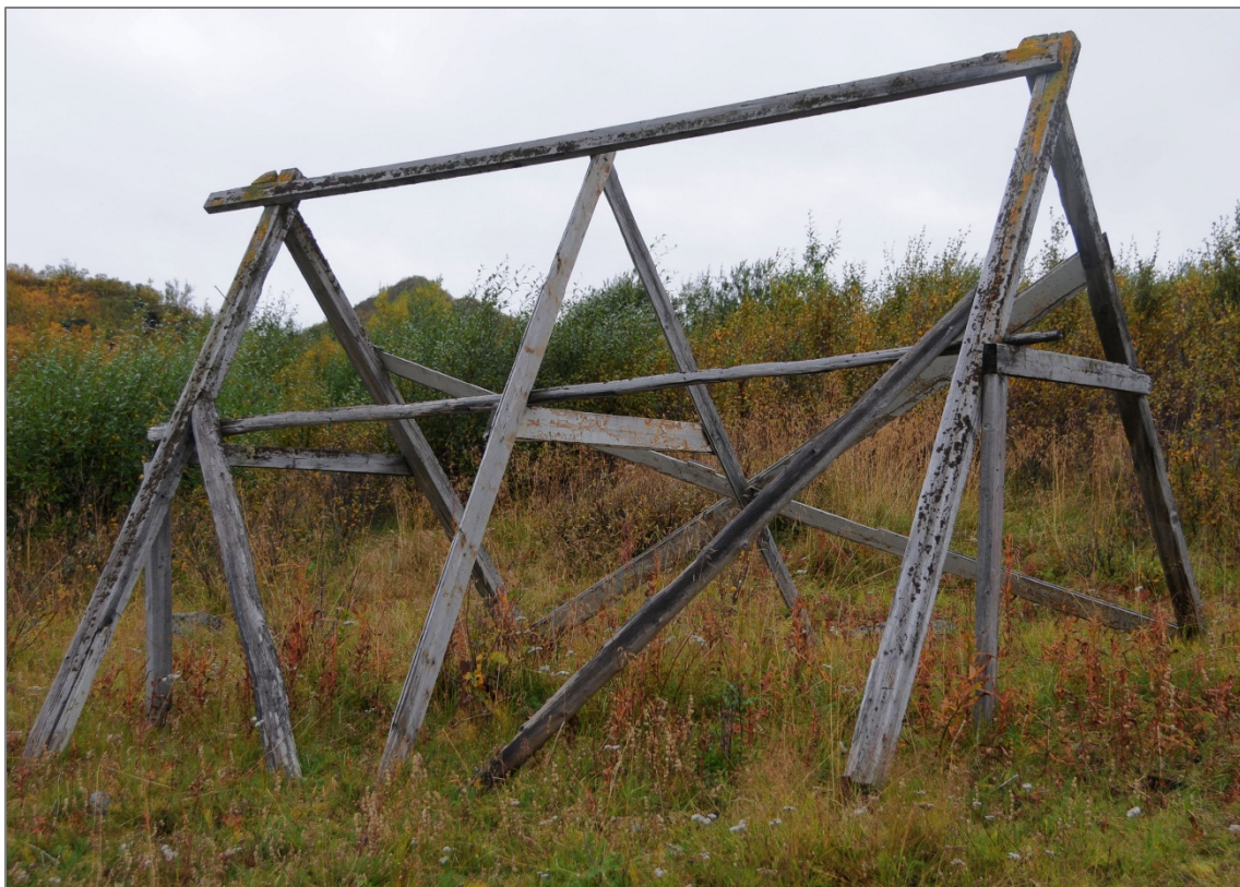
Figur 3: Stativ i fjæresonen, Riehpovuotna / Repparfjord, Kvalsund kommune.

Ingen som ble intervjuet hadde særlig omfattende erfaring med vedtaksfredning og ingen hadde erfaring med prosessen å erklære kulturminner fra perioden 1537-1649 automatisk fredet (jfr. kulturminneloven § 4,3).