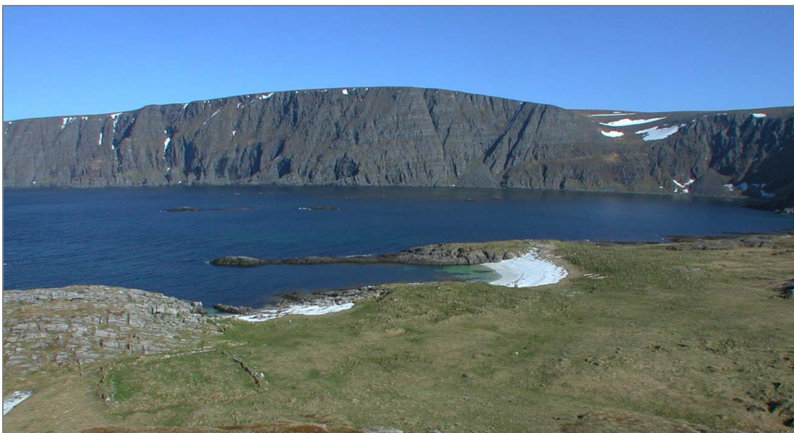
Figur 8: Eksempel på akkumulasjon av kulturminner på ett og samme sted over flere hundre år. Tunes, Nordkapp kommune.

Ubehaget ved denne blottleggingen og det akselererende forfallet opphører ikke før bygningen er brutt ned og går inn i en ny fase som tuft, skjult under gress og vegetasjon og følgelig igjen tildekket. De største utfordringene for samisk kulturminneforvaltning kan derfor ligge i å få gehør for bevaring og ivaretagelse av bygninger som har nådd et forfallsstadium og er gått ut av bruk. Til dette kommer i tillegg at den påbegynte registreringen av automatisk fredete samiske bygninger og bygninger som nærmer seg fredningsgrensen, vil gi en økende mengde antall fredete objekter. En forvaltning av automatisk fredete samiske bygninger i tråd med dagens kulturminnelov, vil derfor kreve betydelig større ressurser enn det som i dag er avsatt til dette formålet.