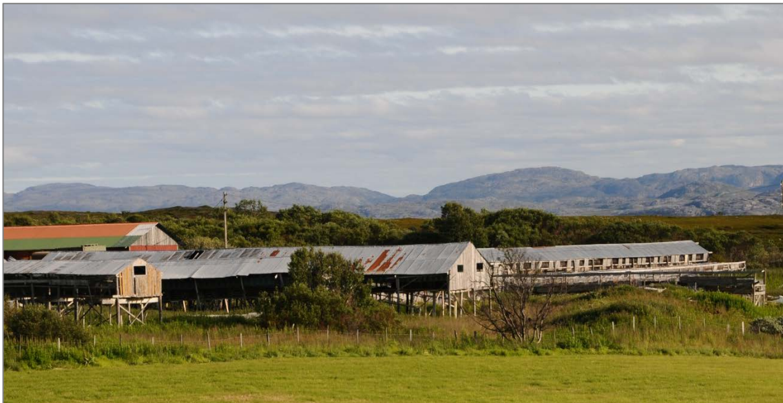
Figur 5: Nedlagt pelsdyrfarm ved Ceavccageadje /Mortensnes kulturminneområde, Unjárgga gielda/Nesseby kommune.

kulturminnene og utgjør mange objekter antallsmessig. De er i liten grad blitt registrert og ført inn i Askeladden. Til eksempel var det i 2010, nærmere 32 år etter innføringen av 100-årsgrensen, bare registrert 18 bygninger i Askeladden som sto oppført som automatisk fredet og med Sametinget som ansvarlig etat. Disse lå i Nord- Trøndelag, Nordland og Troms, ingen i Finnmark (Holm-Olsen et al. 2010; Myrvoll et al. 2012). Tallet er ikke representativt for det faktiske antallet samiske bygninger, og selv om Finnmark og Nord-Troms ble utsatt for den brente jords taktikk under andre verdenskrig, er det likevel mange kommuner som har eldre samiske bygninger. Bare i den samiske kommunen Deatnu/Tana alene er det i følge SEFRAK-registeret kjent 112 bygninger eldre enn 1900. I Sametingets rapport Vern og forvaltning av samiske byggverk ble antallet automatisk fredete samiske bygninger i 2003 anslått å være ca. 1200, og antallet ble forventet å stige med ytterlig 800–900 i løpet av en tjuetårsperiode (Sjølie 2003: 70).