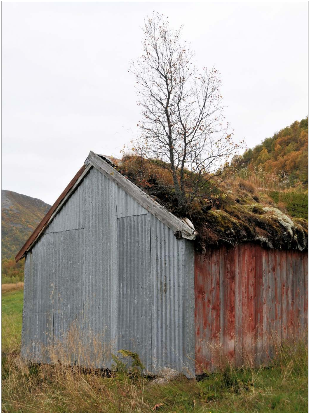
Figur 4: Torv, tre og bølgeblekk. Istandsetting med nye materialer. Nordland fylke.