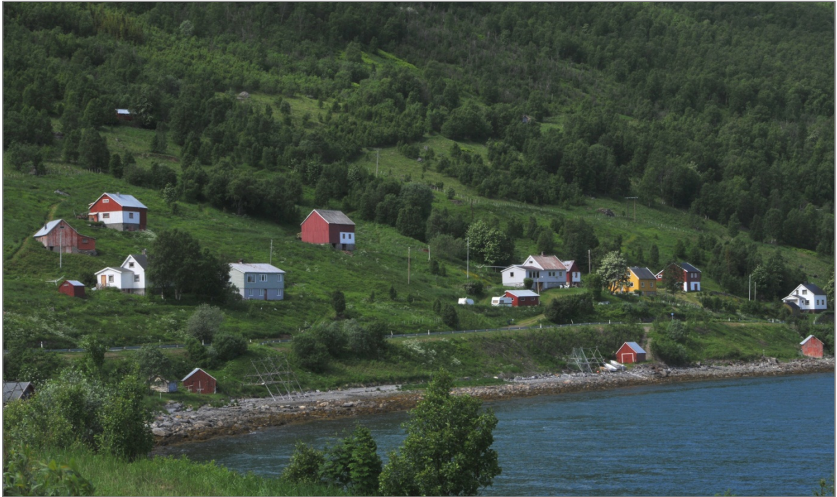
Figur 12: Kulturmiljø med kulturminner fra ulike tidsepoker, Skárfvággi/Skardalen i Gáivuona suohkan/Kåfjord kommune.