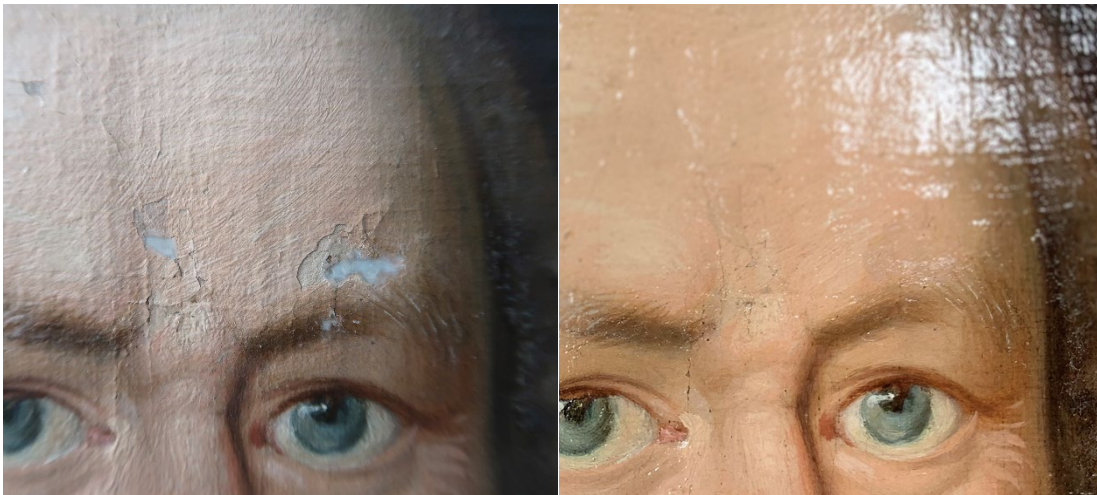
Rifter etter riftreparasjon og kitting (venstre), og etter to strøk ferniss og retusjering (høyre).

Maleriet ble refernissert med 15 % dammarferniss i to strøk påført med pensel, deretter retusjert med Gamblin Conservation Colors. Etter retusjering fikk maleriet to lag med 20 % dammarferniss påført med spray.