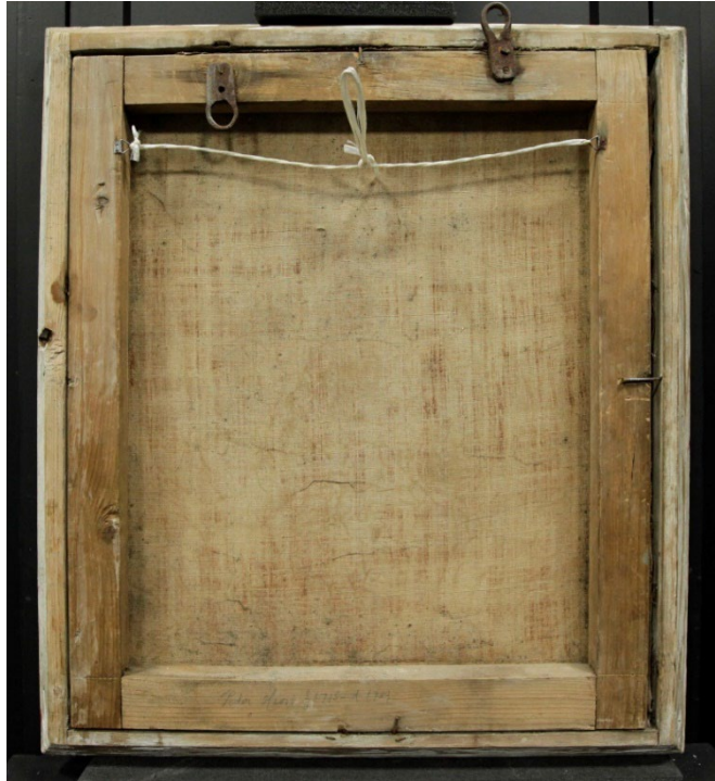
Maleriets bakside før konservering.

Pynterammen er forgylt og har en enkelt profilering. Den har en tynn hvit krittgrundering og er malt rød på sidene. Treverket er i god stand, men den har litt slitasje på hjørnene og en del løs maling, oppskallinger og utfall ned til treverket. Overflaten er støvete.