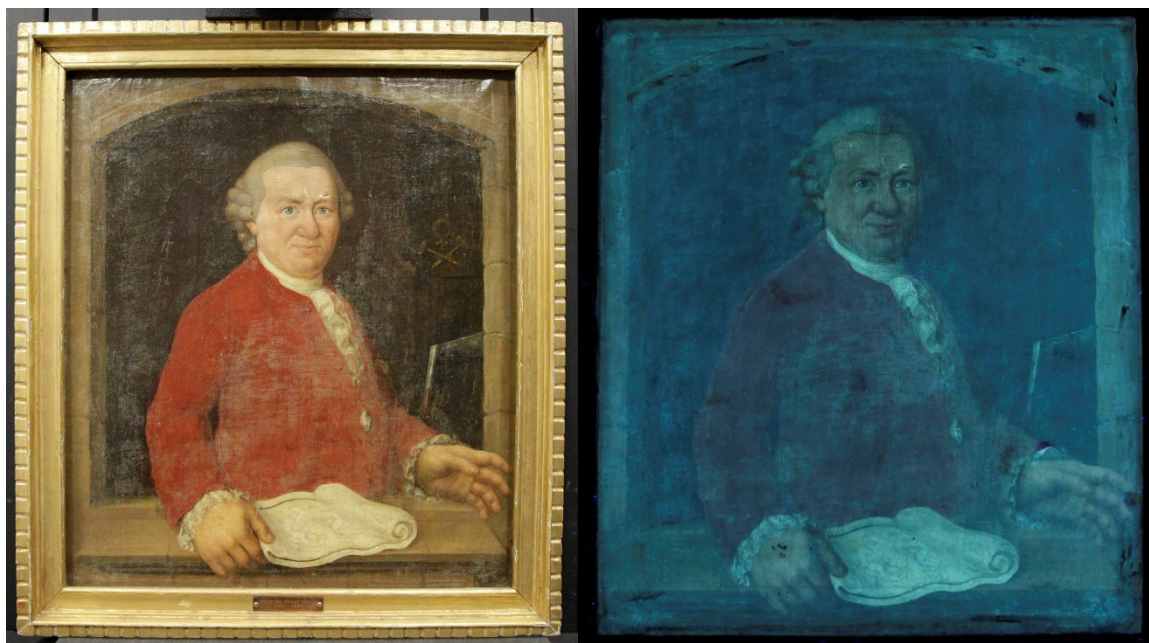
Maleriet i pålys (venstre) og UV-belysning (høyre) før konservering. Bildet tatt i UV-belysning viser en rensetest i øvre høyre hjørne.

Maleriets fenniss er gul og svært nedbrutt, og det er skitt og støv på overflaten.