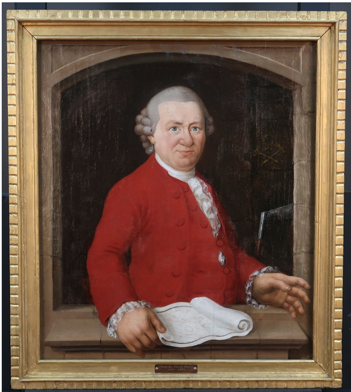
Maleriet etter konservering.