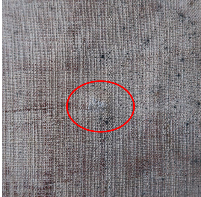
Riftreparasjon med polyamid sveisepulver

Maleriet ble refernissert med 15 % dammarferniss i to strøk påført med pensel, deretter retusjert med Gamblin Conservation Colors. Etter retusjering fikk maleriet to lag med 20 % dammarferniss påført med spray.