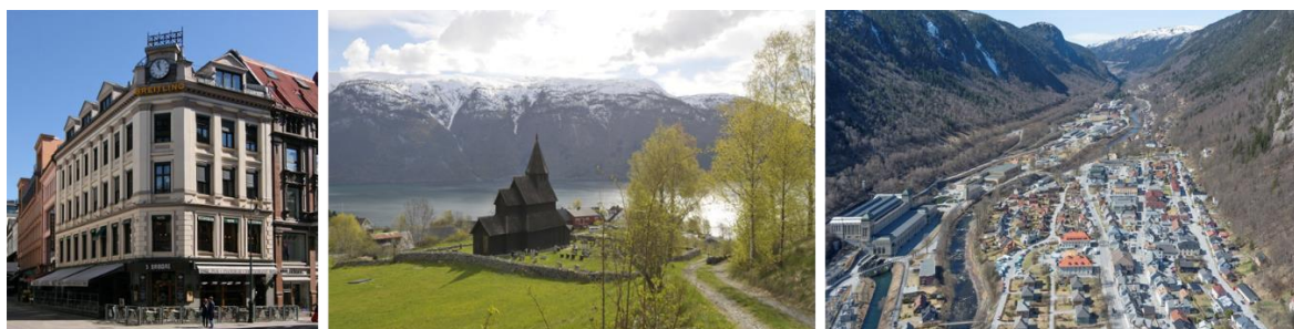
Figur 2: Karl Johans gate 14, Urnes stavkirke og Rjukan. Fredet og/eller verdensarv? Stor eller svært stor verdi?

Verdisetting: Forskjellen på og anvendelsen av stor verdi og svært stor verdi blir noe uklare når vi har med et fredet anlegg å gjøre og om vurderingen av verdi gir noen forvaltningsmessig konsekvens. Gjennom et fredningsvedtak (eller en forskriftsfredning) blir et anlegg/en bygning gitt nasjonal betydning med en forvaltningsmessig konsekvens. Dette er ikke nødvendigvis en verdivurdering eller sårbarhetsvurdering som sier noe om muligheten for endring/tiltak på det fredede anlegget. Tilsier svært stor verdi en strengere forvaltningsstatus enn stor verdi, og motsatt, vil stor verdi medføre at verdien vurderes som 'begrenset' i forhold til å være svært stor? Forbeholdes svært stor verdi verdensarv eller andre særskilte objekter?