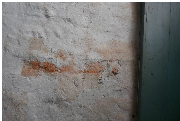
Figur 5: Rester etter rød maling på østveggen.