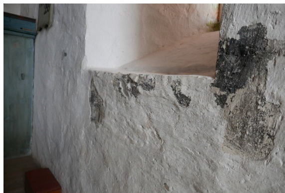
Figur 6: Flere rester etter skyggemaleri bak altertavle.