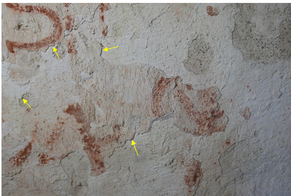
Figur 2: Detalj i sidelys. Piler viser løse kalklag.