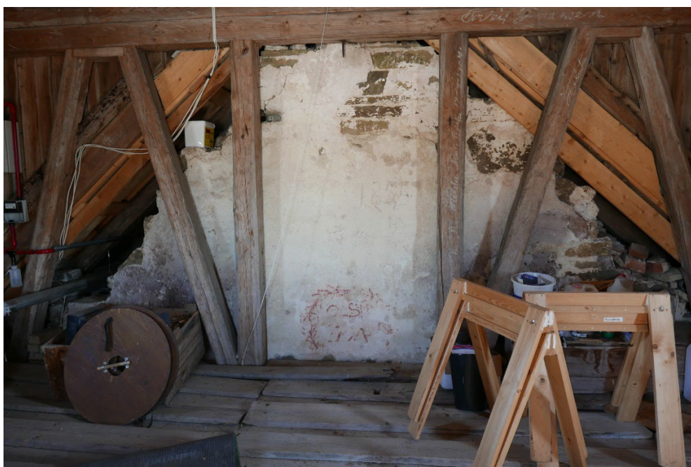
Figur 3: Dekoren er i dag tilgjengelig fra tårnloft, og er svært utsatt for støt.