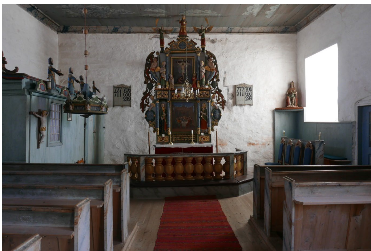
Figur 7: Kirkerommet sett mot øst. Rester etter skyggemalerier og røde malingsrester er på østveggen.