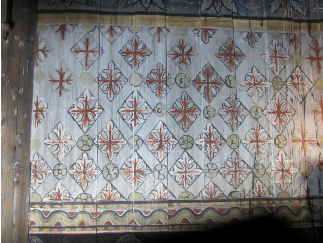
Figur 2 Helopptak sekundær dekor nordvegg