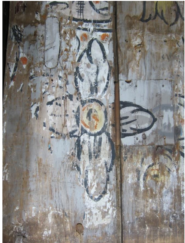
Figur 5 Samme område 2022. Ingen nye tap observert.