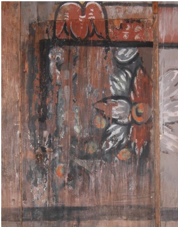
Tile 4 forfra, fotografert 2007