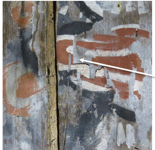
Samme område, fotografert 2022. Hvit pil viser der et flak har falt av siden 2013.