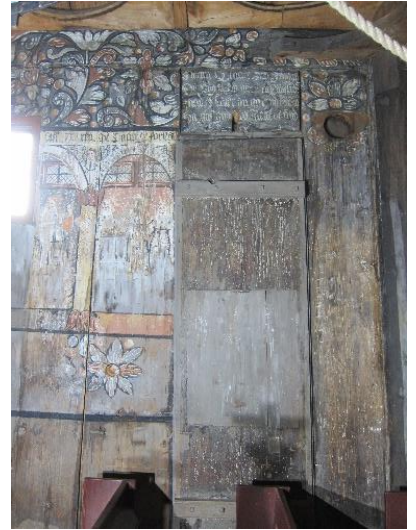
Figur 3 Oversiktsbilder sørvegg original limfarge 1600-tall. Helopptak lot seg ikke gjennomføre i dagslys pga motlys fra vindu.

Alle observerte skader er dokumentert. Det som ikke er dokumentert sitter tilsynelatende fint.