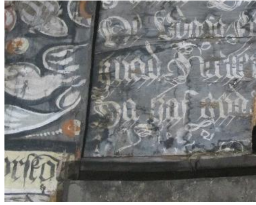
Samme område 2022, fotografert fra gulvet. Ingen nye malingstap observert.