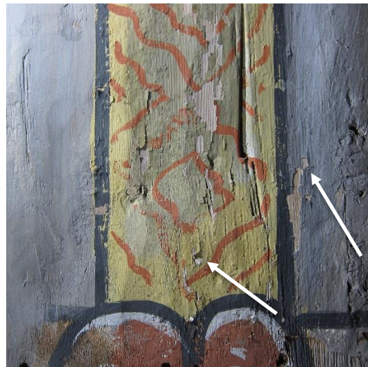
Samme område, fotografert 2022. Hvite piler viser malingsflak som har falt av etter 2013.