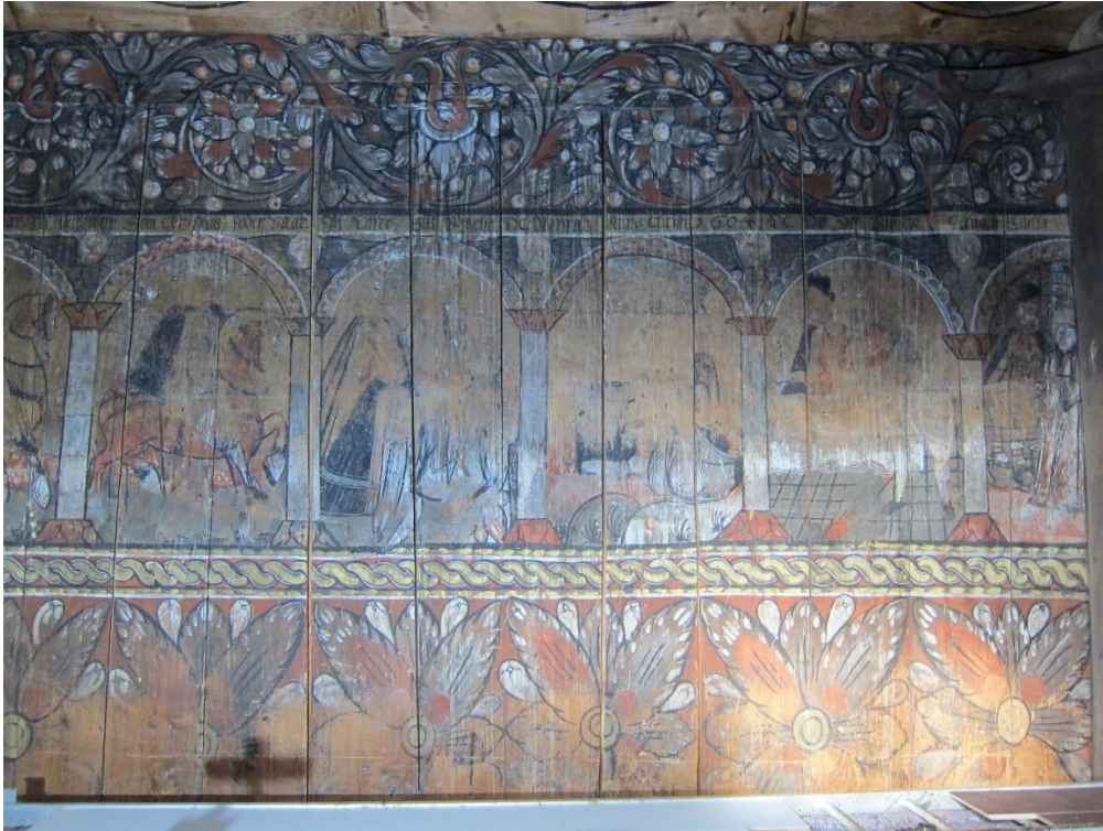
Figur 1 Helopptak nordvegg, original limfarge 1600-tall

Alle observerte skader er dokumentert. Det som ikke er dokumentert sitter tilsynelatende fint.