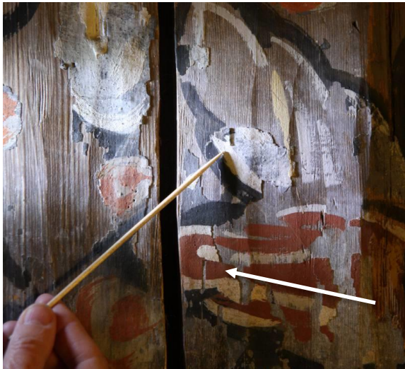
Område på sørvegg med løs maling, fotografert 2013