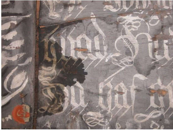
Område på andre tile bakfra, øverst. Innfelling over gammel dør. Fotografert 2007