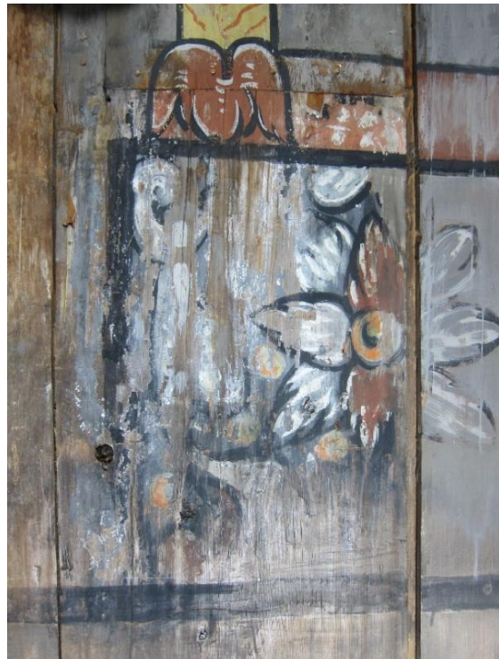
Samme område i 2022. Ingen nye malingstap observert.