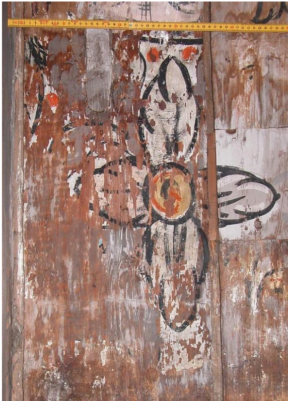
Figur 4 Område på sørvegg, siste tile før stav, fotografert 2007.

Foto er hentet fra behandlingsrapporten i 2007, fra bildemateriale etter befaring i 2016, og nye bilder ble tatt av de samme stedene i 2022.