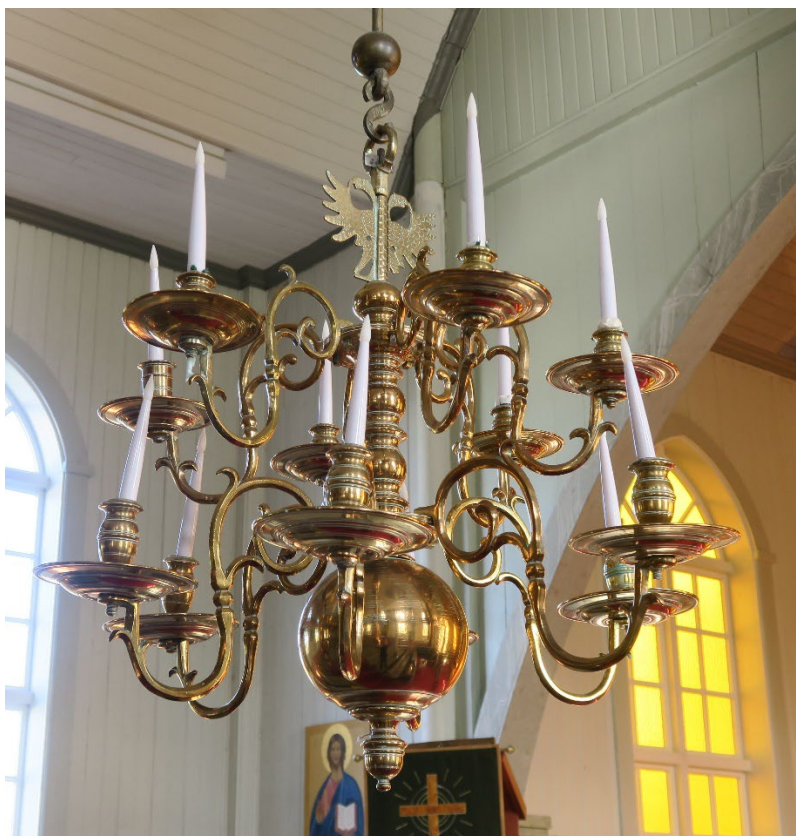
Foto 2: Lysekroner i to etasjer med seks lysarmer i hver etasje.