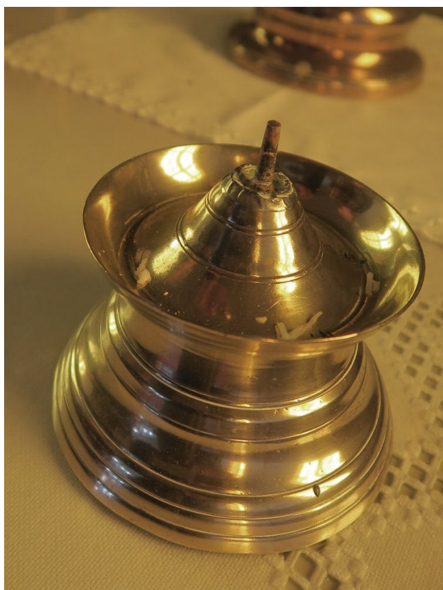
Foto 3: To lysestaker, trolig fra 1700-tallet.