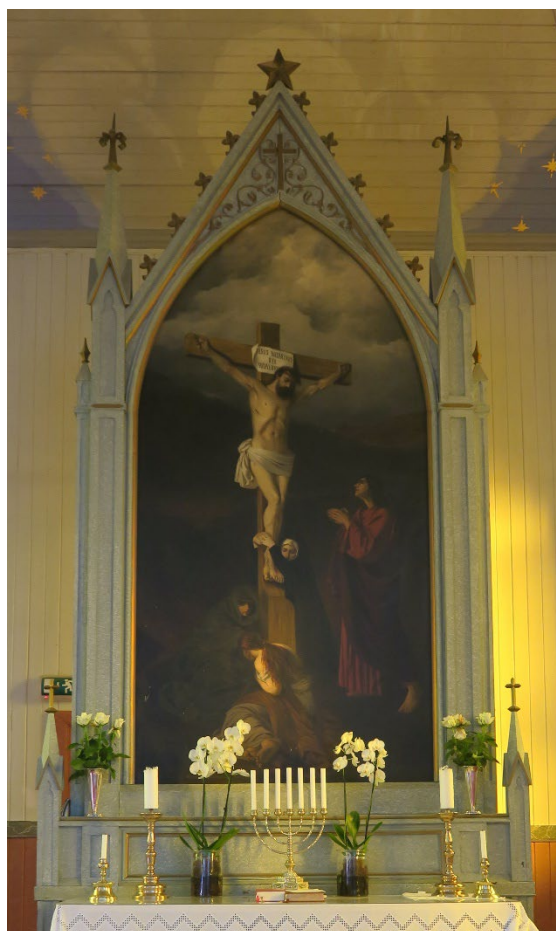
Foto 12: Altertavle, datert 1885.