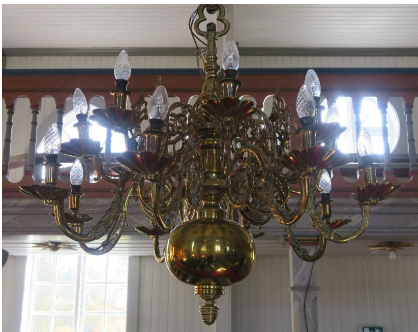
Foto 10: Lysekrone med uviss alder, omgjort til elektrisk.