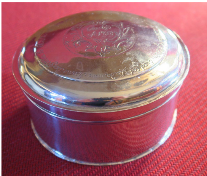
Foto 8: Oblatskrin, datert 1758.