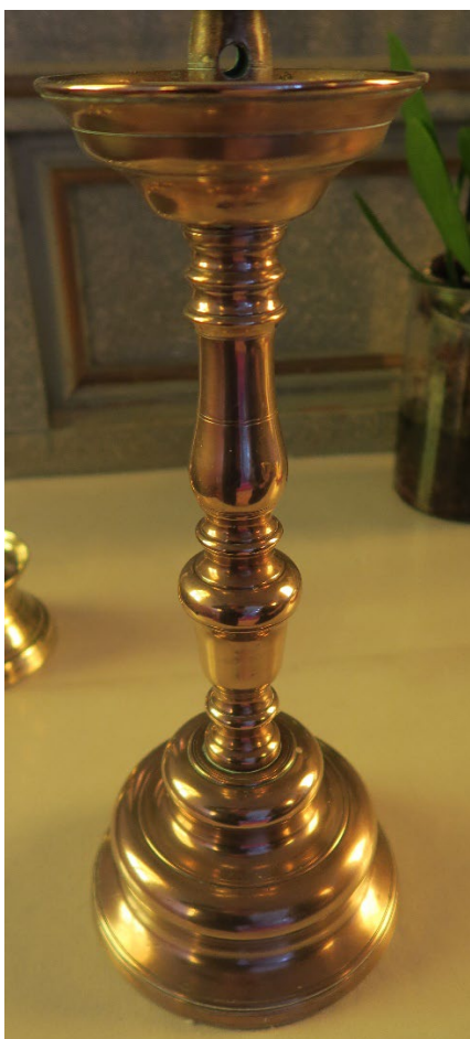
Foto 11: En av to lysestaker, trolig fra 1800-tallet.