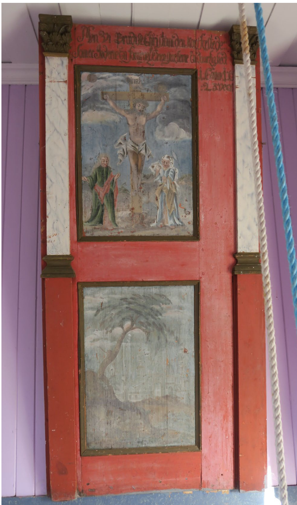
Foto 7: «Altertavle» som henger i tårnrommet.