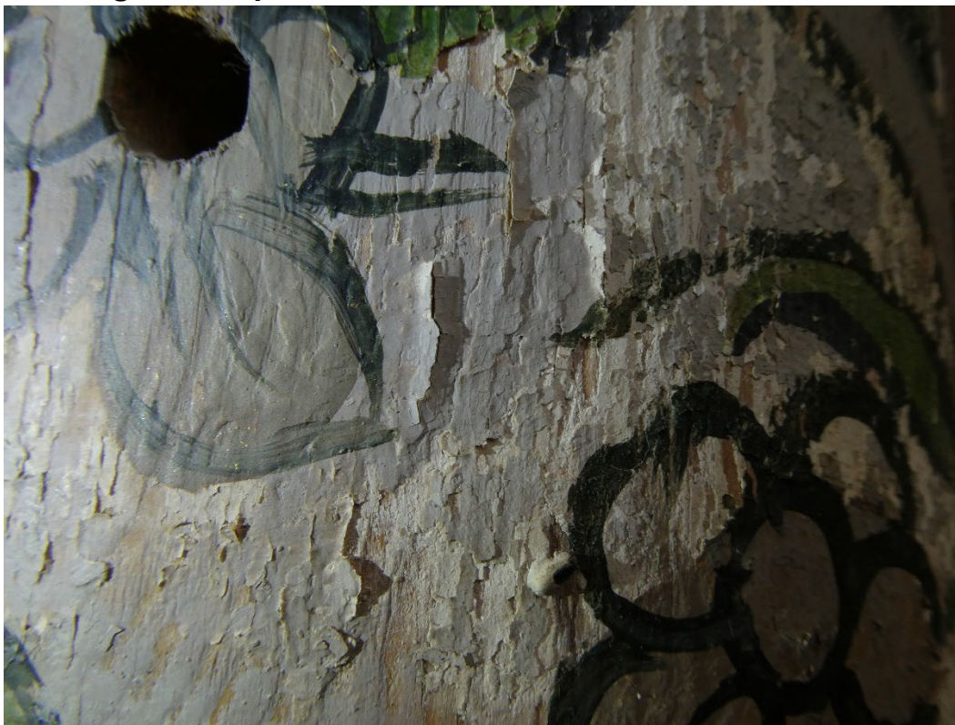
Foto 1: Detalj av søyle på altertavle.