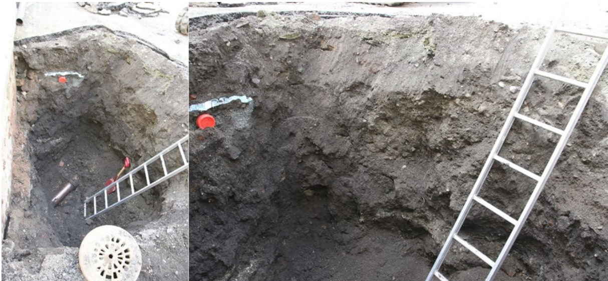
Figur 3. Område øst og graving for kum. Det ble registrert en større nedgravning og kun moderne gjenfyllingsmasser.

etterreformatorisk kjellernedgravning eller byggegrop, samt eldre kum i dette området. Det gravde hullet var ca. 1,8 m x 2,5 m stort i toppen, gravd med skrå profil ned til bunnen, ca. 2,5 m under dagens overflate. Fyllmassen bestod av omrottet sandgrus, stein, rød/gul tegl, murstein og noe glass og metall. Et glasert keramikkrør/avløp ble påtruffet i bunn og løp i NV-SØ-retning. Det så ut til å være minst to gjenfyllinger, én før 1850 i bunn, og én moderne gjenfylling i toppen i ca. 1,5 m tykkelse. Det ble ikke observert automatisk fredete kulturlag eller naturlig undergrunn da nedgravningene i området har fjernet det opprinnelige nivået av disse. Det ble gravd med fallretning mot kummen i øst.