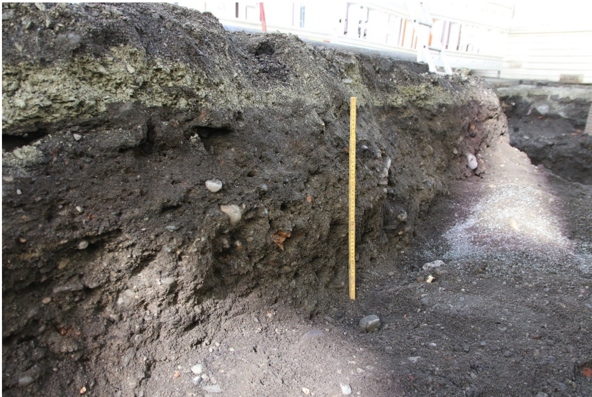
Figur 4. Grøften i nordøst etter delvis fjerning av fyllet. Det ble registrert noe lagdeling, men ingen større nedgravning. Målestokken på bildet er 0,5 m. Bildet tatt mot ØNØ.

Den sørlige og vestlige utstrekningen av grøften utgjorde ca. 7,5 meter (fig. 5). Toppen av grøftetfyllet ble gravd med 1 m bred skuffe mens det ble benyttet en smalere skuffe halvveis ned, da det var antydning til kulturlag i bunn av grøften. I vestlig profilside nord for den sørlige kummen ble det registrert en over 2,1 m lang oljetank, det ble observert noe forstyrrelser på grunn av plasseringen av denne. Det etterreformatoriske kulturlaget som ble påtruffet i bunn av grøften, ca. 1,2 m under toppen, så uforstyrret ut, og bestod av mørkgrå, kornete sand, med noe dyrebein og små mengder kull. Stedvis lå laget lagvis med lys gul, grov sand. Dyrebein og treverk hadde en middels til dårlig bevaring. Ved nærmere undersøkelser ble det registrert etterreformatorisk keramikk. Det ble forsiktig gravd gjennom laget, uten at man påtraff noen automatisk fredete kulturlag eller strukturer, eller gjorde funn av middelaldersk karakter. Laget har en ukjent tykkelse, og det er usikkert om middelalderske lag er bevart under nivået 1,2-1,3 m. Kulturlagene var synlig både i vestlig og østlig profilside fram til grøftesvingen.