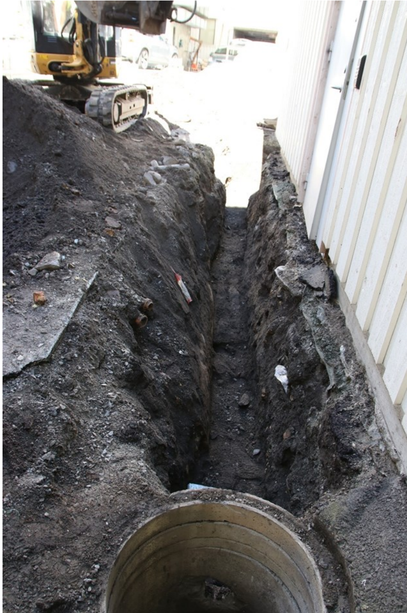
Figur 5. Sørlig ende av grøften sett mot N. En oljetank er synlig i profilsiden mot V. Grøftebredden i bunn er ca. 0,5 m.