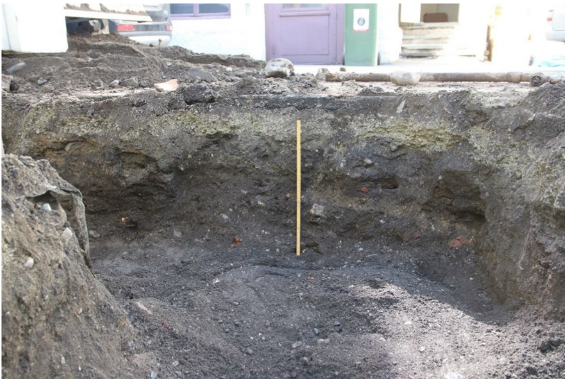
Figur 7. Grøftesvingen etter delvis fjerning av fyllet. Med 0,5 m målestokk. Bildet er tatt mot V. Det ble registrert relativt uforstyrrede etterreformatoriske kulturlag.