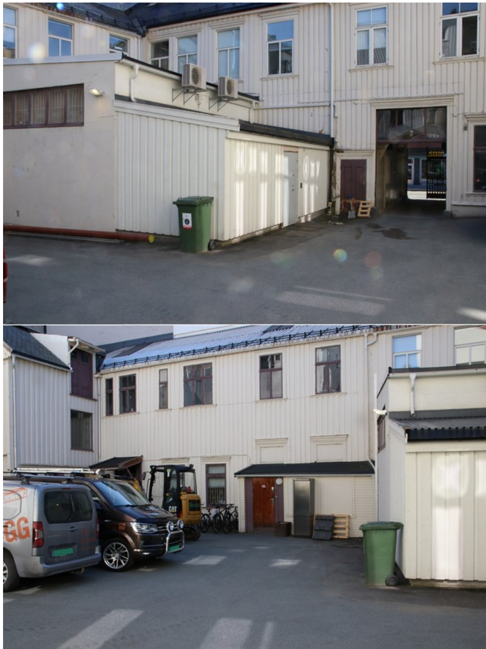
Figur 1. Øverst: Oversiktsbilde av bakgården før gravingen, henholdsvis tatt mot sørøst (øverst) og øst.

Gravingen ble gjort i eksisterende grøft, fra innsiden av portrommet, og i nordlig og østlig retning langs bakgårdsbygningen i Olav Tryggvasons gate 6 (fig. 1). Arkeolog fra NIKU overvåket gravingen. Gravemaskinfører var Ole Kristian Thorgård, fra Brende AS. Det ble gravd med en 2,3 tonns Cat gravemaskin med 1 m og 0,5 m bred skuffe. Overvåkingen ble gjennomført i løpet av tre dager, den 23. juni, 28. juni og 1. juli 2021. Utstrekningen av grøften i N-S-retning var ca. 7,5 m, mens utstrekningen Ø-V var ca. 8,5. Total lengde var ca. 16 meter. Den sørlige delen av grøften ble gravd smalere i bunn, i ca. 0,5 m bredde, men den nordlige og østlige delen ble gravd i 1,2 m bredde og opptil 2,4 meters bredde lengst øst på grunn av gravingen for ny kum. Det ble kun gravd i moderne og omrotede masser, med en gravedybde mellom 1,1-1,3 m for grøften og opptil 2,5 m dybde rundt kummen lengst øst.