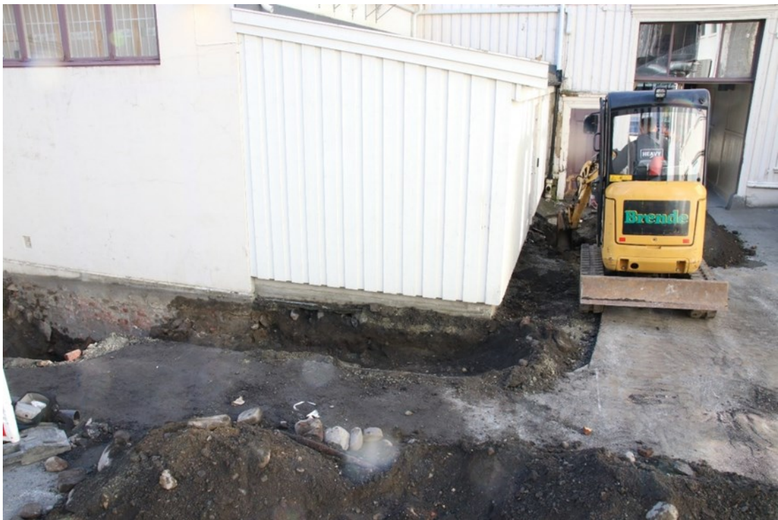
Figur 6. Graving av grøften fra den sørlige kummen.