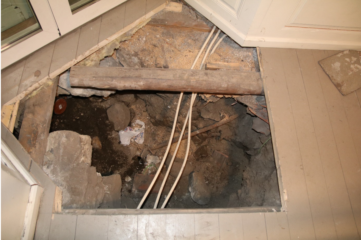
Figur 2. Da62826_NIKU_02. Det oppgravde hullet. Sett mot S.

Det oppgravde hullet målte ca. 0,8 x 1,7 m, og det var gravd ca. 1 m dypt. Det var kun gravd på nordsiden av gulvbjelken, på sørsiden var bare gulvplankene tatt opp. I hullet var det en del stein, tegl og moderne rør. Massen var tørr og løs, og ved opprensing av profilveggene støvet det veldig. I øst var deler av steinfundamentet til bygningen synlig (figur 1).