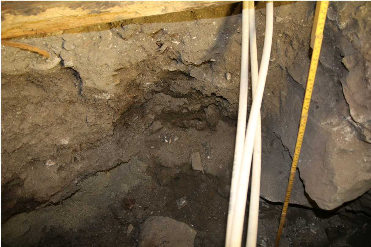
Figur 4. Da62826_NIKU_06. Nordprofilen med moderne masser, etterreformatorisk kulturlag og steril sand.

Samme situasjon som vestprofilen. Det etterreformatoriske, humøse sandlaget fortsatte her (figur 3). Noe treverk, rød tegl og bein var synlig. Et brent beinfragment mot bunnen. Laget ble kuttet av steinfundament til bygning i NØ-hjørnet. Overgangen til den sterile sanden var på 0,8 m dybde under dagens gulvnivå.