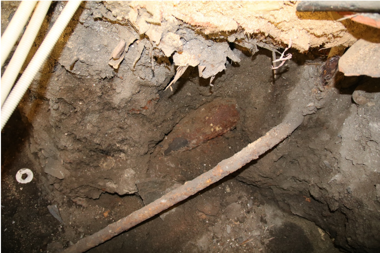
Figur 6. Da62826_NIKU_07. Sørprofilen var preget av ulike moderne inngrep.

Denne delen var også forstyrret av moderne inngrep. Et jernrør stakk ut i SV-hjørnet på ca. 0,5 m dybde under dagens gulvnivå, og et tykkere jernrør var synlig i profilveggen (figur 5). Massen besto av løs, omrotet sand med stein og gul tegl. I SØ-hjørnet fantes et keramikkrør under grunnmuren.