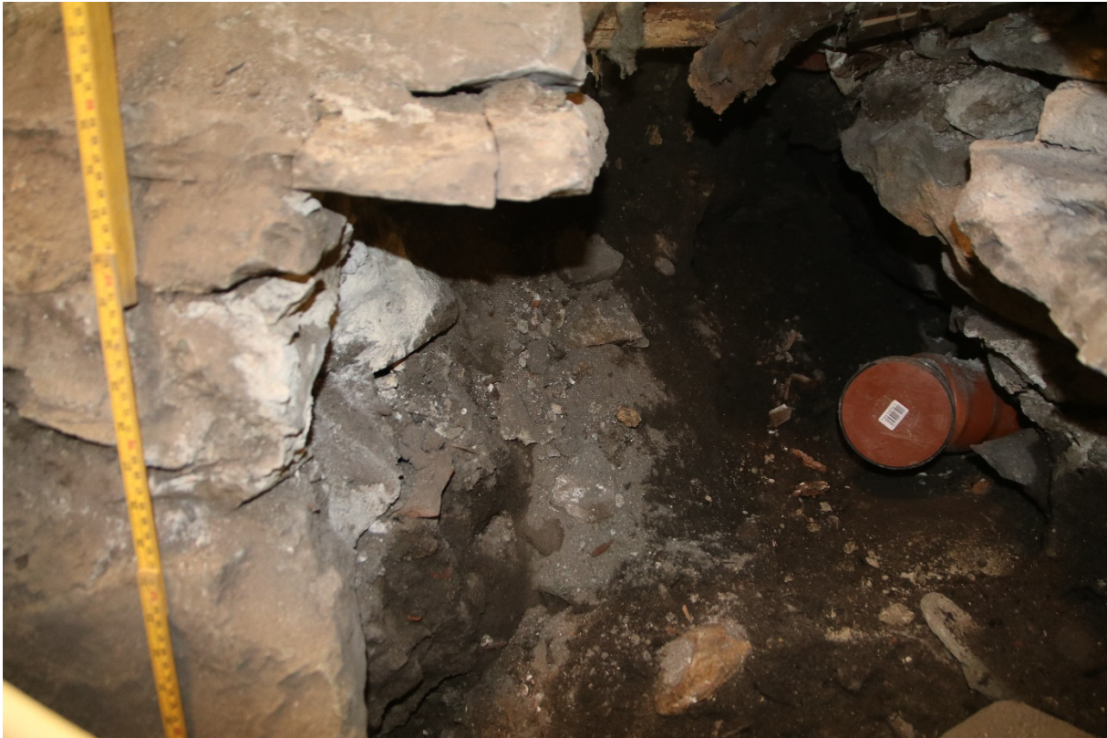
Figur 5. Da62826_NIKU_05. Østprofilen med grunnmur til bygning og avløpsrør.

Denne delen var forstyrret av moderne inngrep, bl.a. fantes et avløpsrør i SØ-hjørnet (figur 4). Grunnmuren gikk ned til ca. 1 m dybde i NØ-hjørnet. Det var gravd et stykke innover der hvor avløpsrøret stakk ut, her var det gravd ned til 0,72 m dybde. Det var vanskelig å se ordentlig innover i dette området fordi det var trangt og lite lys, men området så omrotet ut med løs sand og enkelte steiner.