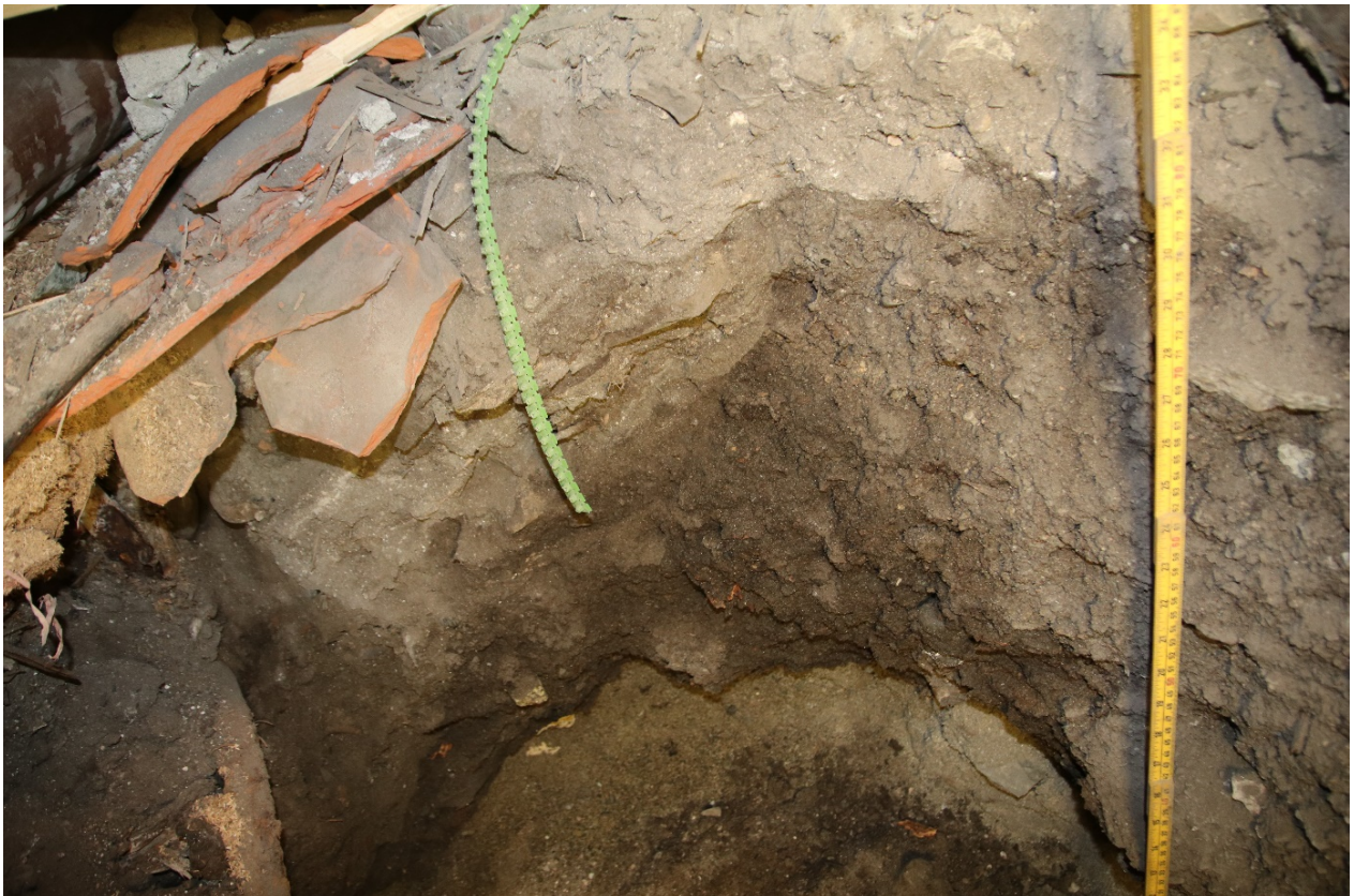
Figur 3. Da62826_NIKU_04. Vestprofilen med moderne masser, etterreformatorisk kulturlag og steril sand.

Tolkning: Kun moderne masser og etterreformatorisk kulturlag i vestprofilen som gikk helt ned til steril undergrunn.