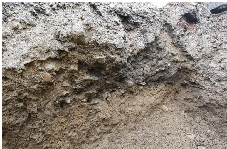
Figur 3 Etterreformatorisk kulturlag. Foto: 20210510_151315.jpg

Etterkontrollen ble gjennomført med en forenklet dokumentasjonsstandard, hvilket innebar at det ble dokumentert med håndmåling, foto og beskrivelser. Da det oppstod problemer med kameraet i felt, ble foto tatt med mobiltelefon. Undersøkellesområdet er omtrentlig tegnet inn i ArcMap (fig. 4) og lagt inn i kulturminnedatabasen Askeladden.