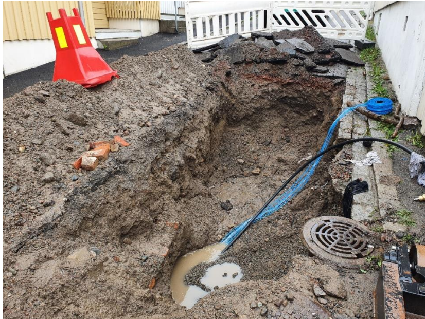
Figur 2 Oversiktsbilde mot nordvest. Foto: 20210510_151635.jpg

Det arkeologiske feltarbeidet ble gjennomført som en arkeologisk etterkontroll. Prosjektleder var Sunniva Wilberg Halvorsen. Arkeolog var på etterkontroll 10.5.2021. Det ble da klart de underveis i arbeidet hadde endret noe på planene. Det ble ikke gravd noe i bakgård. Det var kun gravd fra Conradsgate inn under bygg på Conradsgate 17. Det arkeologiske arbeidet i felt bestod av en etterkontroll av gravearbeidet og dokumentasjon av kulturlag i profiler.