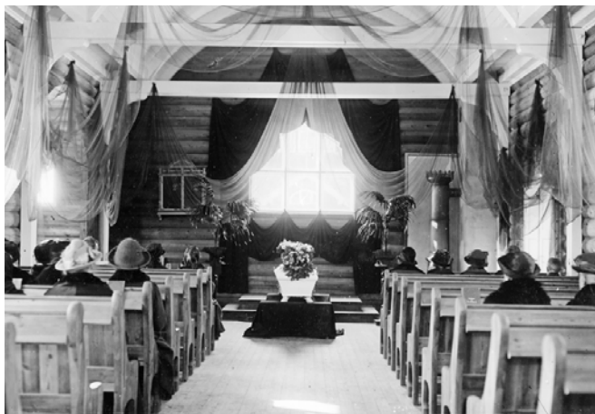
Åmot gravkapell ble tegnet av Henrik Bull, samme arkitekt som tegnet Åmot kirke. Den lavere fløyen er bårerommet, på motsatt side er et tilsvarende utbygg med rom for sangkor. Bildet t.h. er tatt før kapellet fikk glassmalerier og viser rommet drapert med sørgeslør og gardiner.