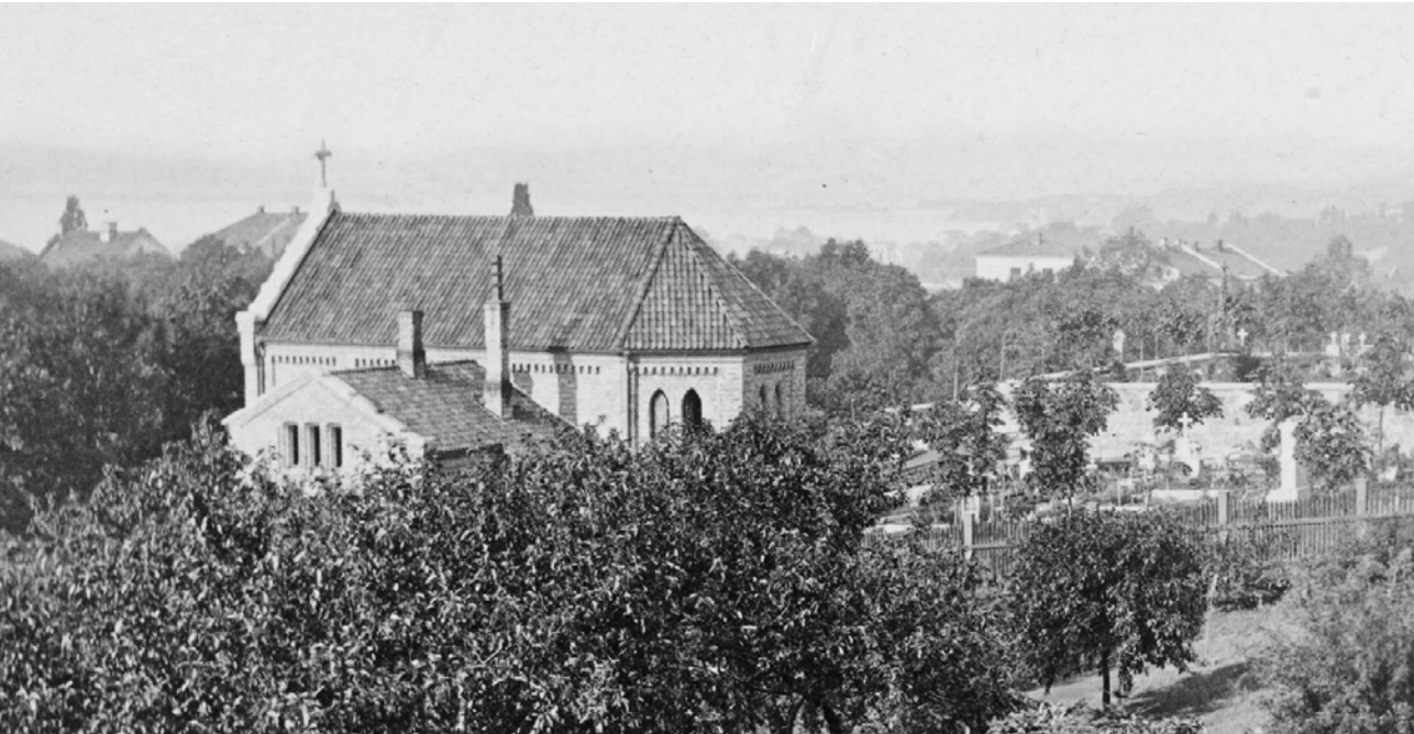
Gravkapellet på Vår Frelser gravlund i Oslo er tegnet av G.A. Bull i 1863 og var et av de tidligste i landet. Utsnitt av et fotografi fra ca. 1870 som viser hvordan kapellet var før det ble utvidet nordover.