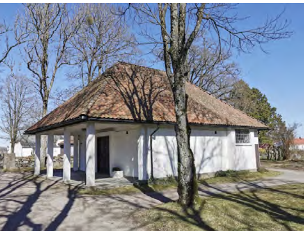
Borre gravkapell (t.v.) sto ferdig i 1930, 10 år etter Skogskapellet i Stockholm som sees på bildet t. h.