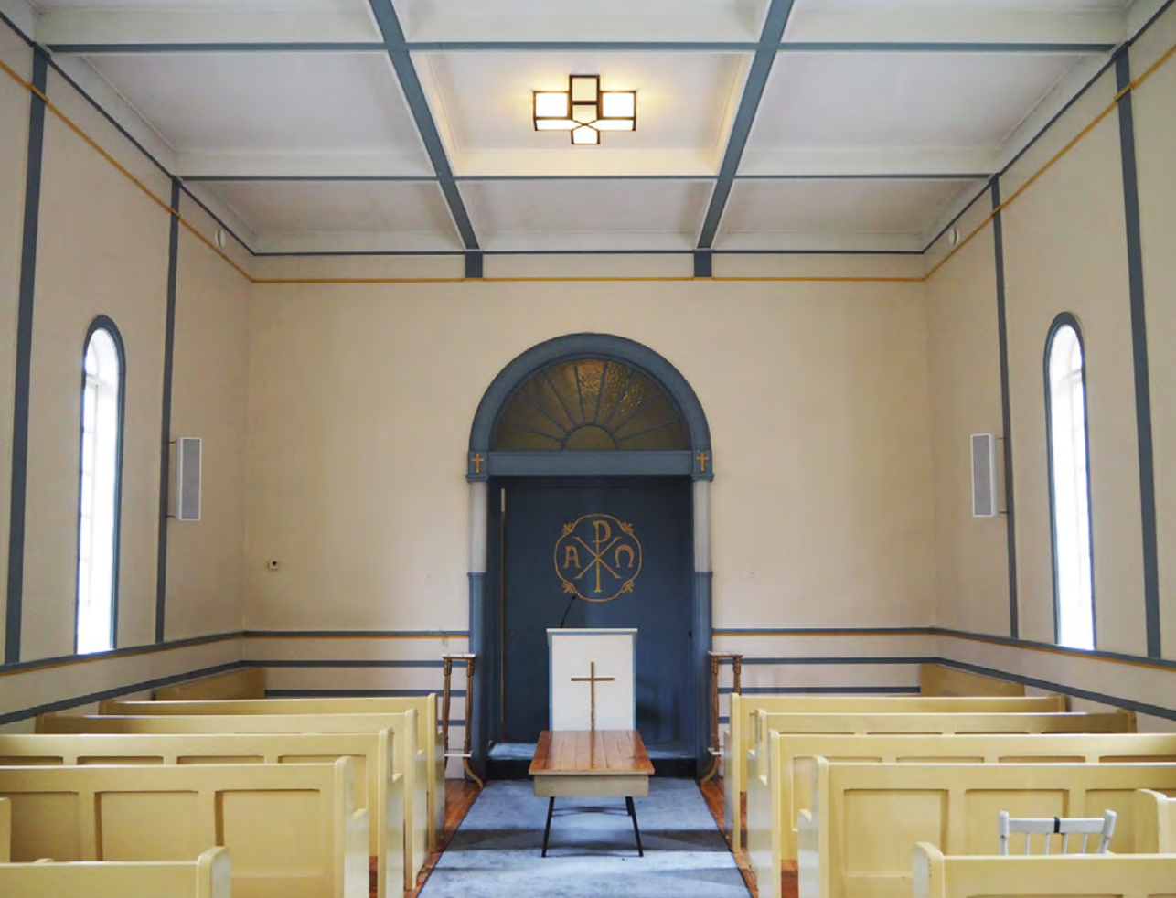
Sundslia gravkapell i Flekkefjord.