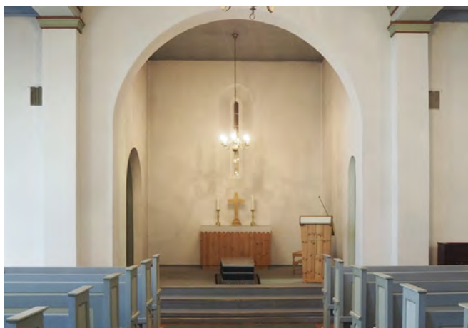
Fotografene viser den store kontrasten mellom begravelse og hverdag. T.v. sees interiøret fra en begravelse i Hoff gravkapell 1943. T.h. gravkapellet i dag.