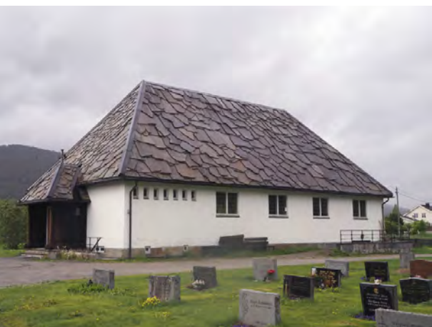
Heddal gravkapell ble tegnet av Blakstad & Munthe-Kaas i forbindelse med at Heddal stavkirke ble restaurert. Under restaureringen fungerte gravkapellet som interimkirke.