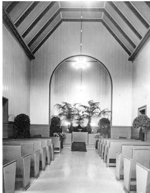
Gravkapellet på Gamlebyen gravlund ble tegnet av J.W. Nordan i 1878. Bildene viser hvordan kapellet så ut før (øverst og nederst t.v.) og etter det i 1934 gjennomgikk en omfattende ombygging (øverst og nederst t.h.), ledet av Harald Aars. Blant annet ble koret flyttet fra syd til nord. Foto nederst til høyre viser hvordan rommet ble pyntet til begravelse med planter langs veggene og store palmer i koret bak lesepulten.