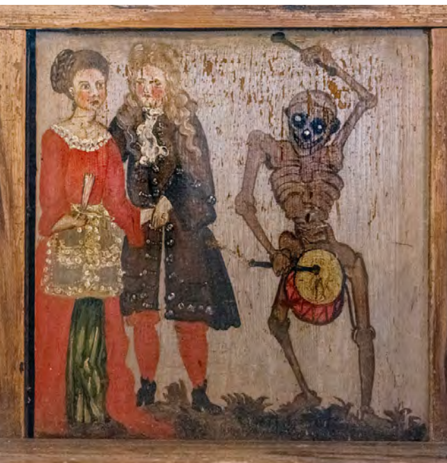
Detalj av brudebenken fra Sauherad kirke.