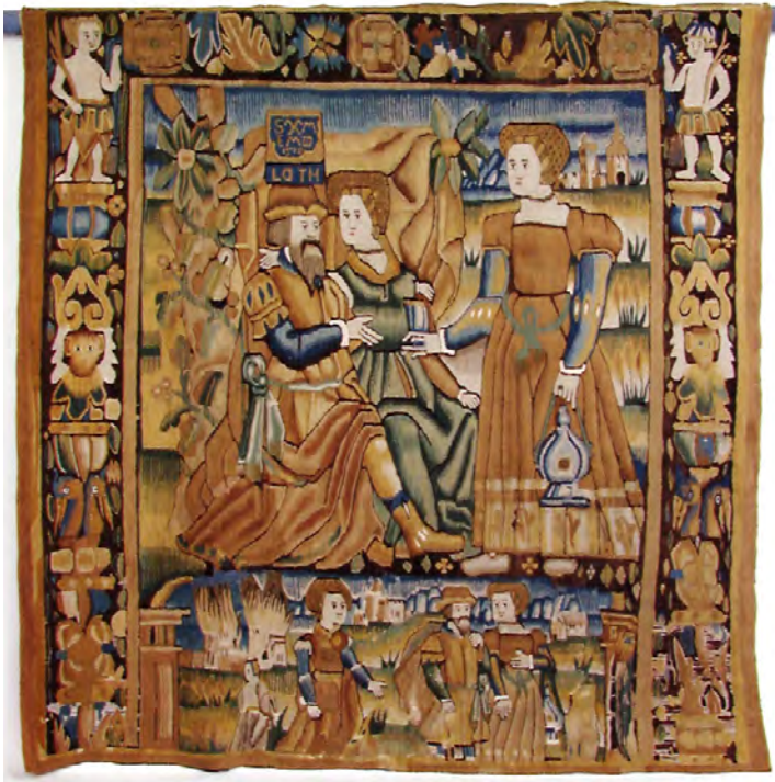
Job og hans to døtre. Flamskvev fra 1579.