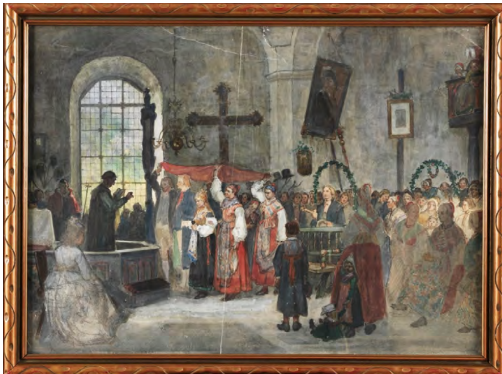
Kyrkbröllop i Floda , akvarell av Carl Gustaf Hellqvist (1851–1890) fra ca. 1880. Bak brudeparet står en grønnmalt brudebenk med røde detaljer i spileverk. Akvarellen viser også hvor lenge den gamle tradisjonen med å holde en pell som himmel over brudeparet holdt seg visse steder.