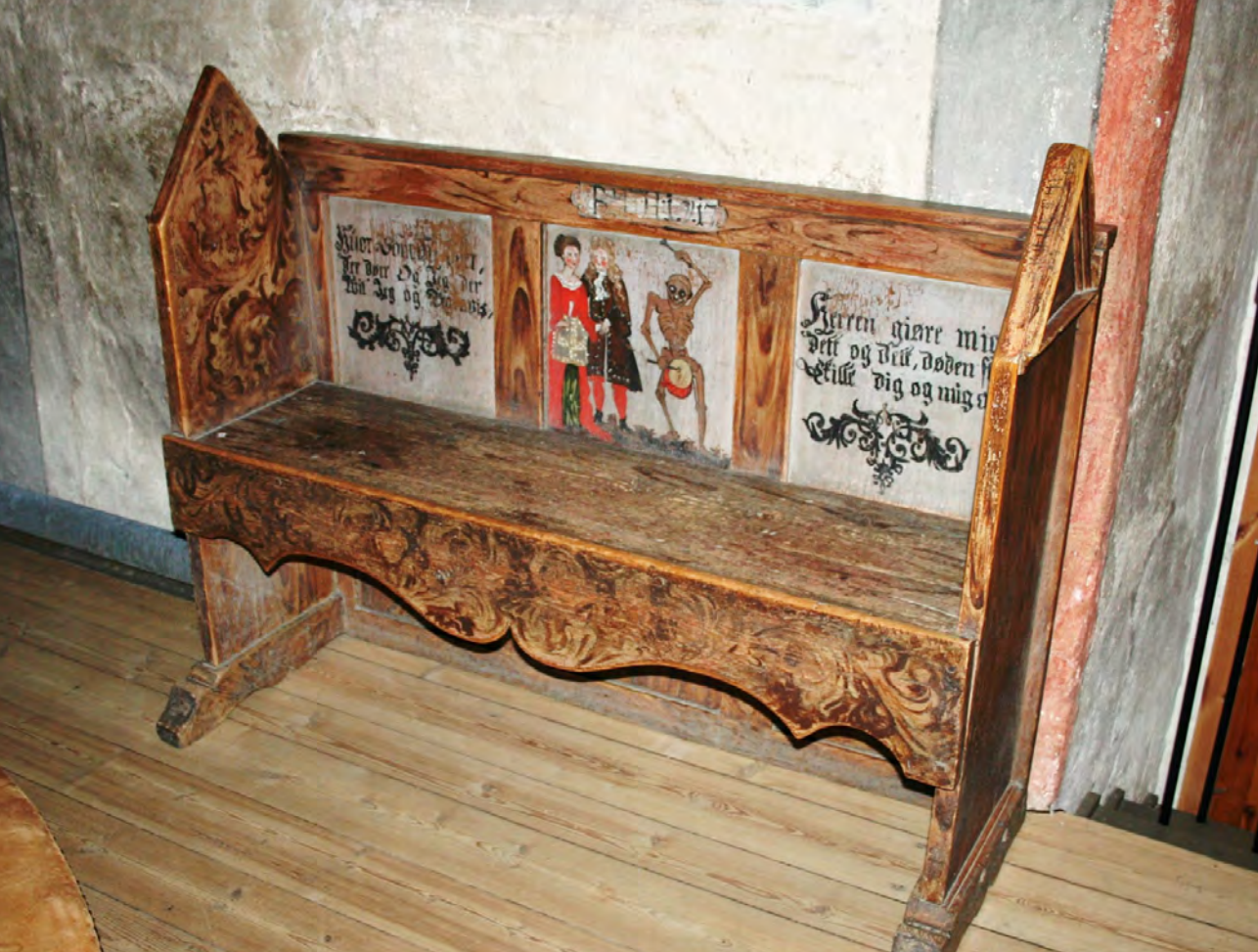
Brudebenk fra Sauherad kirke.