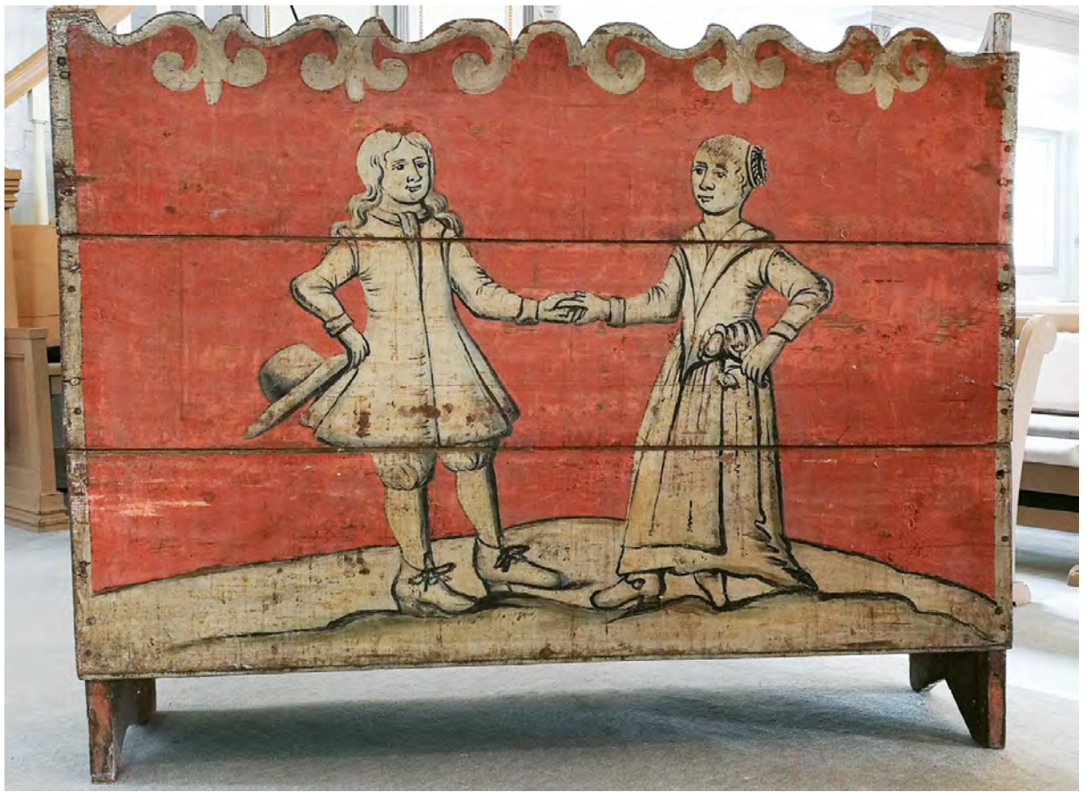
Brudebenk fra Helleland kirke.