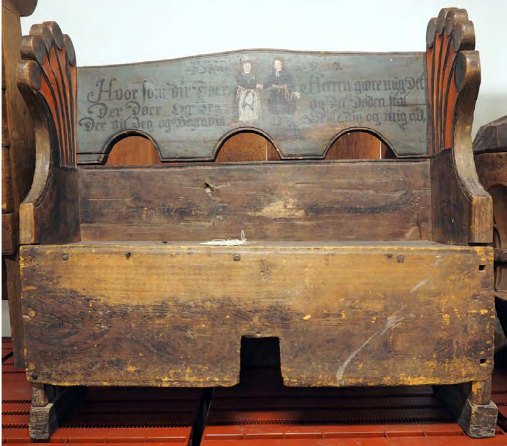
Brudebenk fra Nes i Sauherad (Kulturhistorisk museum).