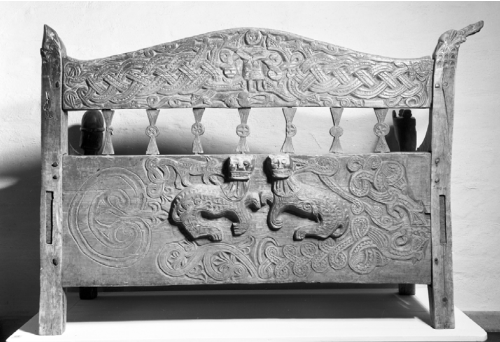
Brudebenk fra Heddal, nå på Norsk Folkemuseum.