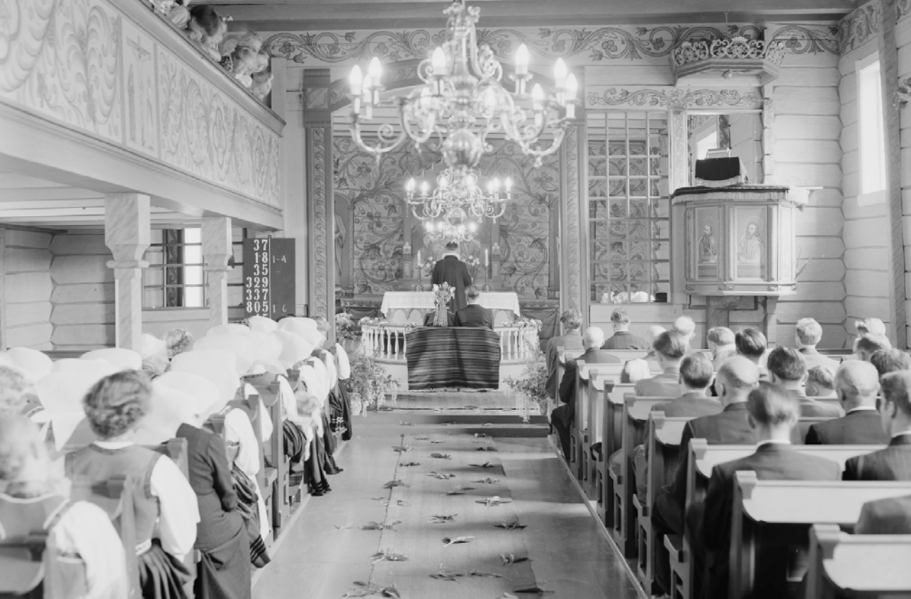
Bilde fra vielse i Granvin kirke i 1953 som viser benkens plassering og hvordan et åkle er hengt over.