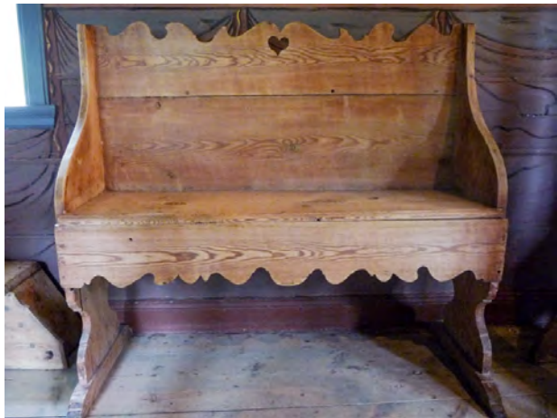
Brudebenker fra Vangen, Undredal og Flåm.