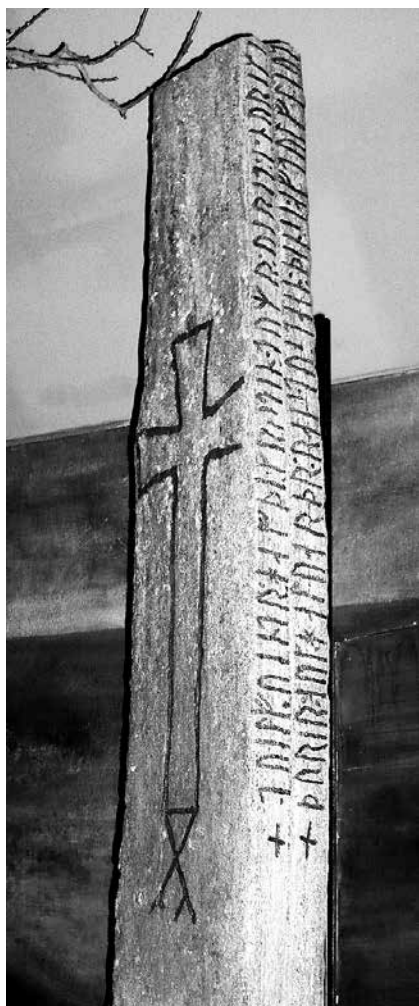
1. La pierre de Kuli, Trondheim, NTNU University Museum.

et documents, manuscrits et enluminures, architecture et arts, monnaies et sceaux. Les sources que j'utiliserai sont pour l'essentiel norvégiennes ou islandaises, considérées comme intégrées au contexte culturel du reste de la Scandinavie et de l'Europe médiévale 6 . Les livres et articles cités ne sont que des exemples parmi d'autres représentant les principaux champs abordés, qui comprennent : les « limites » spatiales et géographiques de la culture intellectuelle ; la textualité, la matérialité et la visualité de la culture intellectuelle, y compris la matérialité de la sainteté ; la culture intellectuelle considérée comme un ensemble de continuités ; les intellectuels et leur identité sociale ; la culture intellectuelle en tant que processus 7 .