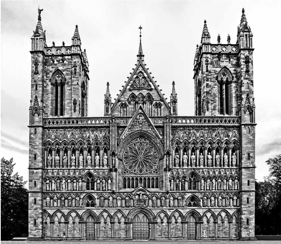
7. Façade occidentale de la cathédrale de Niðarós, Trondheim.

dans la composition des textes 43 et dans les réalisations des arts 44 et de l'architecture 45 . La cathédrale de Niðarós (fig. 6 et 7), qui présente des traits gothiques pan-européens mais fut également construite pour répondre aux besoins d'une communauté locale et à l'instauration du culte voué au saint national, Olav, en fournit un exemple particulièrement riche 46 .