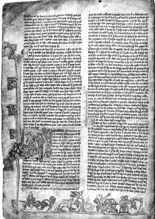
2. Le Miroir du roi , vers 1275, Copenhague, Bergen, Institut Árni Magnússon, AM243 b fol. 24v o .