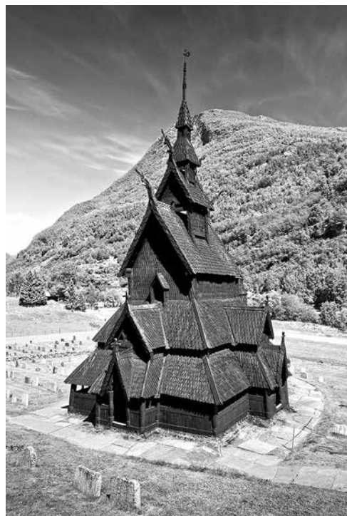
8. Église en bois debout de Borgund, vers 1150-1200, Lærdalen, comté de Sogn og Fjordane, Norvège.

En Islande et en Norvège, la langue vernaculaire jouait déjà, avant l'introduction de la culture latine du livre, un rôle important, littéraire et poétique mais aussi juridique. C'est dans cette langue qu'on enseignait et qu'on apprenait les lois, par les récits notamment de cas célèbres, par l'histoire et la formation religieuse 59 . À la différence de leurs homologues danois et suédois, les intellectuels norvégiens et islandais embrassèrent et reproduisirent, en y apportant leurs innovations, la culture latine mais ne produisirent guère d'œuvres originales en latin. Si la culture textuelle latine existait bel et bien, les érudits eurent tendance à lui donner moins d'importance qu'aux genres nordiques canoniques. En outre, les manuscrits latins furent dépréciés lors de la Réforme, quoique beaucoup soient encore