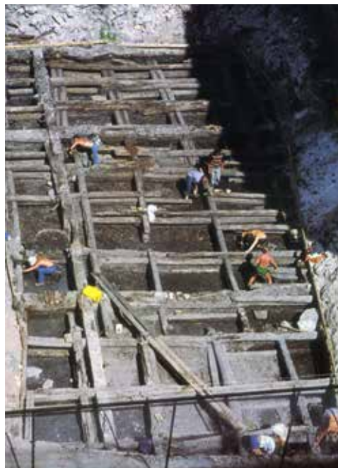
Fig. 1. Bolverkskar under utgravning i Revierstredet 5, Oslo i 1977. Bygget i forbindelse med utfylling på grunt vann i Christiania på midten av 1600-tallet.

Fredningsdifferensieringen har resultert i den pågående desimeringen av landets underjordisk arkeologiske arkiv av materielle levninger etter samfunnsutviklinger de siste 500 år. Dette ledsages av en mangel på akademisk kunnskapsproduksjon, og underutnyttelsen av en verdifull kilde til verdiskaping. Disse arkeologiske levningene utgjør nemlig en stor del av den materielle kulturarven etterlatt av flere generasjoner av mennesker som bodde i norske byer og bygder i overgangen til modernitet. De har imidlertid sjelden blitt benyttet som kunnskapskilder i den nasjonale historiske diskursen, og følgelig har de bidratt lite til vår forståelse av Norges nære fortid. Samfunnsutviklinger i Norge etter reformasjonen har blitt utforsket nesten utelukkende ved bruk av historiske, arkitektoniske og etnologiske kilder. Bygninger og annen materiell kultur er bevart fra denne perioden, men arkeologiens spesielle bidrag, nemlig innsikten som den gir i mangfoldige materielle dimensjoner av