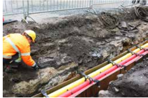
Fig. 4. Arkeologisk overvåking av graving i Bergmannsgata, Røros 2013. Bildet viser kulturlag fra 1600- og 1700-tallet under dagens gate.

I tillegg til NIKU, har Norsk Maritimt Museet, Byantikvaren i Oslo og flere fylkeskommuner undersøkt et økende antall etterreformatoriske arkeologiske forekomster. Følgende eksempler viser til et bredt spekter undersøkte fenomener og kontekstuelle sammenhenger: en kongelig herregård, Eidsvollsbygningen, landlige gårder og husmannsplasser, urbane tomter og hus, gater og torg, kirkegårder, en gruveby (fig. 4), en mindre havneby, festninger i urbane og landlige sammenhenger, krigsminner, en konsentrasjonsleir, havner og kaianlegg, håndverk og industri, slagmarker, samt avfall og gjenstander etterlatt på kunstneren Edvard Munchs landsted. 37