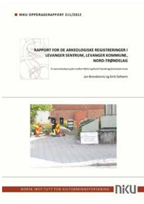
Fig. 11 Omslaget til NIKUs rapport for arkeologiske undersøkelser i Levanger hvor det ble registrert kulturlag fra både middelalderen og nyere tid.

arkeologiske levningene. De arkeologiske kulturlagenes verneverdi anses med andre ord å ligge i at de utgjør en del av et kollektivt kildemateriale om en bestemt historisk utvikling i tid og rom (fig. 11). 52