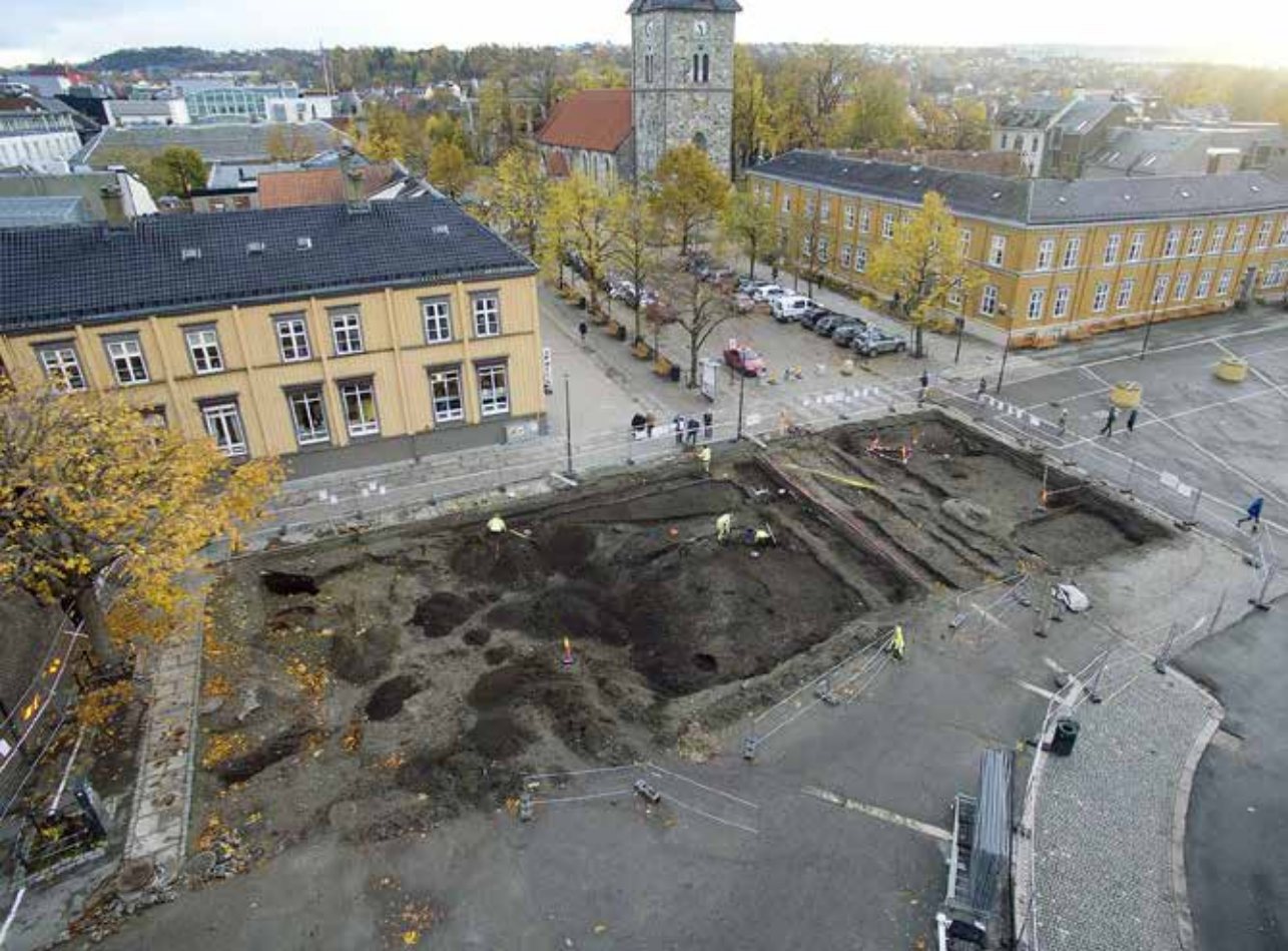
Fig. 6 Torvet i Trondheim. Utgravningen av nordøstre kvadrant i 2015.