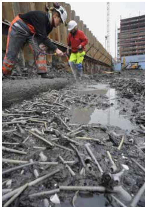
Fig. 9 Barcode prosjektet i Bjørvika, Oslo 2008-2009. Utgravningen av mer enn 1100 kritt-piper som har stått lagret på en brygge som brant i den store bybrannen i 1624. Det største funnet av tidlig 1600-talls piper vi hittil kjenner til.