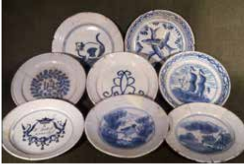
Fig. 10 En samling dekorerte Delft-tallerkener fra sen 1600-tallet/tidlig 1700-tallet som ble funnet i en avfallsbinge på B-felt (TA1971/2) i Trondheim.