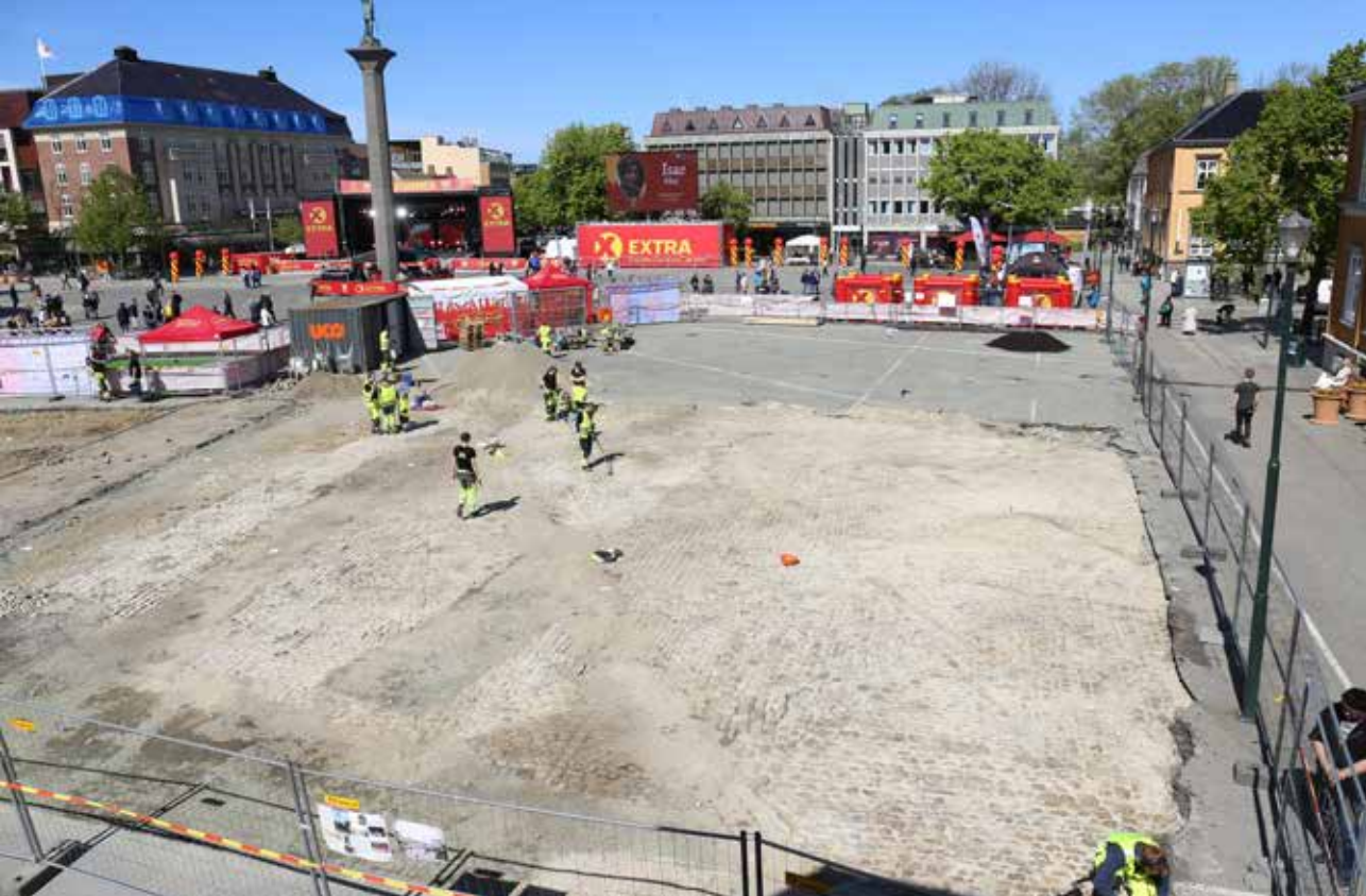
Torvet i Trondheim. Utgravningen av sørøstre kvadrant i 2016. Steinbrolegning fra ca 1870 avdekket etter fjerning av det moderne asfaltdekke.