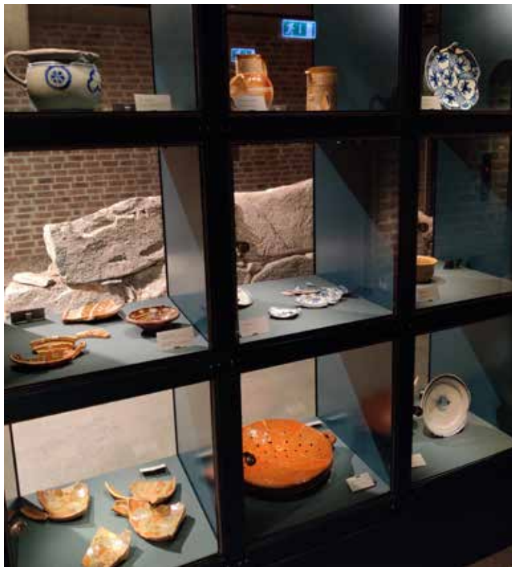
Fig. 3 Et utvalg dagligdagse gjenstander som ble brukt i husholdningene til proviantforvalterne som bodde i Kongsgården i Trondheim på 1700-tallet. Funnet i forbindelse med utgravningene i Erkebispegården og nå utstilt på Museet i Erkebispegården.