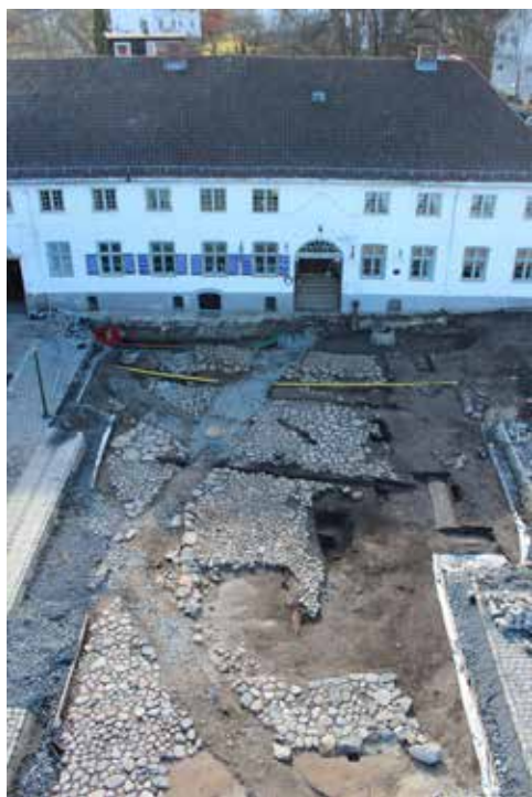
Fig. 7 Son i Østfold. Arkeologiske funn under torget inkludert en oppbygd steinbrolagt flate og steinbrolagte gater som sannsynligvis er fra slutten av 1600-tallet.