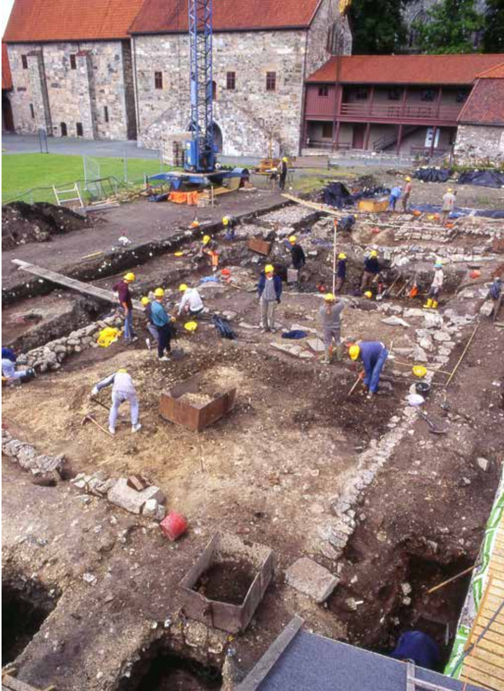
Fig. 2 Fundamentene til proviantforvalterens første bolig under utgravning i Erkebisppegården - den etterreformatoriske Kongsgården - i 1992.