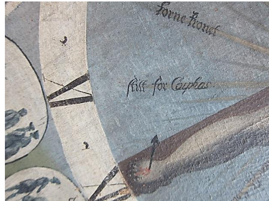
Pasjonsviser, Høyjord kirke. Tall XI: Stilt for Caiphaz. Her har maleren gjort en feil, alle andre versjoner har i denne medaljongen avbildet scenen Stilt for Herodes.