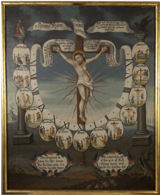
Pasjonsviser, Tranby kirke.

Dato for tilstandsregistrering: 14.2.2014