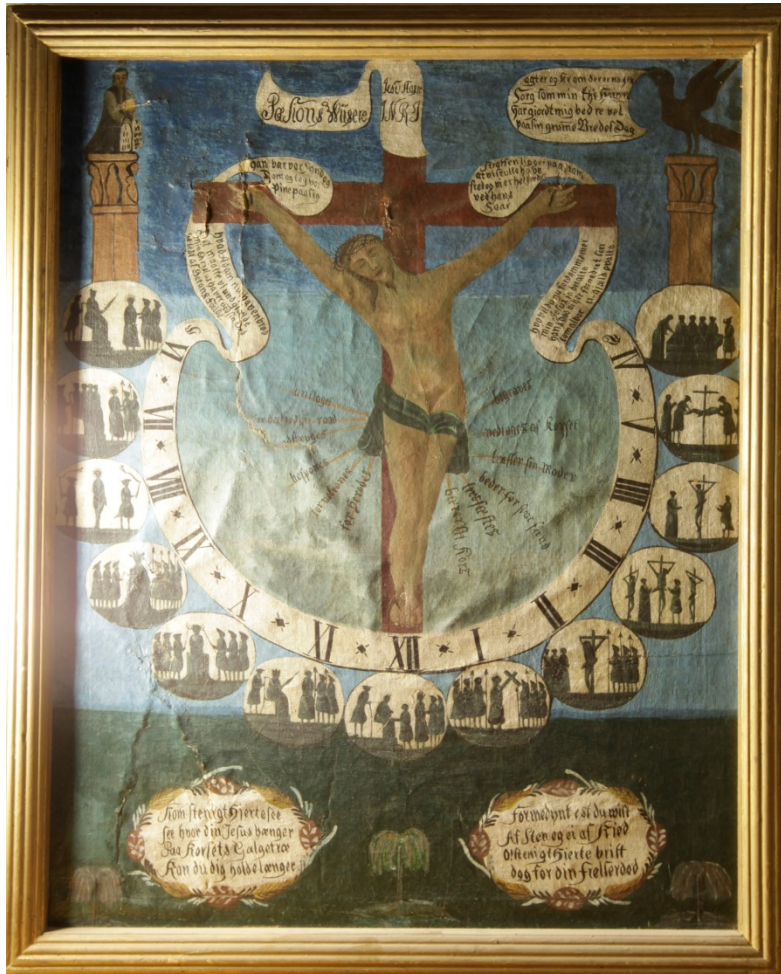
Pasjonsviser fra Drøbak kirke. Sidelys viser deformasjonene i lerretet grunnet store flenger som er reparert.