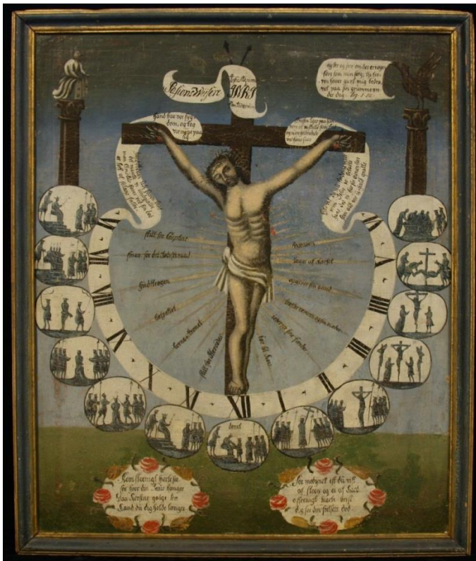
Pasjonsviser, Strandebarm kirke.

Dato for tilstandsregistrering: 26.3.2015