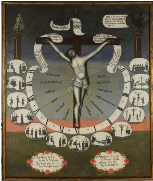
Pasjonsviser, Langestrand kirke.

Dato for tilstandsregistrering: 14.2.2014