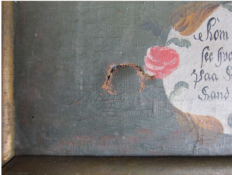
Pasjonsviser, Skånevik kirke: Hull i lerretet, nedre venstre hjørne.