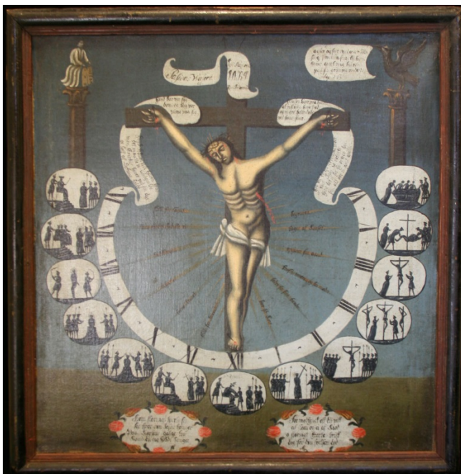
Pasjonsviser, Vassenden kirke

Dato for tilstandsregistrering: 26.10.2015