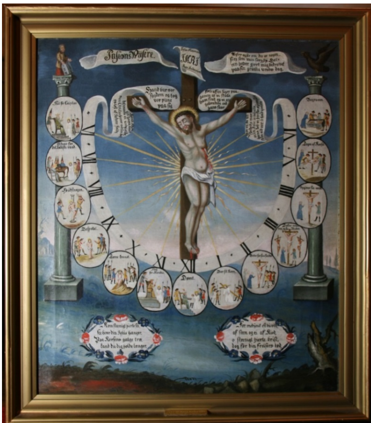
Pasjonsviser, Haug kirke.

Dato for tilstandsregistrering: 20.10.2015