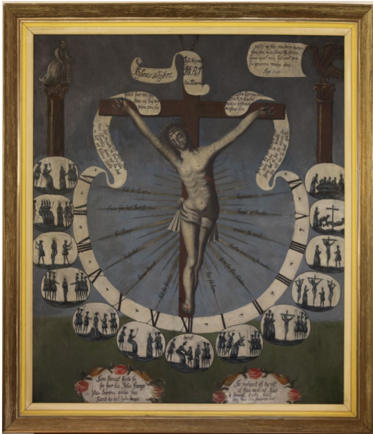
Pasjonsviser, Asak kirke.

Dato for tilstandsregistrering: 13.2.2014