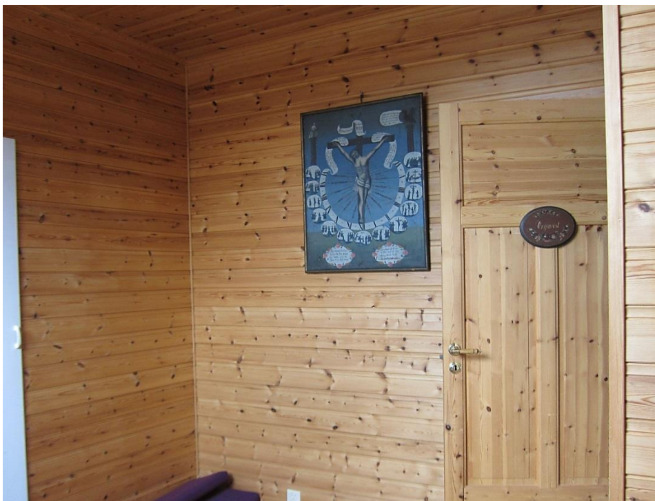
Pasjonsviser i Skånevik kirke, plassert i organistens kontor i 2. etasje. Maleriet er ikke synlig for kirkens menighet.