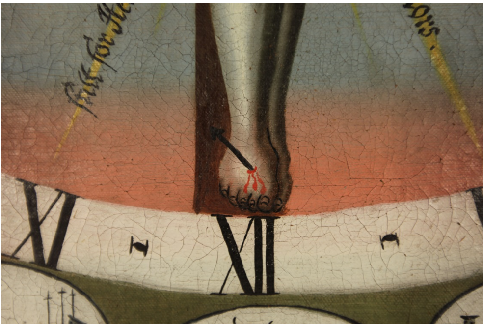
Pasjonsviser, Langestrand kirke. Detalj av Kristus' føtter. Her sees fine strekdetaljer på tærne, samt en modellert overgang fra lyserød til lyseblå i bakgrunnen.