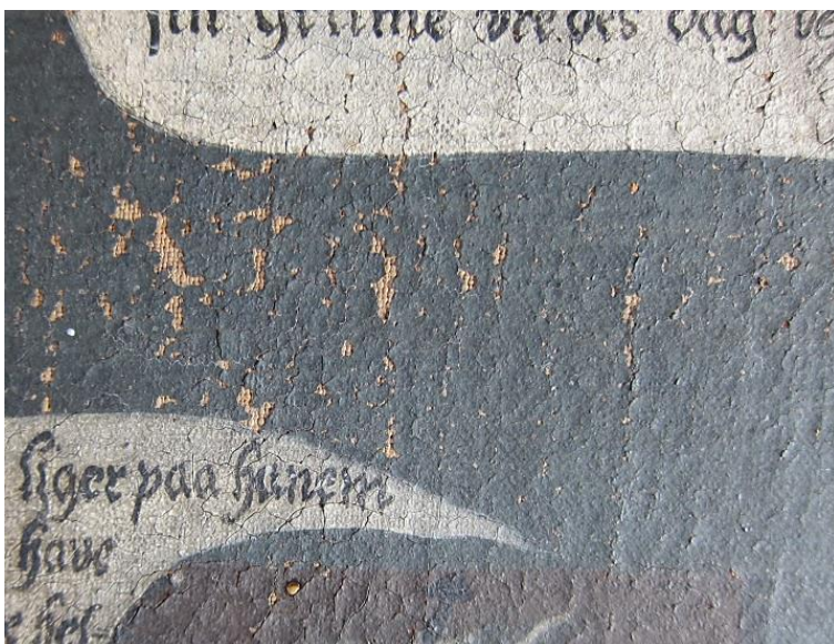
Pasjonsviser, Høyjord kirke: Detaljopptak. Malingutfall i det øvre, høyre hjørnet.