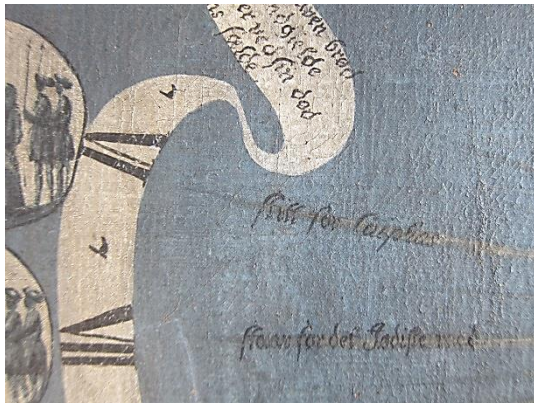
Pasjonsviser, Høyjord kirke. Tall VI: Stilt for Caiphaz: dette er likt alle andre Pasjonsvisere (bortsett fra Drøbak: Anklaget)