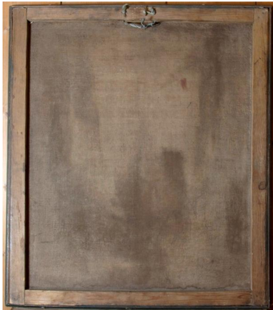
Bakside av Pasjonsviser fra Høyjord kirke. Tauet som maleriet henger i, ser ut til å ha røket flere ganger.