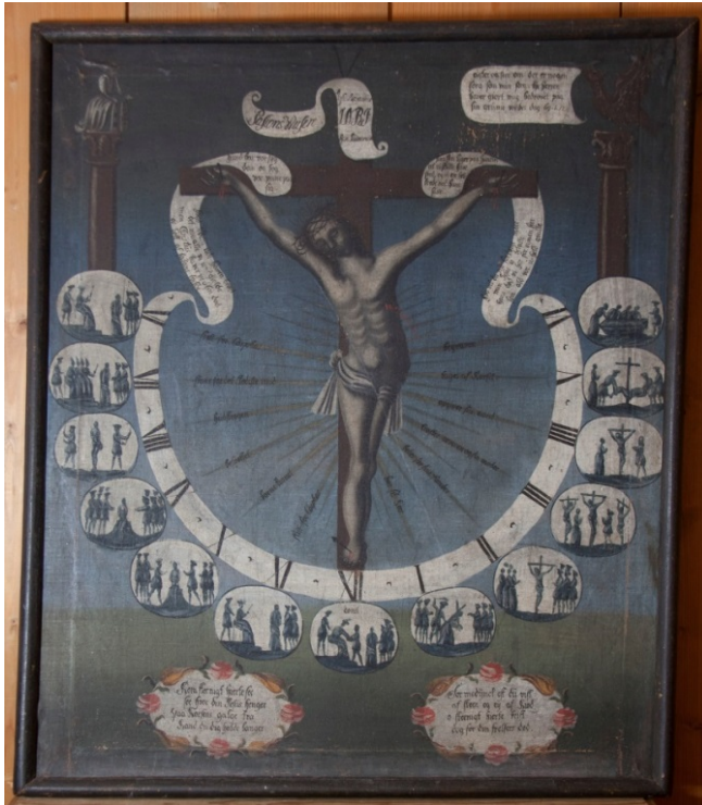
Pasjonsviser, Høyjord stavkirke.

Tidligere tilstandsregistrert av NIKU i 2006, med tilstandskategori 1 9 . I 2006 lød registreringen slik: Maleri «Jesu lidelseshistorie». Henger i sakristi. 1700-tallet. Olje på lerret. Udublert, original oppspenning. Har trolig vært rensset, ingen retusjer (?). Trenger nytt oppheng. Fiber etter vaskeklut. Anbefaling: Bruk antistatisk støvkost på kunst og dekor, og kun på objekter som er i god stand. [...] Maleriene i sakristiet trenger nytt oppheng. Utføres av malerikonservator [...].