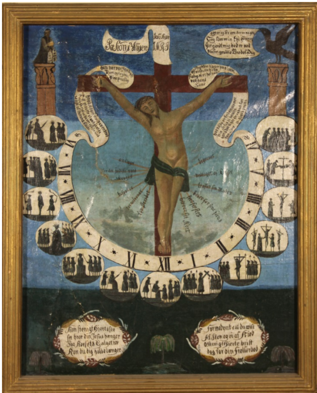
Pasjonsviser, Drøbak kirke.

Dato for tilstandsregistrering: 13.2.2014