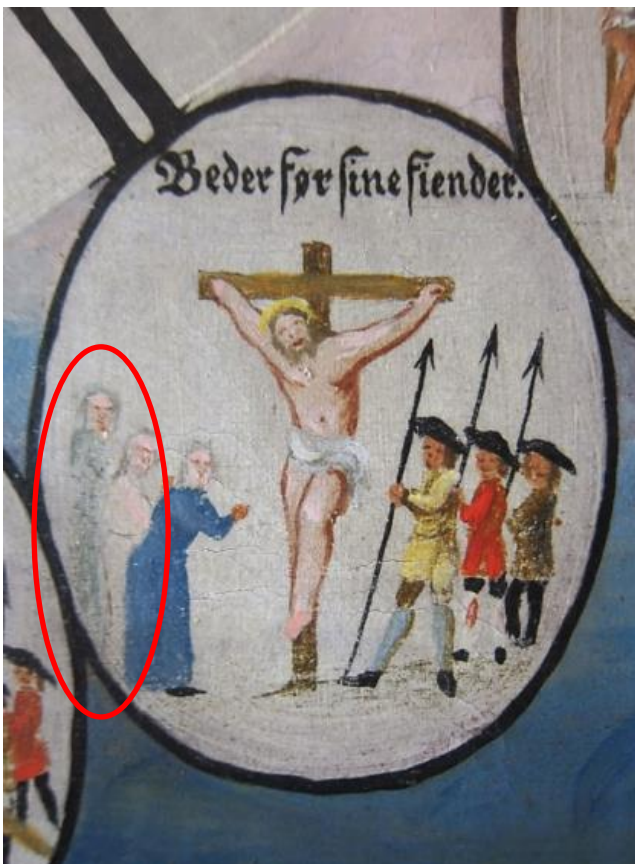
Pasjonsviser, Haug kirke: Spor av overrensing i figurer i medaljonger: spesielt oker og blågrå farger på klær i medaljonger har synlig slitasje.