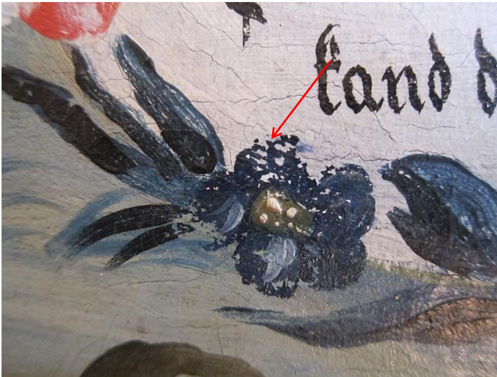
Pasjonsviser, Haug kirke: Detalj av ovalt skriftfelt i nedre, venstre hjørne. Det blå malinglaget har mistet heft til underlaget.