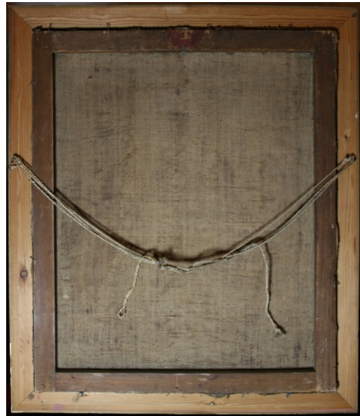
Bakside av Pasjonsviser fra Haug kirke. Sprøtt og slitt oppheng.