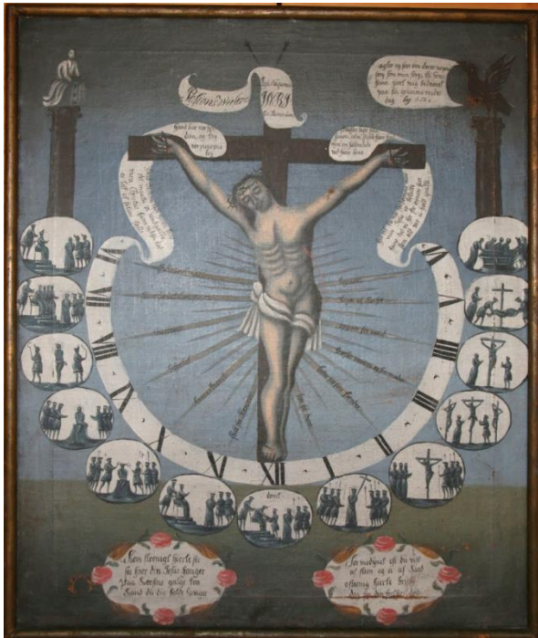
Pasjonsviser, Skånevik kirke.

Dato for tilstandsregistrering: 27.3.2015