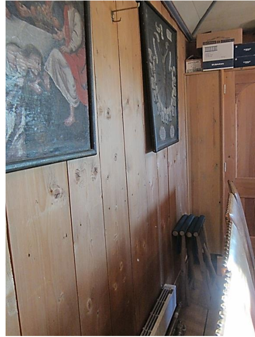
Pasjonsviser i Høyjord stavkirke, plassert i sakristiet rett over en stråleovn. Temperaturen holder kontinuerlig ca 23 °C og har forårsaket skader på maleriet.