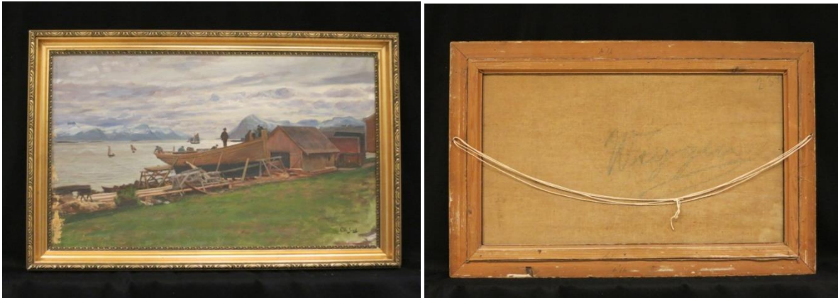
Ill 1: Maleri med dagmotiv før behandling