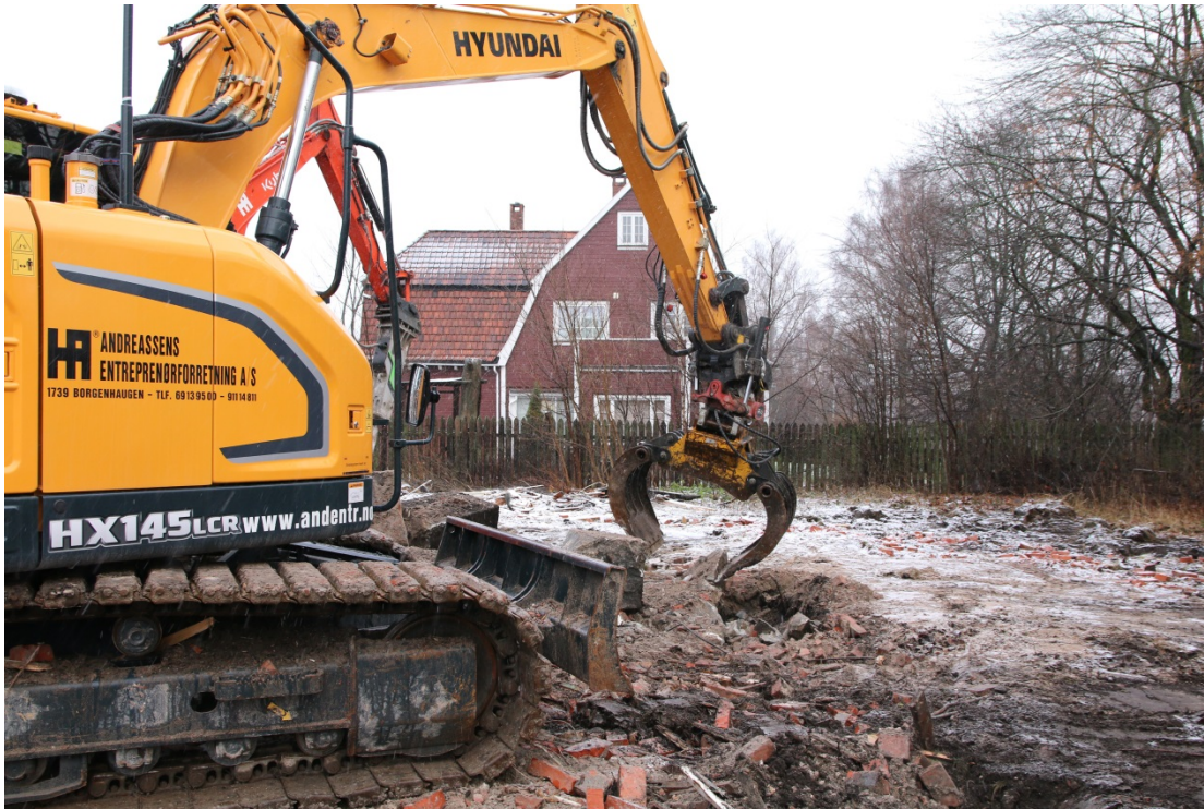
Figur 2: Fjerning av grunnmursteiner. Sett mot nord. Foto-nr: Cf53329_NIKU_0007.

etter kjelleren skulle da bli værende under bakken. Dette betydde at den arkeologiske overvåkingen ble langt mindre omfattende enn prosjektert. Det ble kun fjernet stein fra hjørnene av huset i SV og SØ, og det ble gravd to små grøfter for fjerne steinene her (fig. 2 - 4). Grøftene ble ca. 50-70 cm dype og begge steder det ble det kun observert matjord og rivningsmasser. Steiner i grunnmuren dukket opp enkelte steder under de fjernede steinene/i bunnen av grøfta.