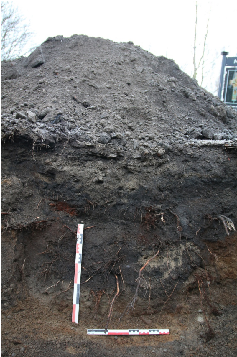
Figur 7: Ferdig gravd for VA, østlig profil. Sett mot øst. Foto-nr: Cf53329_NIKU_0025.

K7 Naturbakke fra 45-75 cm under terreng.