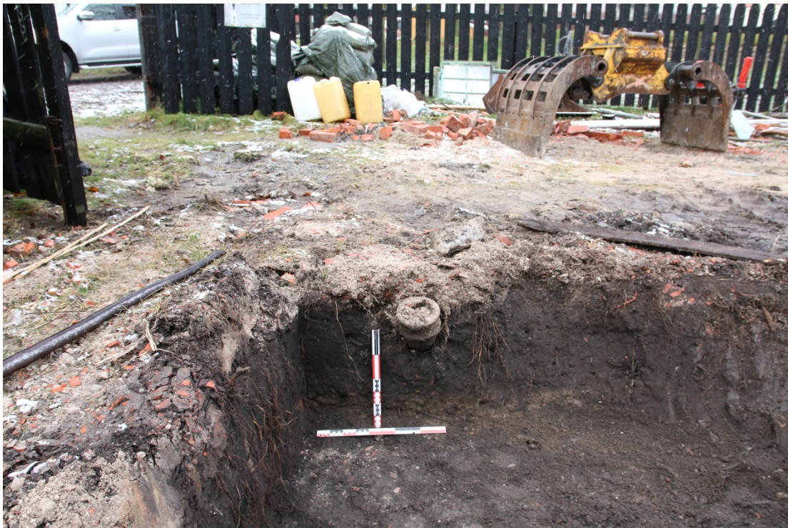
Figur 3: Ferdig gravd, SV-hjørnet profil. Sett mot vest. Foto-nr: Cf53329_NIKU_0008.