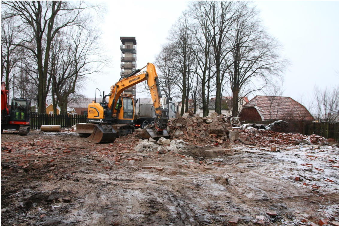
Figur 1: Oversikt ved start, fjerning av rivningsmasser. Sett mot vest. Foto-nr: Cf53329_NIKU_0003.

Østfoldmuseene ønsket å rive Borregaardsveien 5, samt garasje og gjerder inne på museumsområdet til Borgarsyssel. Bygget hadde full kjeller. Det var krypkjeller under glassverandaen og det var to store trapper der som man ikke visste hvordan var fundamentert. Bygningene kunne rives, men da man skulle fjerne nedre del av grunnmur og trapper ønsket Riksantikvaren at det var arkeolog tilstede. Også del av tiltaket var graving av en grøft ned til vannledningen for å stoppe denne.