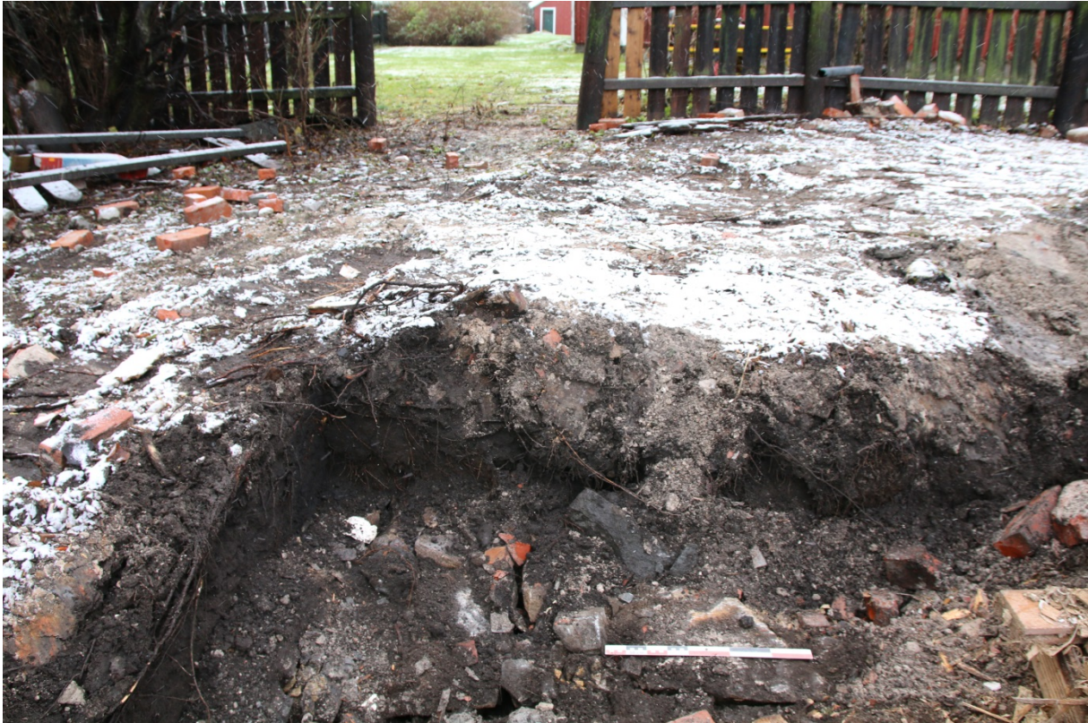
Figur 4: SØ-hjørnet, ferdig gravd. Sett mot sør.