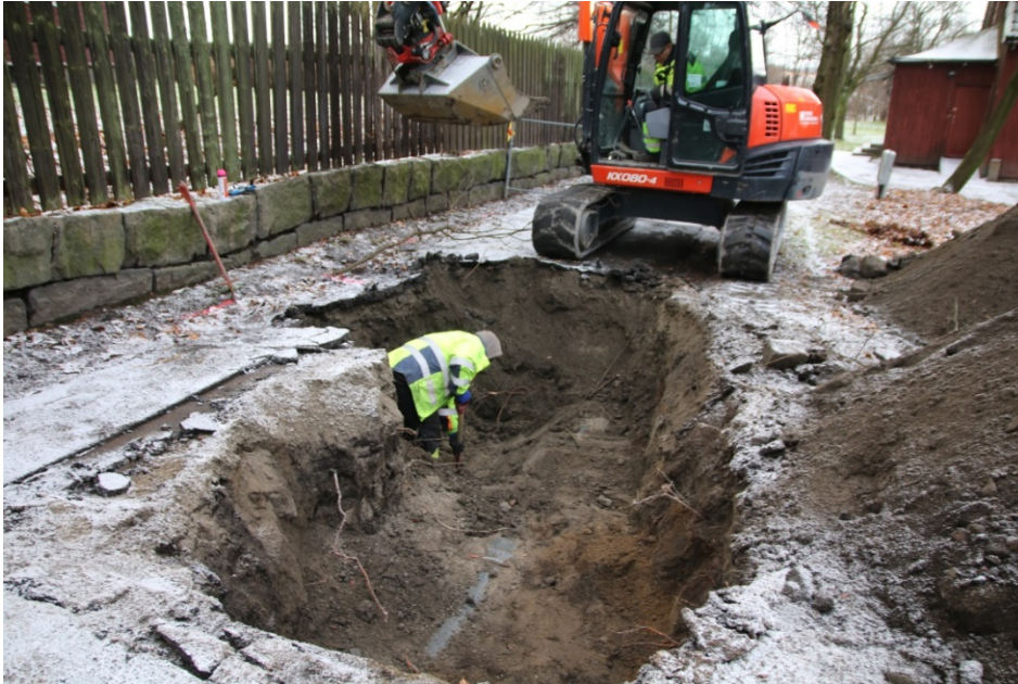
Figur 5: Arbeidsbilde utvidelse VA. Sett mot nord-vest. Foto-nr: Cf53329_NIKU_0032.