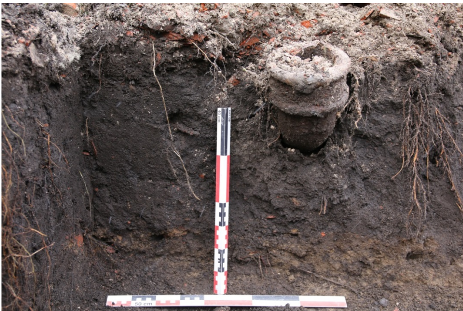
Figur 6: Ferdig gravd, SV-hjørnet profil. Sett mot vest. Foto-nr: Cf53329_NIKU_0010.

K3 Gulgrå sand. Fra 50-70 cm under terreng. Del av planering for kjelleren.