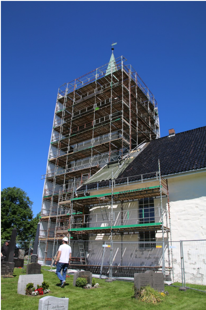
Figur 1: Kråkstad kirke var under restaurering. Sett mot NNV. Foto-nr: Cf53303_NIKU_0022.

Tiltakshaver ønsket å grave for å drenere på sydsiden av middelalderkirken. Det var planlagt å grave en 6 meter lang grøft i en bredde av ca. 90 cm og med en dybde på ca. 60 cm fra det sørøstre hjørnet av kirkeskipet. Dybden ville avhenge av om når man traff murens bankett eller fjell. Videre skulle det graves en grøft fra det sørøstre hjørnet på korveggen og inntil 3 meter vestover. Det var også planlagt å grave langsmed sakristiet.