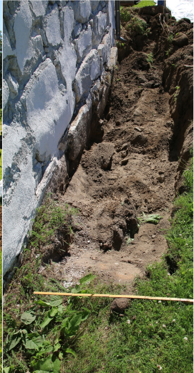
Figur 4: Grøft langsmed skipet ferdig gravd, sett mot Ø. Foto-nr: Cf53303_NIKU_0012.

Det ble kun observert masser som ga preg av å være gravd relativt nylig. Massene langsmed koret var lignende, men her ble det observert flere og større steiner. Grøfta her ble forsøkt påstartet et stykke lenger inn mot skipet enn hva som opprinnelige var prosjektert, men det var svært mye stein på