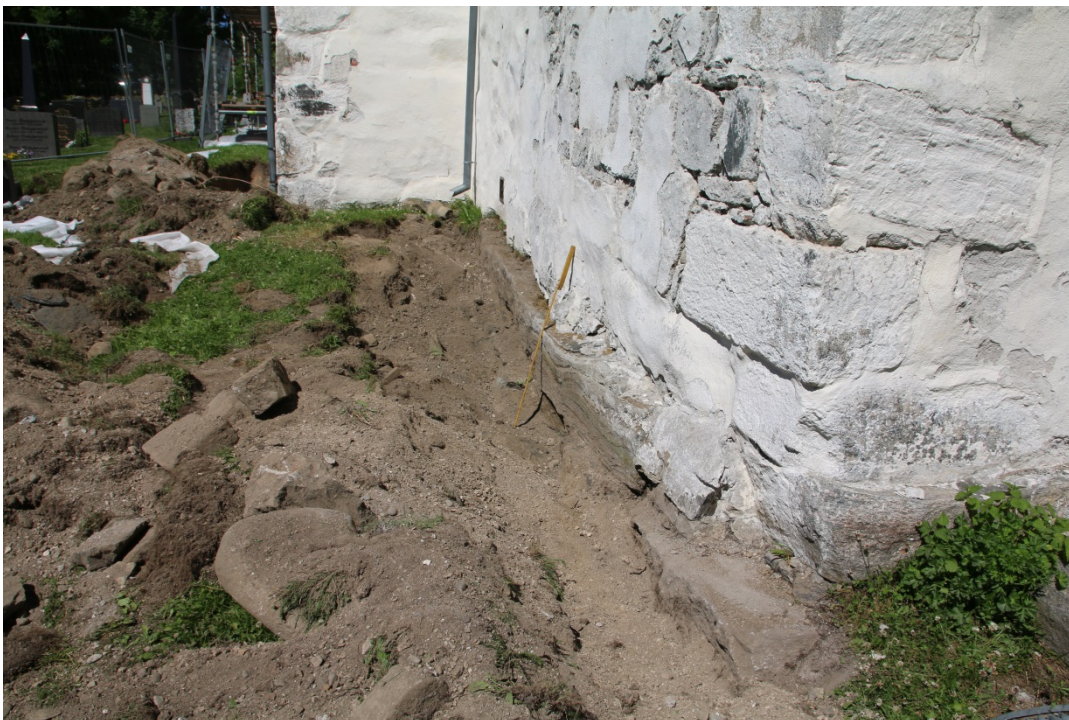
Figur 6: Ferdig gravd grøft langsmed koret. Sett mot V. Foto-nr: Cf53303_NIKU_0019.