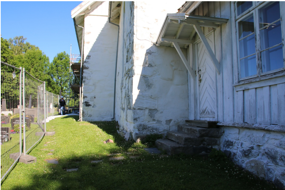
Figur 2: Oversikt før start, sakristiet lengst til høyre, deretter koret og kirkeskipet lengst bak. Sett mot V. Foto-nr: Cf53303_NIKU_0004.

Det har blitt foretatt arkeologisk overvåking av gravearbeider av NIKU på østsiden av kirken på 2000-tallet, men det ble dessverre ikke utarbeidet noen rapport fra denne undersøkelsen. Det er imidlertid ikke kjent at det ble funnet noen automatisk fredete kulturminner ved undersøkelse. (pers. komm. Jan Brendalsmo v/NIKU 19.6.2017).