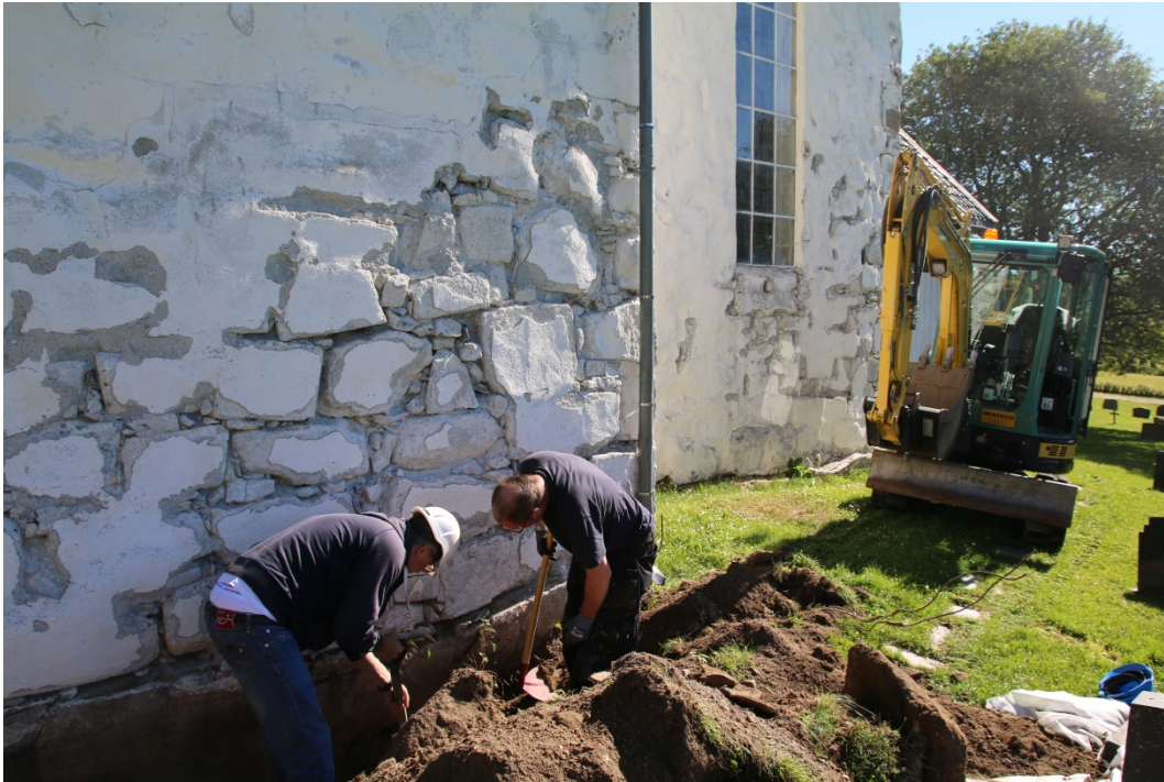
Figur 5: Arbeidsbilde, håndgraving langsmed skipet. Sett mot NØ. Foto-nr: Cf53303_NIKU_0008.

stedet og det var derfor ikke mulig å grave der. Grøfta ble derfor lagt lengre øst, ca. 2,5 m fra veggen/hjørnet på kirkeskipet. Da grøfta for koret var ferdiggravd ble Stenseth kontaktet og kom på befarings for å undersøke murverket og videre arbeid med restaureringen av denne. Det ble da klart at det var tilstrekkelig med de to grøftene, og at det ikke var behov for å grave langsmed sakristiet. Gravearbeidet ble derfor avsluttet.