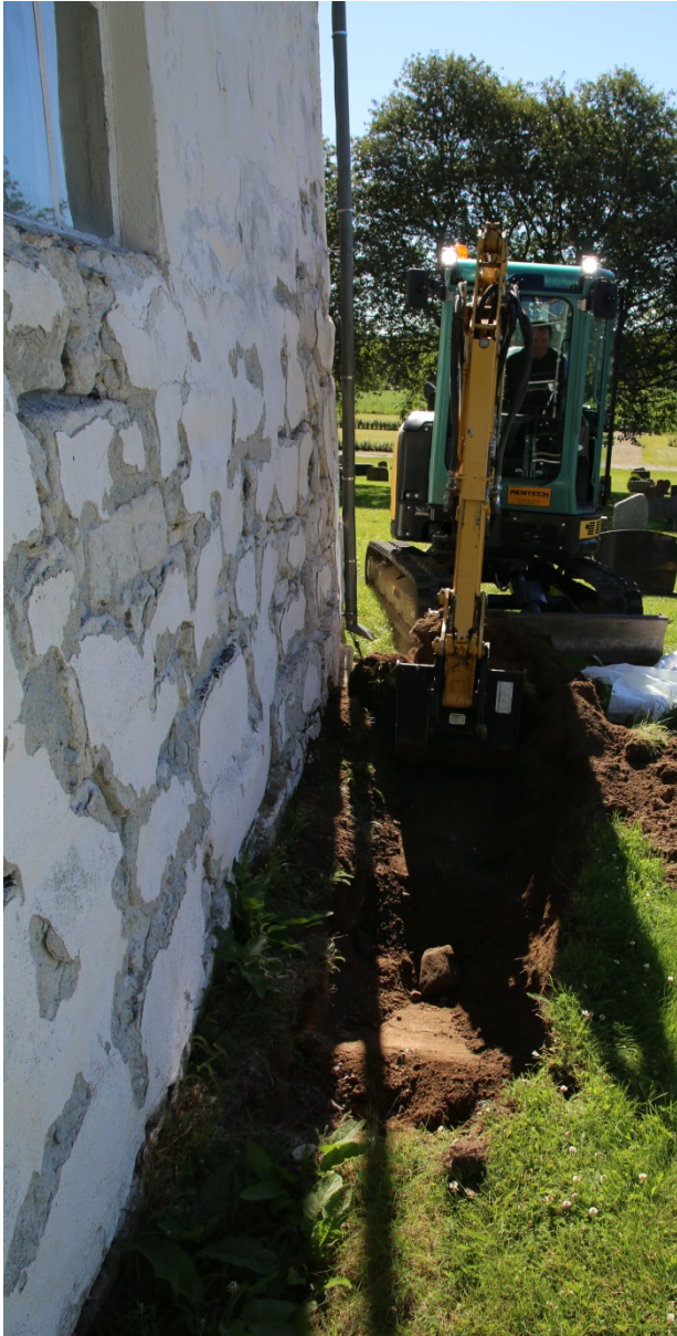
Figur 3: Graving langsmed skipet, sett mot Ø. Foto-nr: Cf53303_NIKU_0007.

Gravearbeidet fikk en noe forsinket oppstart enn avtalt med arkeolog da gravemaskinen måtte bli hentet utenfra, noe som tok litt tid. Da gravingen kom i gang gikk imidlertid arbeidet raskt og effektivt uten hindringer. Gravingen startet langsmed kirkeskipet, og det ble gravd en grøft østover til hjørnet av skipet. Rett inntil murveggen ble det håndgravd for ikke å skade muren. Det ble gravd ned slik at fundamentene til muren kom til syne. Deler av fjellet ble også avdekket, ca. 40 cm under terreng, men toppen av fjellet varierte og fjell var ikke synlig i hele grøfta.