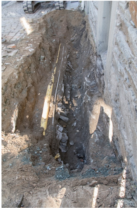
Figur 3. Bilde av grøften langs veggen, med hvelvkjellerens mur til høyre. Tatt mot nord. Da62349_NIKU_01.

har blitt utvidet flere ganger, senest etter brann i 1841 (Berg 1955), noe som kan være grunne til at hvelvkjelleren ligger ut i dagens veiløp. Grøften som ble gravd langs veggen var ca. 1,40 m bred og 6,0 m lang, og hadde en dybde på 1,30 m (fig.3 - 4).