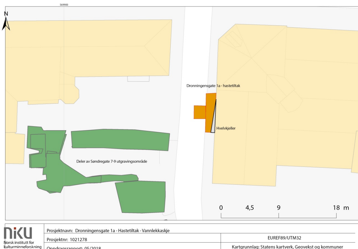
Figur 2. Detaljkart dom viser tiltaksområdet v. Dronningensgate 1a/Krabugata.