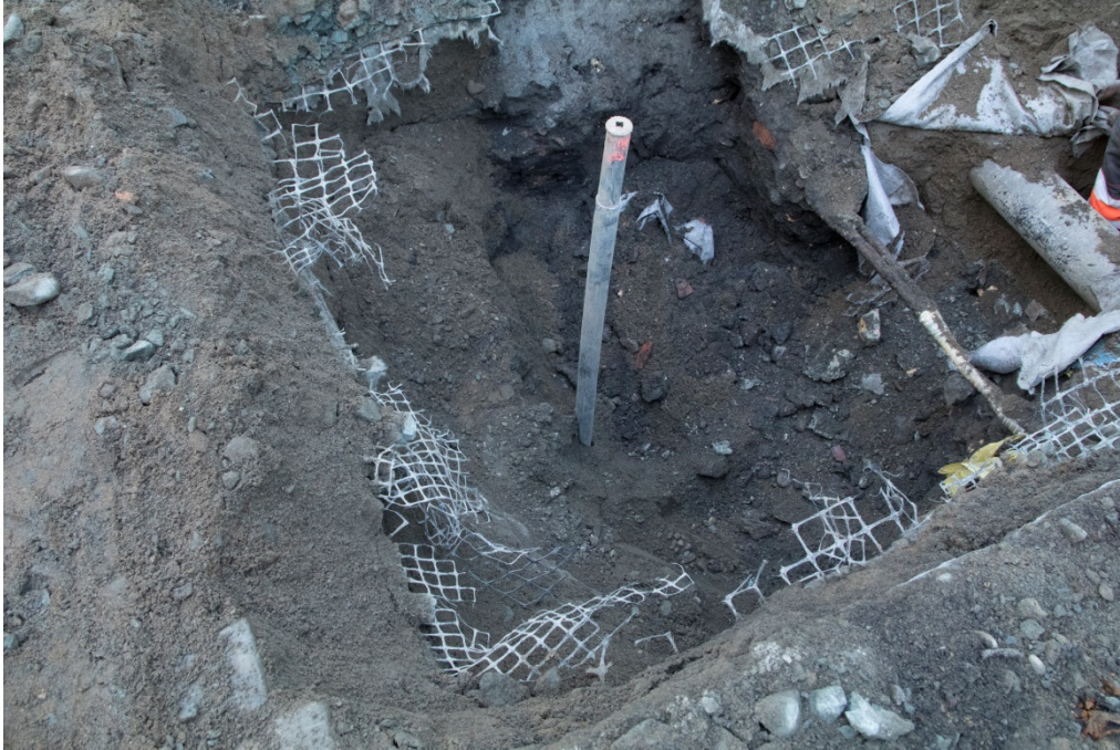
Figur 5. Bilde av grøften ut i veibanen som inneholdt kun omrotede masser. Tatt mot nord. Da62349_NIKU_06.

Det ble deretter gravd en mindre grop ut i veibanen fra vegg-grøften, for å nå selve vannrøret. Denne grøften var ca. 2,0 x 2,0 m og var 1,60 m dyp. Det var også fylt med omrotede masser, og det var ingen tegn på intakte fredede kulturlag, heller ikke i grøfteprofilene (fig. 2 og 4).