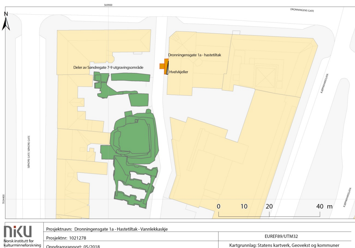
Figur 1. Oversiktskart som viser tiltaksområdet v. Dronningensgate 1a/Krambugata i oransje og utgravingsområdet i Søndre gate 7-9 i grønt.

Betingelsene for gravearbeidet tilsa at arkeolog ved Norsk Institutt for Kulturminneforskning (NIKU) skulle overvåke arbeidet, ettersom det var potensiale for å avdekke kulturlag i grøfteprofilene. Ettersom dette var et hastetiltak ble budsjett og rapport utarbeidet i ettertid av gravearbeidet.