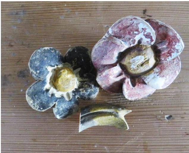
Figur 3 Løse deler som er knekt av altertavlen

Det er tre mindre deler av utskjæringene som tidligere har falt av og oppbevares i kirken (figur 3). Blomstene hører til tavlens bekrøning, mens den avknekte detaljen fra akantusranken hører til tavlens venstre side. Ellers er alle deler godt montert og stabile. Det ble observert noe boremel fra treborende insekter på gesims i øvre del av altertavlen. Det er usikkert om det er aktive insekter eller ei. Dette bør undersøkes nærmere ved hovedprosjektet.