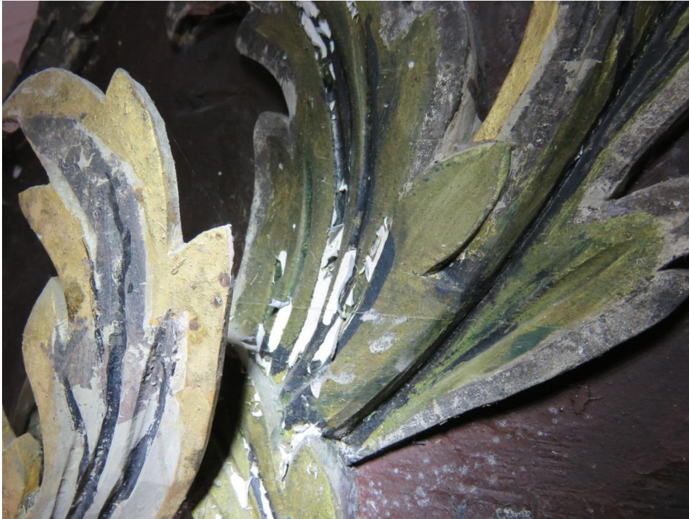
Figur 4 Detalj av løs maling på korpus, øvre del av altertavlen