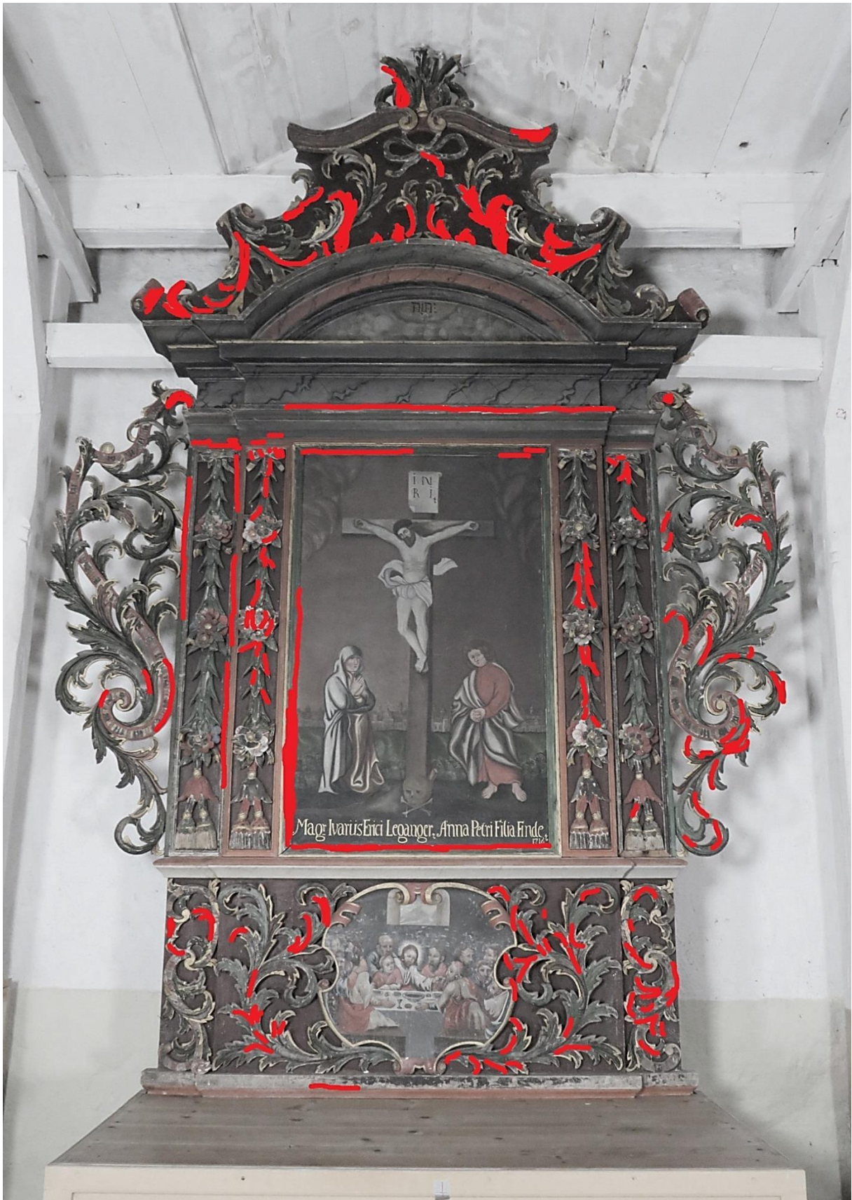
Figur 6 Røde merknader: områder med løs maling