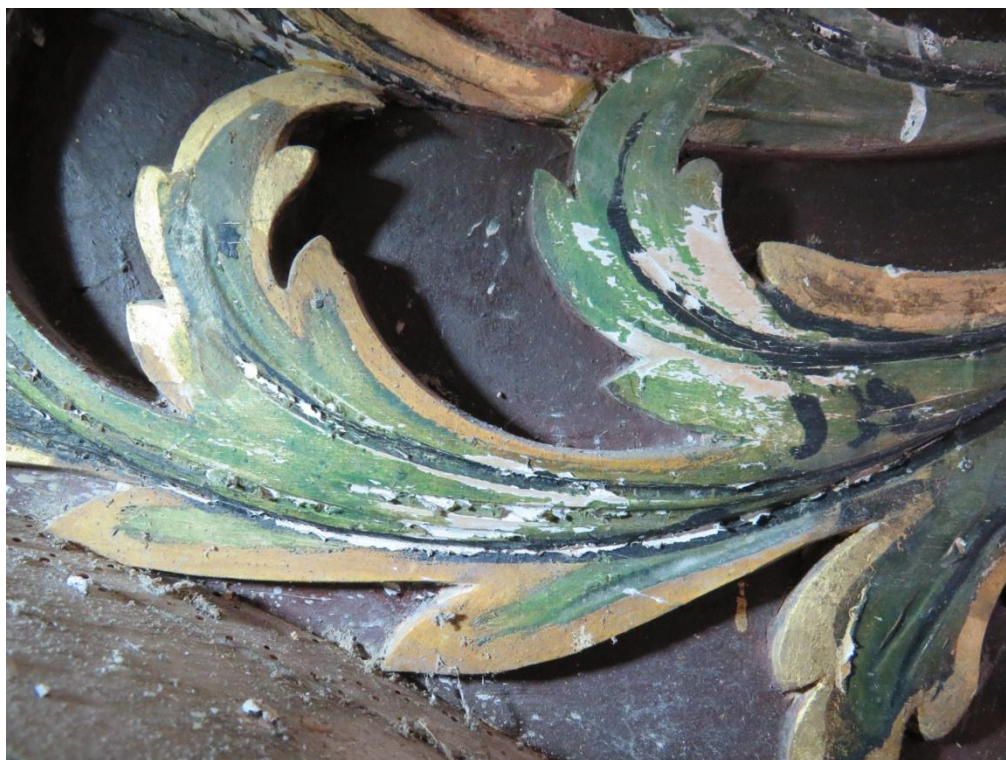
Figur 5 Detalj av løs maling på korpus, øvre del av altertavlen