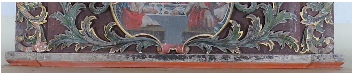
Figur 8 Maling på nedre listverk mangler

Listverk i altertavlens nedre del er svært slitt og malingen er borte (figur 8). Dette kan ha vært forårsaket av vask med vann/ fuktig klut.