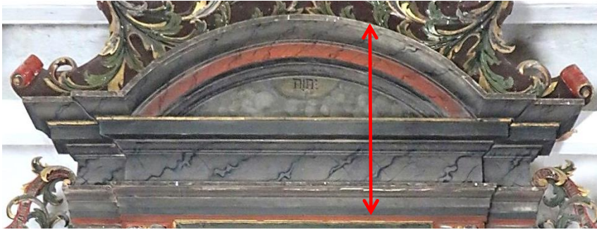
Figur 9 Arkitekturelementer som anbefales renset for sot