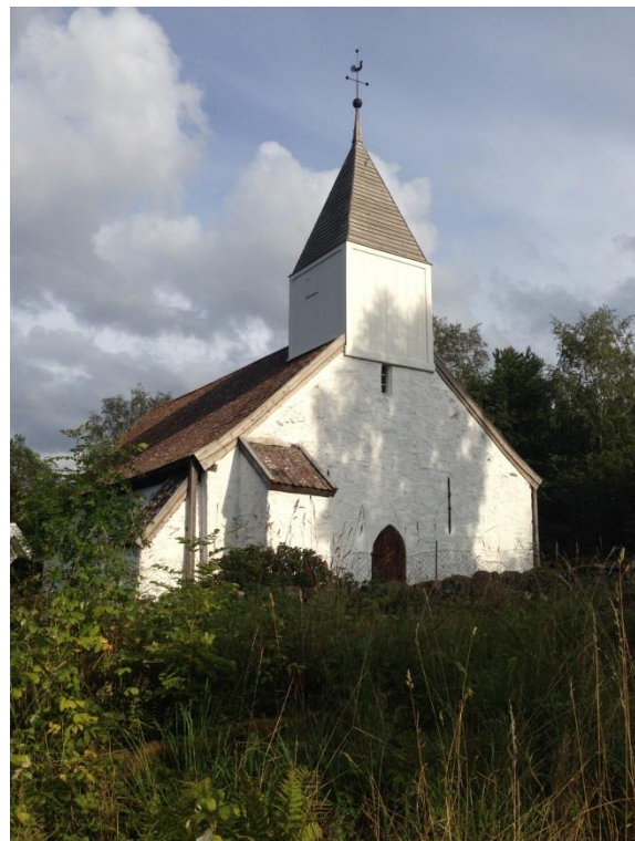
Figur 1 Kvamsøy kirke, juni 2017

Kirken har ikke innlagt strøm og som belysning brukes stearinlys. Kirken er fredet etter Kulturminnelovens § 4, som er automatisk fredning grunnet alder.