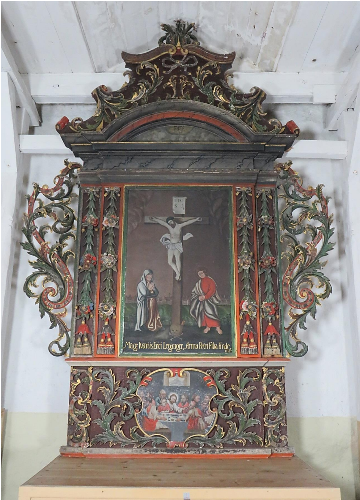
Figur 2 Altertavlen fra 1716