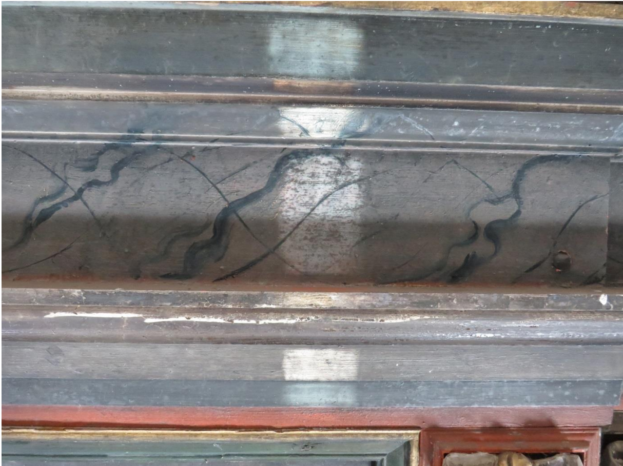
Figur 10 Rensetest av sot på listverk over «Korsfestelsen». Bruk av viskelær

Alle overflater er støvede, det er spor av spindelvev, fugleekskremitter og svært mye sot. De sotede overflatene sees særlig i øvre del av altertavlen, på gesims og gavlfelt (figur 9). En test for rensing av sot viser hvor skitne elementene er (figur 10).