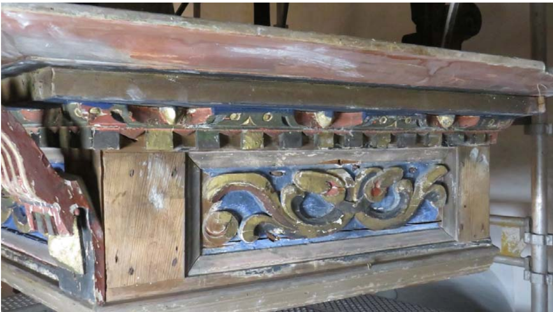
Figur 7 Dekorelementer - to falske konsoller - manglet på lydhimlingen, på feltet inn mot østveggen. Foto: NIKU 2017.