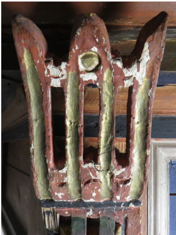
Figur 15 Falsk konsoll før retusj.