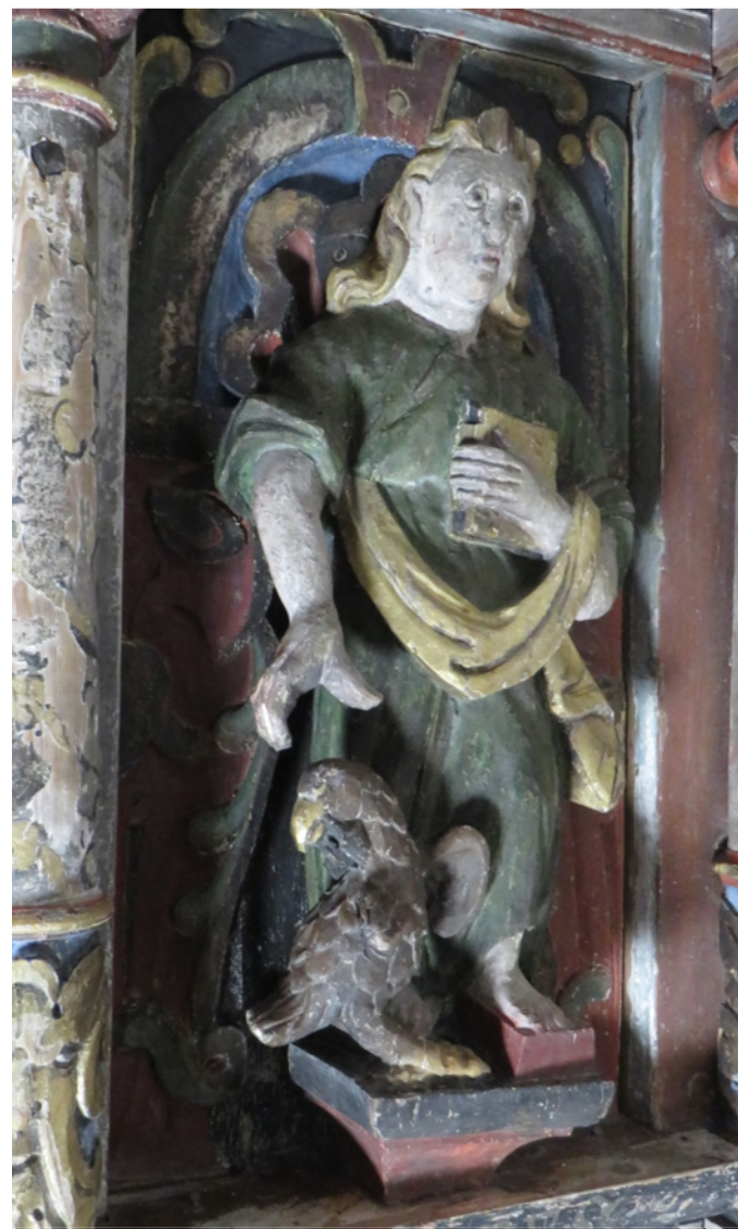
Figur 24 Prekestol felt Johannes ett behandling. NIKU 2017