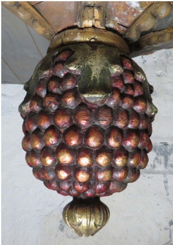
Figur 5 Dru eklase som avslutning på prekestolens løk. Trolig er stafferingen fra etter reparasjon i 1945. Rød lasur på gull, grønn lasur på sølv.