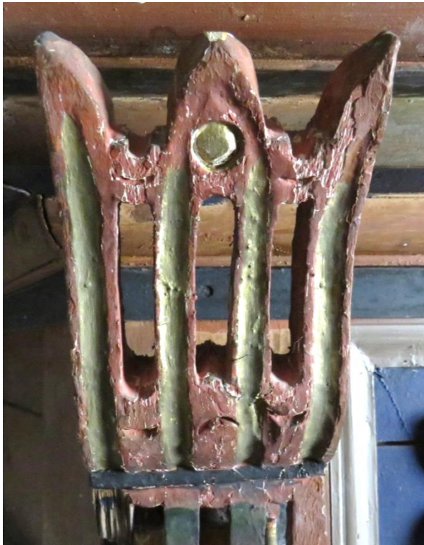
Figur 16 Falsk konsoll etter retusj.