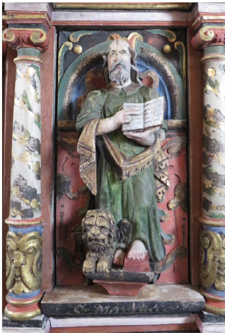
Figur 20 Prekestol felt Markus, etter behandling. NIKU 2017.