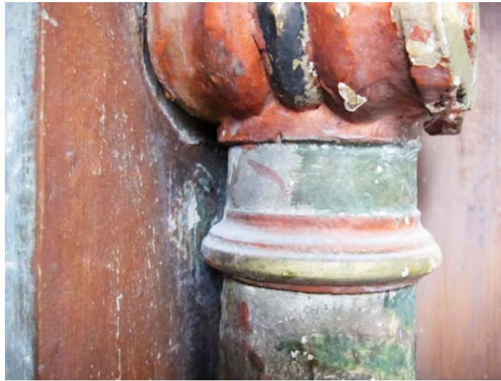
Figur 3 Felt Johannes, detalj før behandling. Område med opprinnelig lys blå maling.