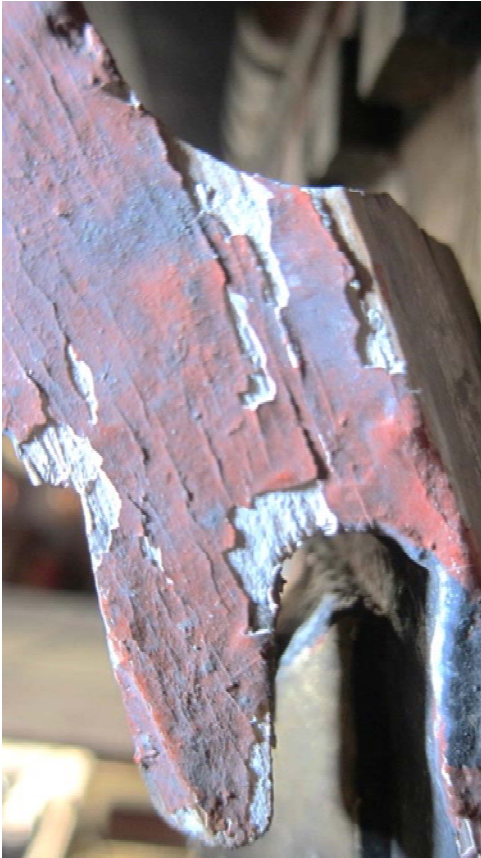
Figur 11 Område med opp- og avskallinger i rød maling på lydhimling.