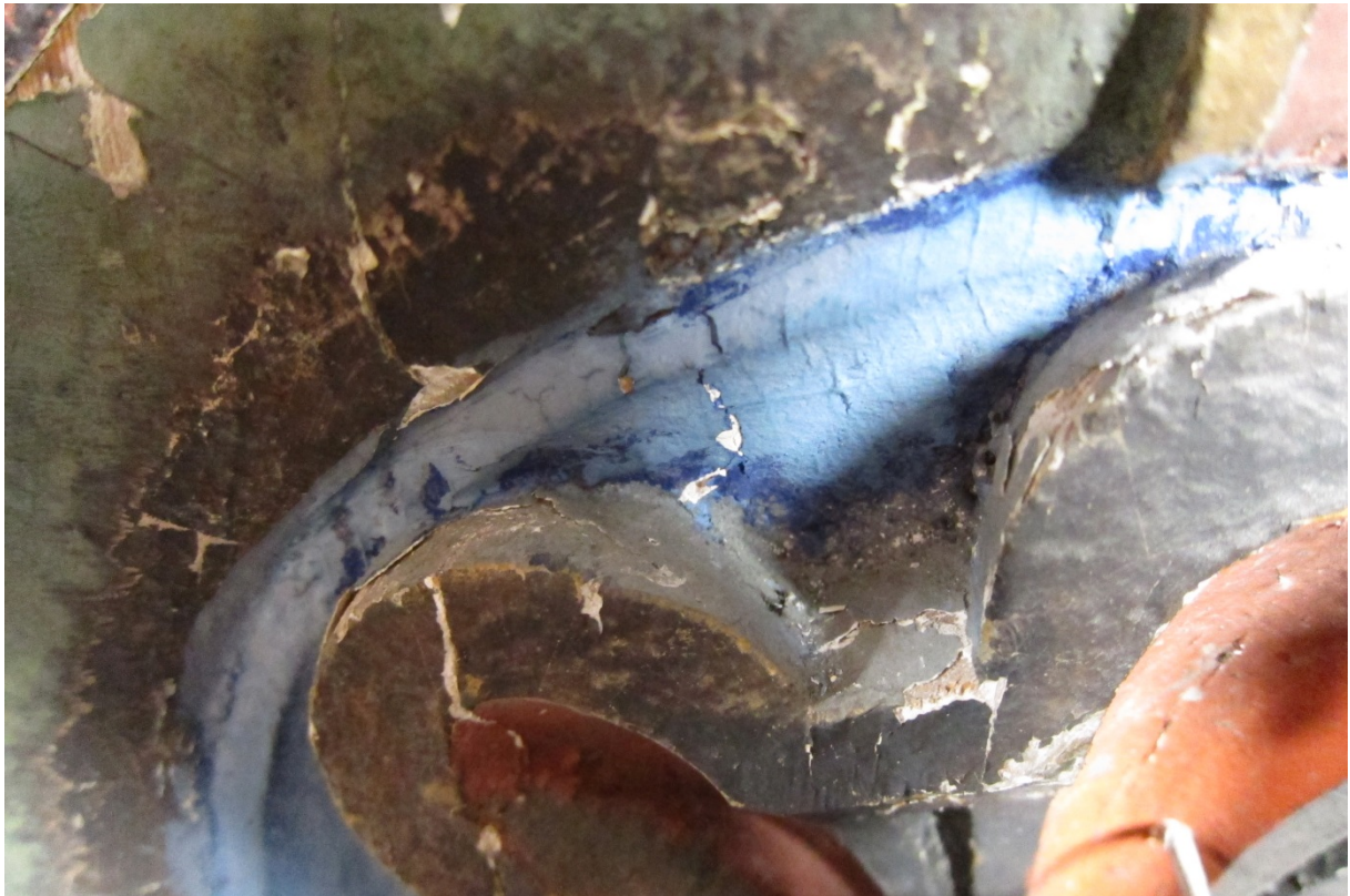
Figur 10 Område med større opp- og avskallinger. Skadebildet var representativt for bakgrunn i feltene. Nyere spiker som sikret skulpturen til nisjen vises i nedre høyre hjørne. Foto: NIKU 2017.

Malingslaget på de nyere elementene var støvete, men ellers i god stand.