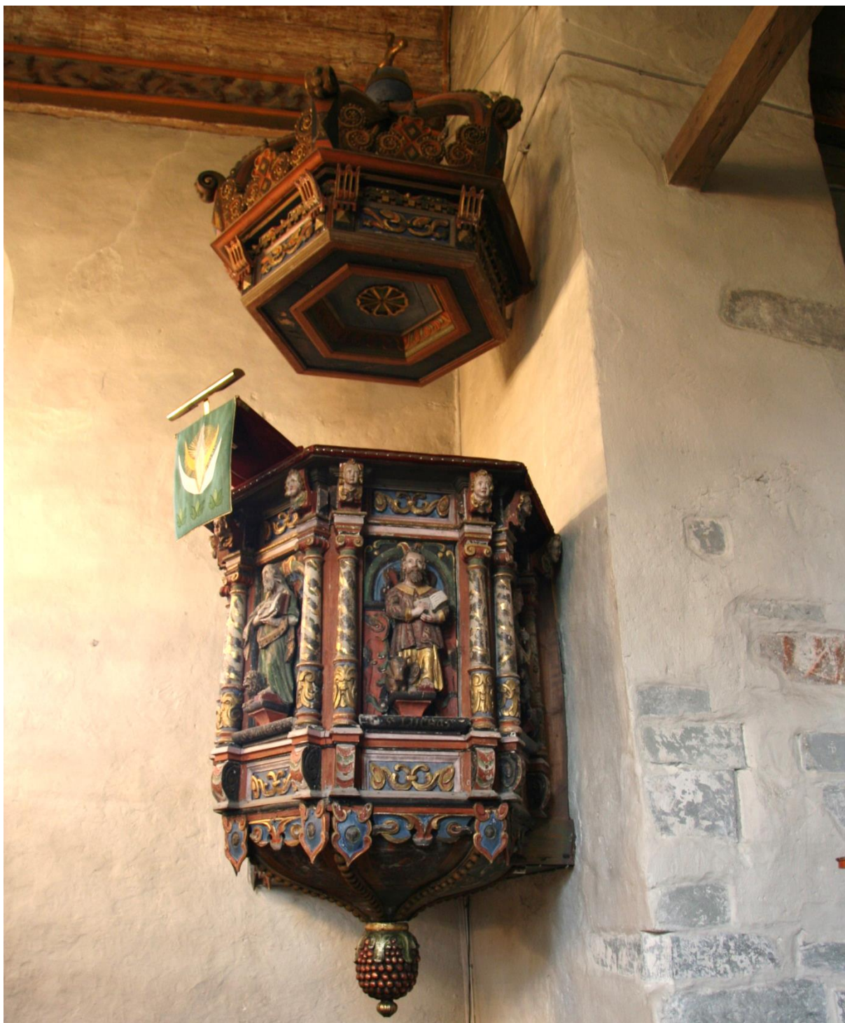
Figur 2. Heloptak mot nord.