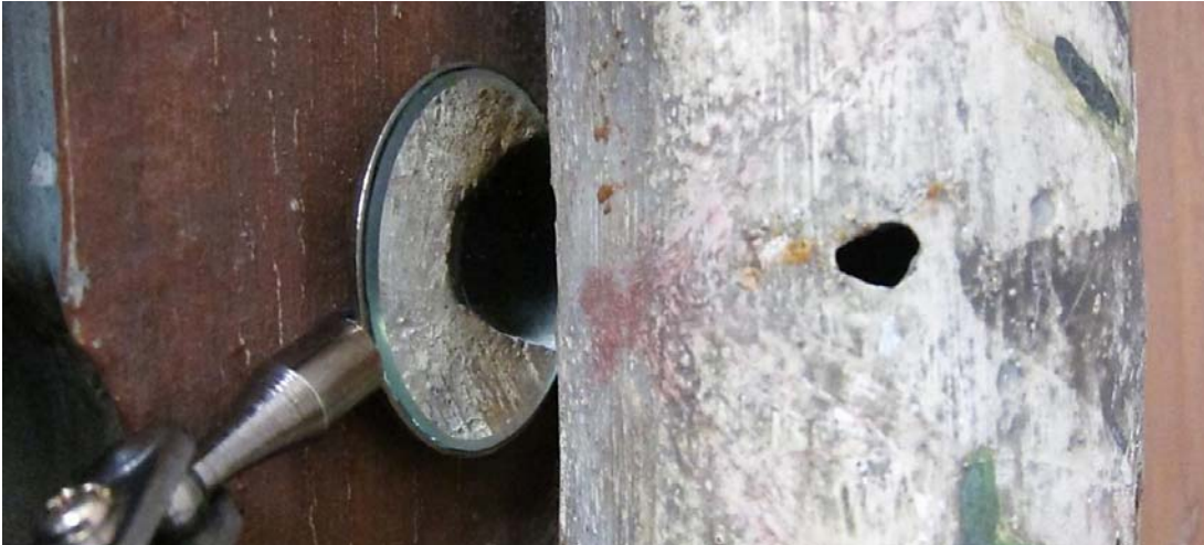
Figur 8 Hulrom i søyle. Lite hull kunne ses på søylens forside, stort hull kunne ses fra søylens bakside, i speilbildet.