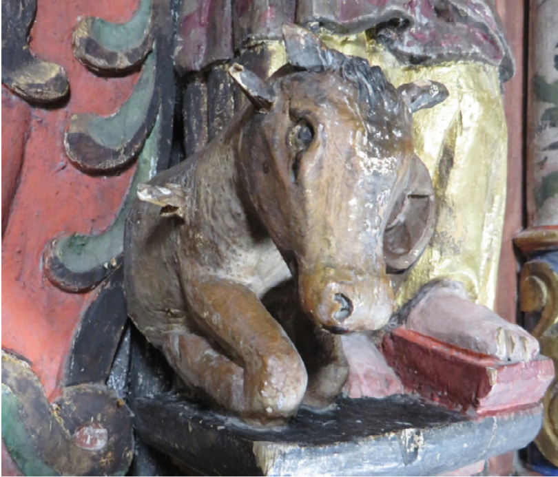
Figur 6 Oksens venstre vinge (for betrakter) er brukket av.