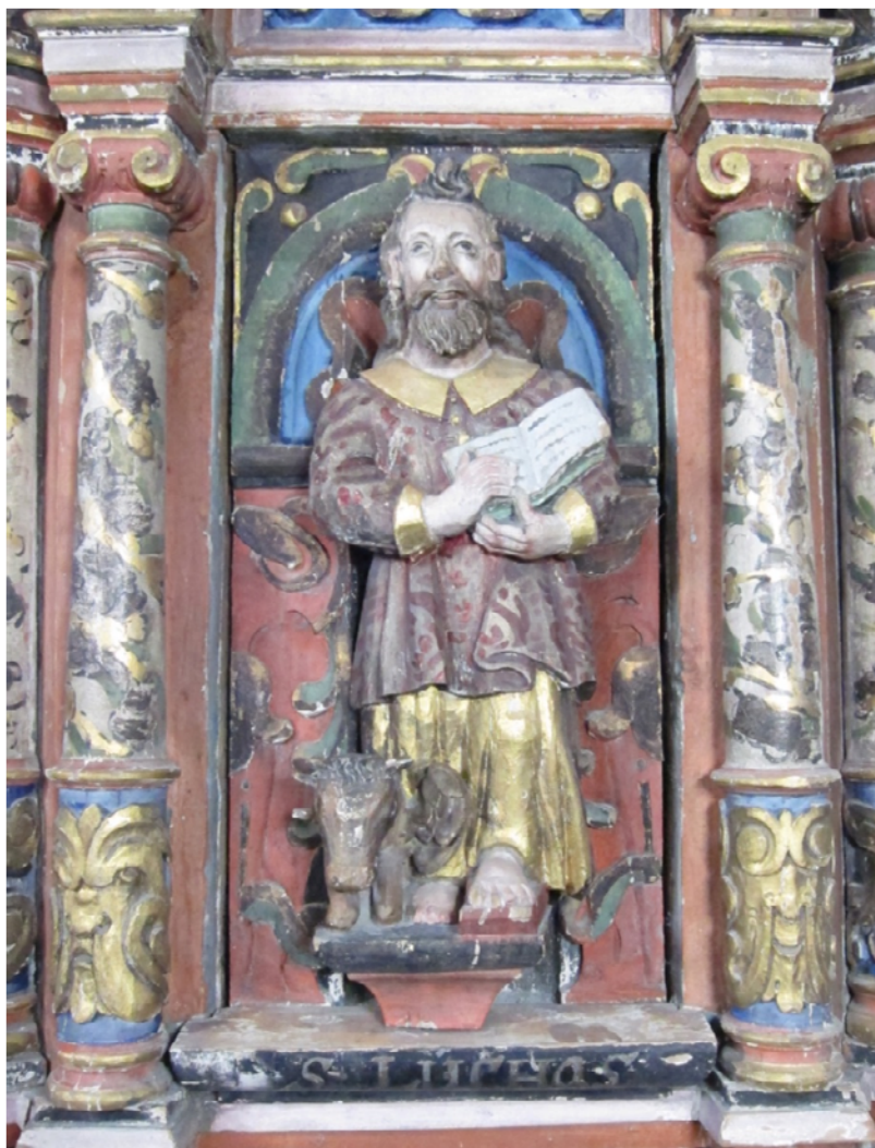
Figur 21 Prekestol felt Lukas, før behandling. NIKU 2017.