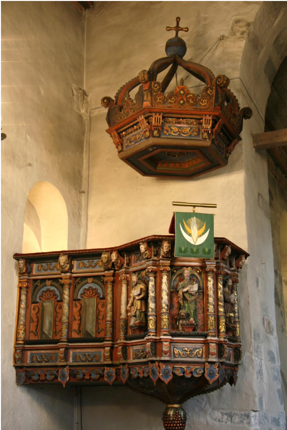
Figur 1. Helopptak mot øst. Foto: Riksantikvaren 2007.