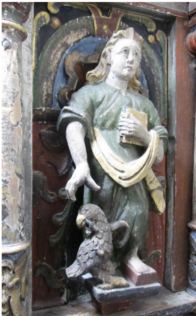
Figur 23 Prekestol felt Johannes før behandling. NIKU 2017.