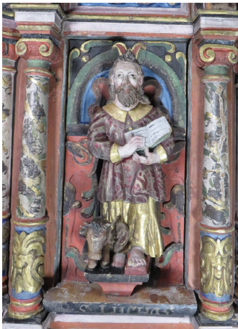
Figur 22 Prekestol felt Lukas, etter behandling. NIKU 2017.