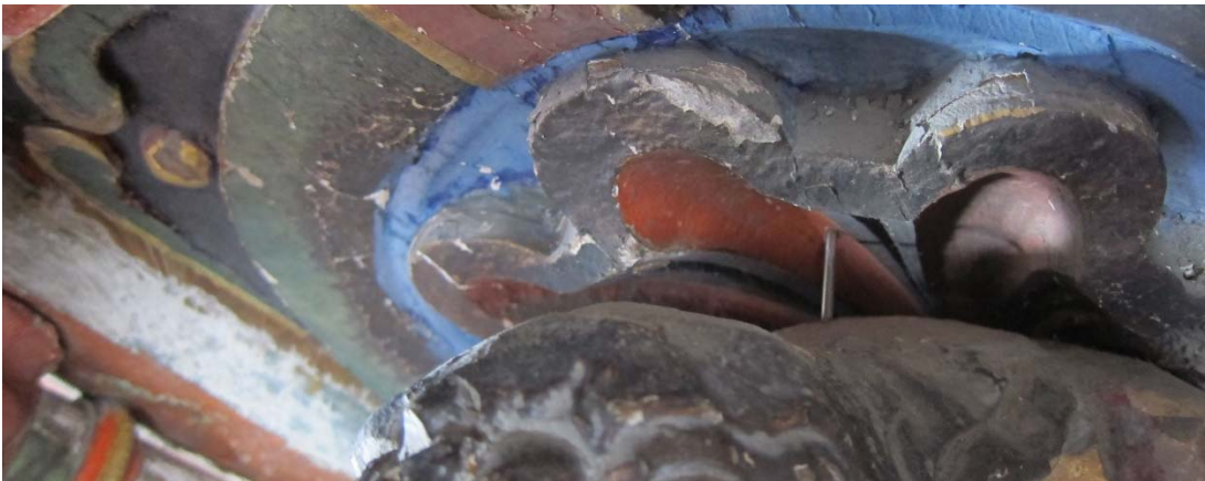
Figur 9 I tillegg til tapping er skulpturer er sikret med nyere spiker slått fra innsiden av prekestolen.