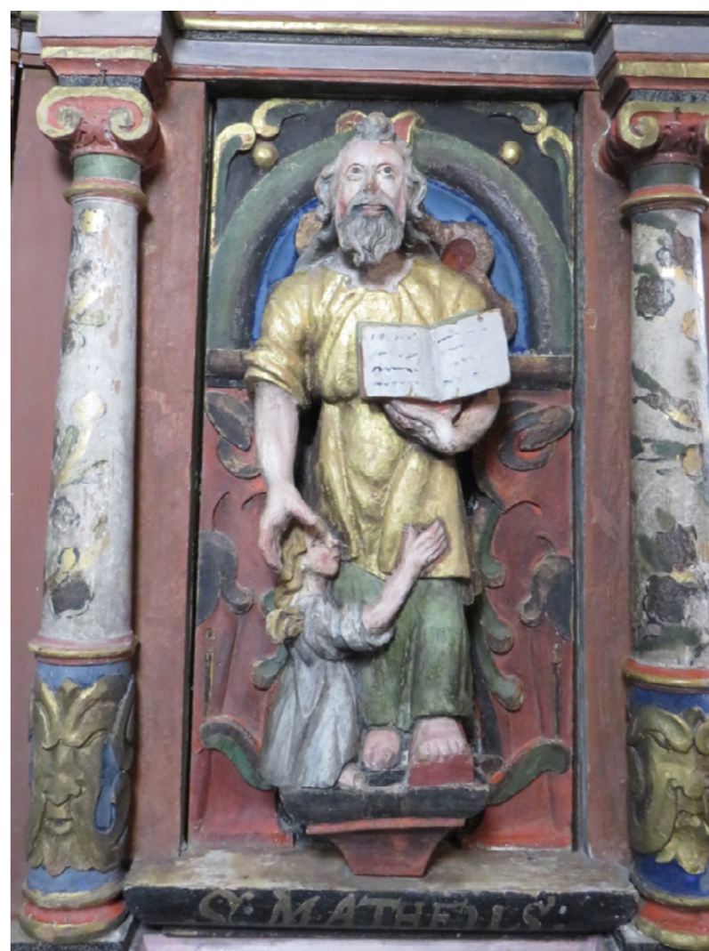
Figur 18 Prekestol felt Matheus, etter behandling. NIKU 2017.