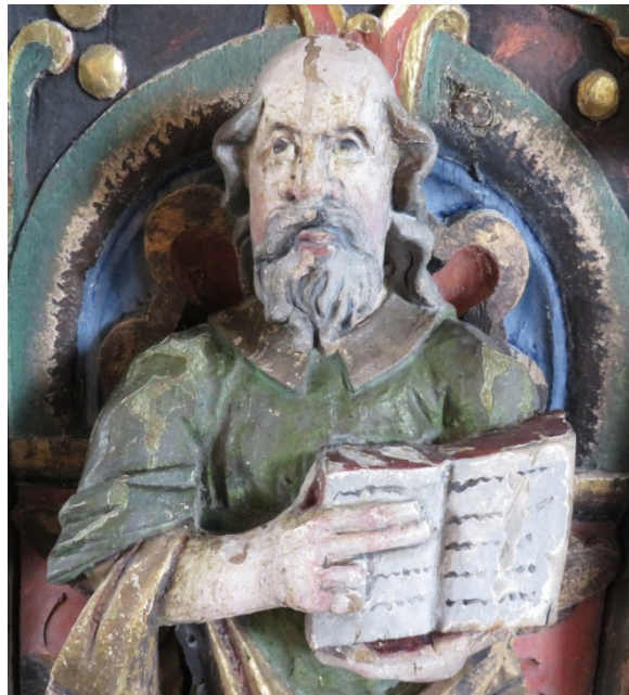
Figur 14 Markus' kappe etter retusj.