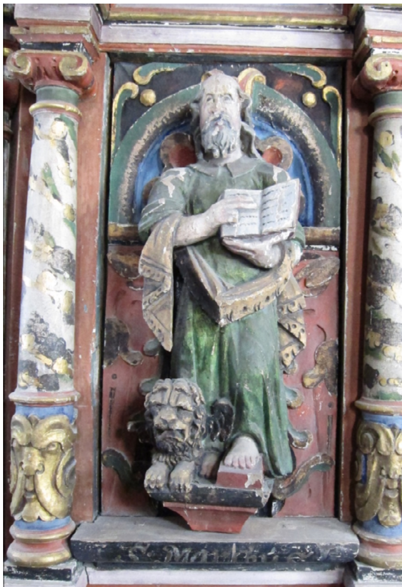
Figur 19 Prekestol felt Markus, før behandling. NIKU 2017.