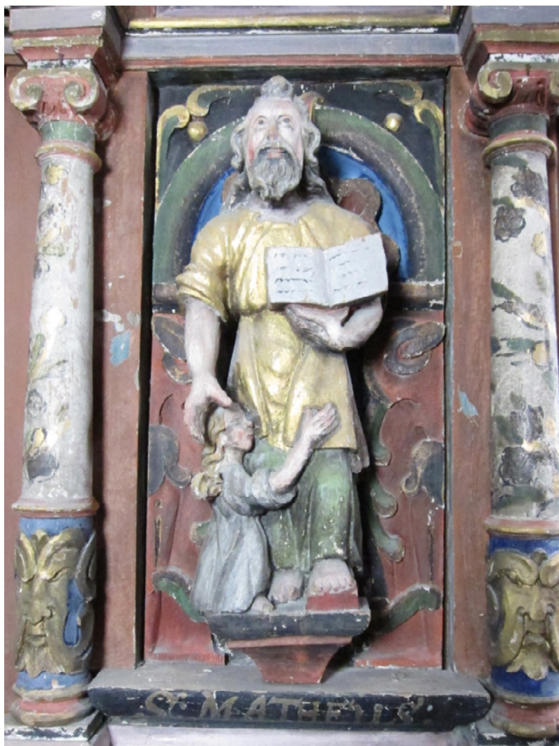
Figur 17 Prekestol felt Matheus, før behandling. NIKU 2017.