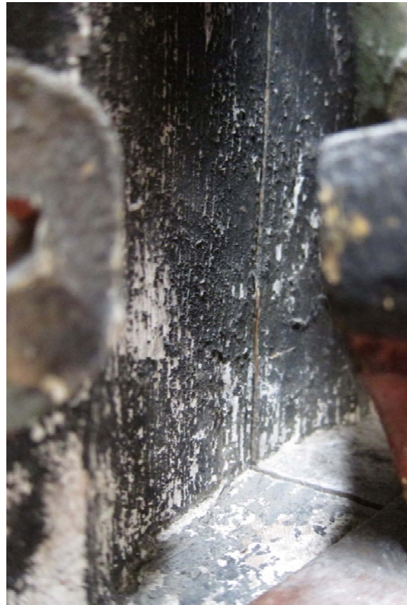
Figur 12 Område med mange små opp- og avskallinger i opprinnelig svart maling på nisjevegg bak skulptur.