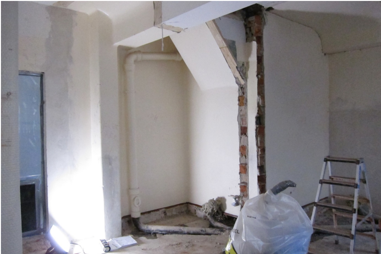
Figur 14 Rom 004, mot sørøst.

Områder med lys blå veggfarge tilsvarende funn i pasientværelsene i 1., 2. og 3. etasje står imidlertid uovermalt på sørvegg i rom 021, så fargen har blitt benyttet også i 4. etasje (Figur 18 og 19). På vestveggen mot lysgården er det også rester som kan ha vært lys blå limfarge. Dette kan om ønskelig undersøkes næyere.