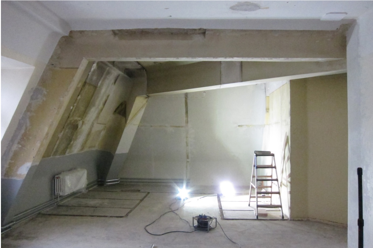
Figur 8 Rom 012, mot nord. Opprinnelig bevegelssone.