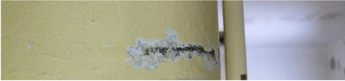
Figur 3 Undersøkt område på vegg i sørfløy, østre vindu, østre smyg, ca. 190 cm over gulv. Avdekket svart malt linje.