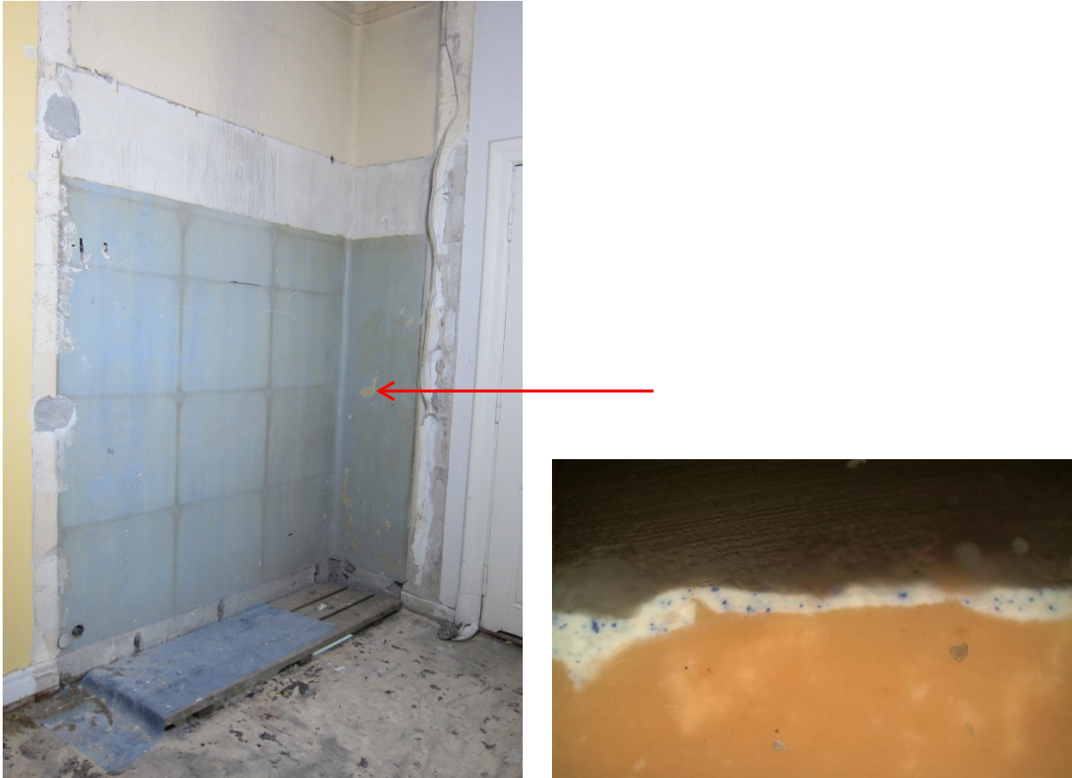
Figur 1 Undersøkt område, bak ventilasjonsskap