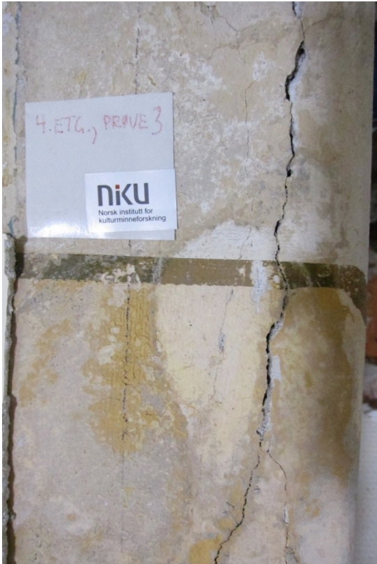
Figur 15 Rom 004, bakside trapp, mot sør. Nyere oppmaling med strekdekor.