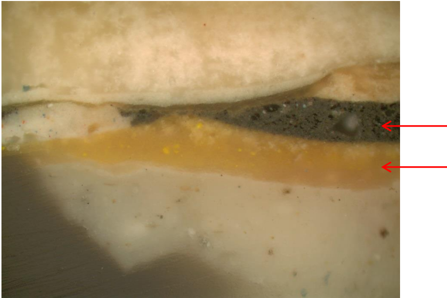
Figur 4 Tverrsnitt av malingslag på vegg ved vindu, ca 190 cm over gulv. Pilene viser et pigmentert gult lag med et svart lag over. Det gule laget er trolig den første veggfargen på nedre del av vegg i korridor, og det svarte laget er en linje som markerer skillet mellom øvre og nedre del av vegg.