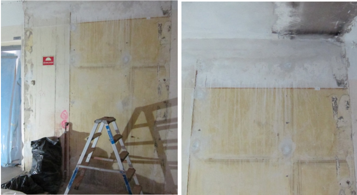
Figur 11 Rom 029, mot nord.