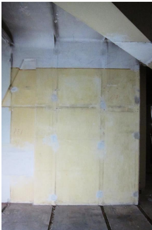
Figur 9 Rom 012, mot øst. Lys gul og hvit vegg malt med limfarge, overgang markert med malt rødbrun strek 240 cm over gulv.