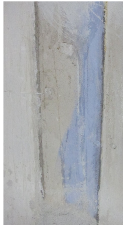
Figur 18 Rom 021, mot øst, detalj. Godt bevart lys blå limfarge på vegg.