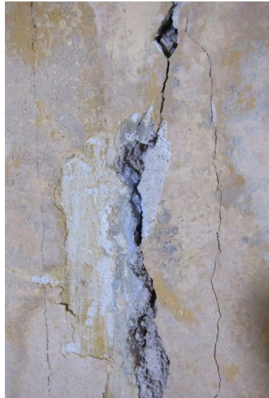
Figur 16 Rom 004, mot sør, detalj. Rester av lys blå limfarge i sprekk i muren.