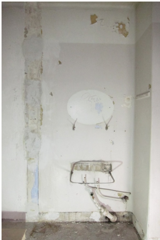
Figur 17 Rom 021, mot sør. Områder med lys blå limfarge på vegg.