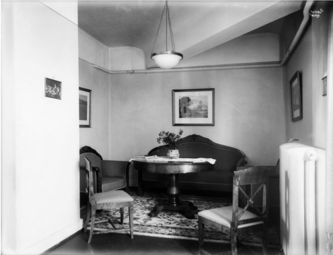
Figur 7 Fellesrom i sørvestre hjørne i 4. etasje, inn mot lysgård?