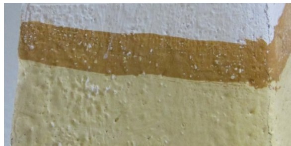
Figur 10 Rom 012, mot øst, detalj. Område med svært godt bevart opprinnelig limfarge.