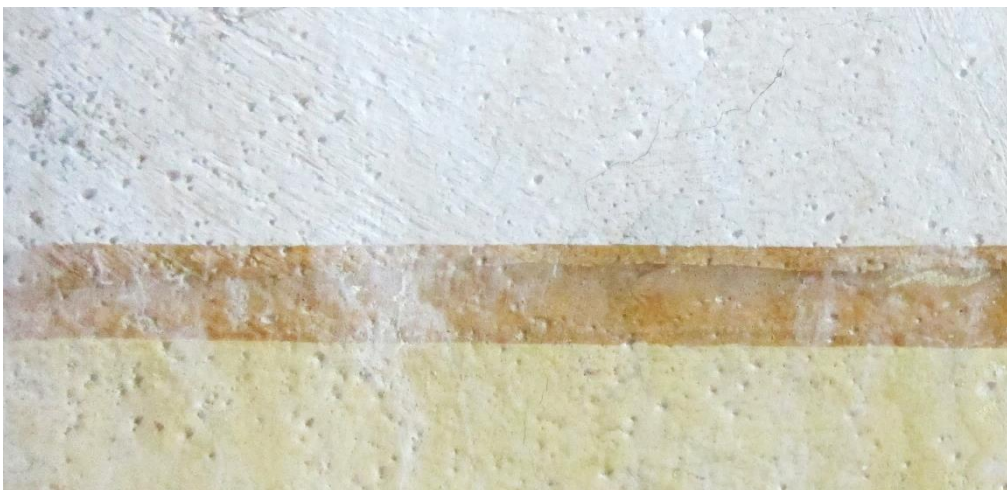
Figur 13 Rom 029, mot nord, detalj. Område med skitten, men godt bevart opprinnelig limfarge.