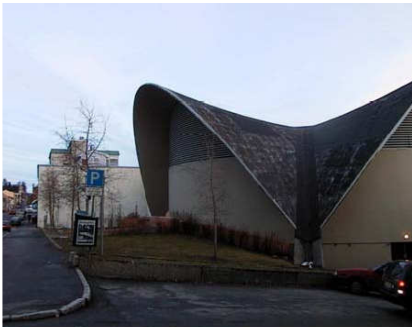
Fokus kino.

Fokus kino ble bygget etter en lokal arkitektkonkurranse i 1969 som ble vunnet av arkitekt Gunnar Bøgeberg Haugen fra Tromsø (Herland 2005). Inspirert av den meksikanske arkitekten Felix Candela tegnet Haugen et betongskall, eller en hyperbol parallelloide . Skallet er bare 12 cm tykt og har fire støttepunkter som bærer hele konstruksjonen. Taket var opprinnelig planlagt kledd med kobberplater, men fikk kun tekking av asfaltpapp. Under skallet ble kinobygningen utformet som en rotunde av betong, med gitterverk i det øverste fasadepartiet mot skallet.