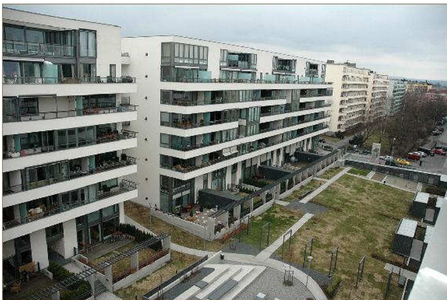
Marienlyst Park med de eldre bygningene til høyre i bildet (etter Ødegården 2006).

I følge arkitektenes beskrivelse i Byggekunst var intensjonen å ” videreutvikle kvalitetene i den eksisterende lamellbebyggelsen. Identiteten skulle fortsatt ligge i fasader med rene flater, enkel materialbruk og med sammenhengende horisontale balkongbrystninger ” (Lund Hagem Arkitekter AS 2005).