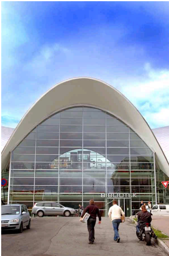
Biblioteket. Foto: Rune Stoltz Bertinussen (faksimile etter Garfjeld 2005).

kontakt med kommunen og anbefalte at kinobygningen ble stående. Riksantikvaren ble også trukket inn i saken, og mente at kinobygningen burde bevares. I sin høringsuttalelse til reguleringsplanen anbefalte fylkeskommunen vern av hele denne bygningen, men valgte å ikke fremme innsigelse til at rotunden skulle rives.